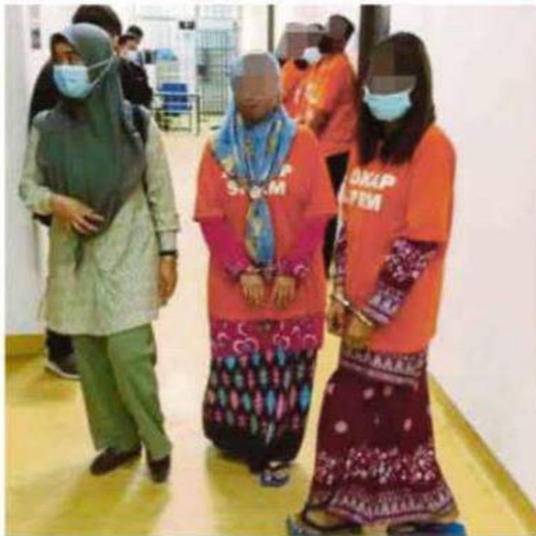
Dua wanita antara 7 petugas kaunter JPJ yang ditahan SPRM, semalam.

Sumber berkata, mereka yang ditahan itu membabitkan lima kakitangan lelaki dan dua wanita berusia antara 27 hingga 42 tahun yang semuanya dipercayai bertugas di JPJ Johor Bahru.