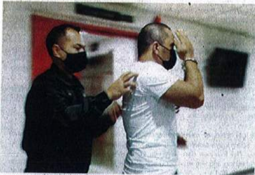
Tertuduh (kanan) didakwa di Mahkamah Sesyen Kuala Terengganu pada Isnin.

KUALA TERENGGANU - Seorang lelaki dijatuhi hukuman penjara tujuh hari dan denda RM11,500 oleh Mahkamah Sesyen di sini pada Isnin selepas mengaku salah memberi sogokan sebanyak RM2,300 kepada seorang anggota polis pada Februari lalu.