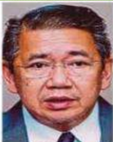
Datuk Seri Salahuddin Ayub

"They offered luxurious holiday packages to me and my family. An all-expenses-paid trip to Europe. But I had to decline," he said in a special interview with the New Straits Times and Berita Harian recently.