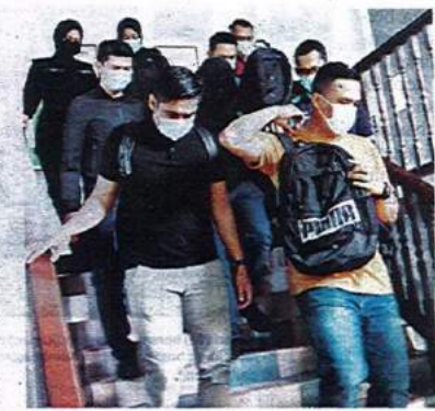
Tertuduh (tengah) ketika dibawa ke Mahkamah Sesyen Melaka pada Selasa.

Mahkamah membenarkan ikat jamin sebanyak RM5,000 dengan seorang penjamin bagi kedua-dua pertuduhan dan menetapkan 21 Mei depan sebagai