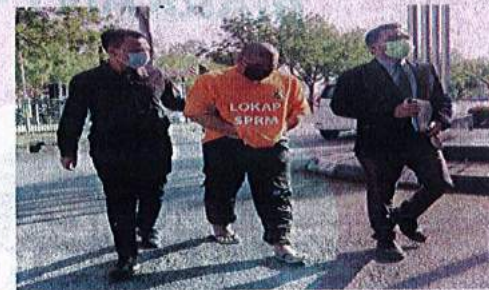
Suspek diiring penguat kuasa SPRM ketika tiba di mahkamah pada Selasa.

Kes disiasat mengikut Seksyen 16 (a)(A) Akta SPRM 2009.