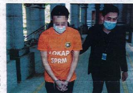
JURUUKUR (kiri) yang ditahan semalam tujuh hari di Mahkamah Majistret Putrajaya semalam bagi membantu siasatan kartel projek kerajaan.

"Suspek dipercayai menerima rasuah bagi membocorkan maklumat berhubung spesifikasi pro-