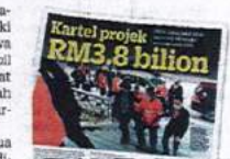
KERATAN Kosmo! semalam.