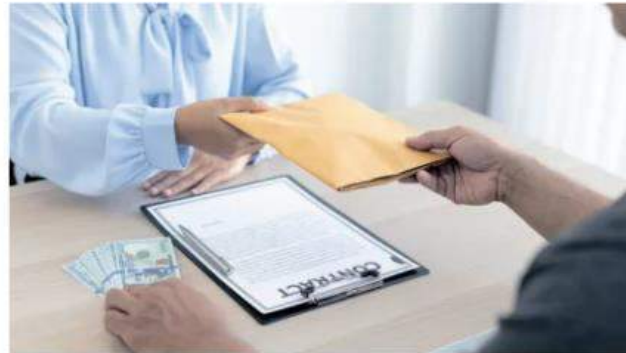
Jenayah rasuah atau bisnes dan rasuah seiring boleh berlaku di mana-mana sahaja sama ada oleh orang dalam sesebuah agensi atau organisasi sendiri ataupun ekoran kerjasama atau pembabitian pihak luar dan syarikat.

Apabila wujud tanggapan 'bisnes dan rasuah berjalan seiring' maka ia adalah petanda dan salah satu ciri ekonomi serta amalan perniagaan dalam negara yang sedang membangun di mana urus tadbir tidak sejajar dengan amalan baik.