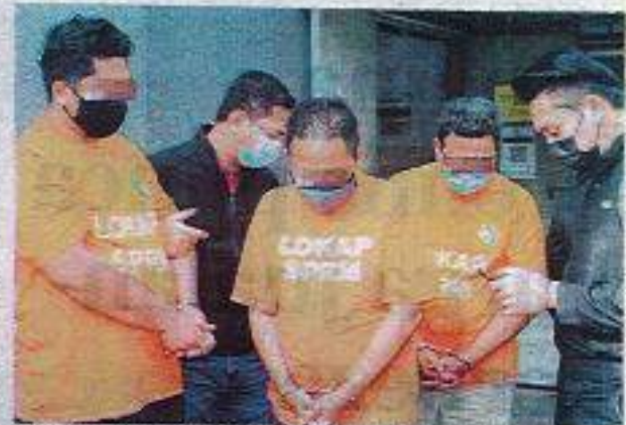
Tiga pegawai MAQIS Johor dan Mahkamah Majlisraya Bahru, selepas ditangkap penitah tahanan negeri lima hari, semalam.

Empat suspek berusia 18 dan 23 tahun itu adalah pengarah, per- garah operasi dan kakam dari- pada sebuah syarikat sejuk beku, manakala seorang lagi pengarah