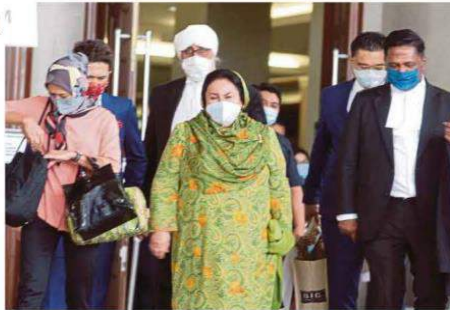
Rosmah keluar dari Mahkamah Tinggi Kuala Lumpur, semalam.

Wang berkenaan sebagai upah membantu Jepak Holdings mendapatkan projek dikenali sebagai Projek Bersepadu Sistem Solar Photovoltaic (PV) Hibrid dan Penyelenggaraan serta Operasi Gen-set/Diesel bagi 309 Sekolah Luar Bandar Sarawak yang bernilai RM1.25 bilion secara rundingan terus daripada Kementerian Pendidikan.