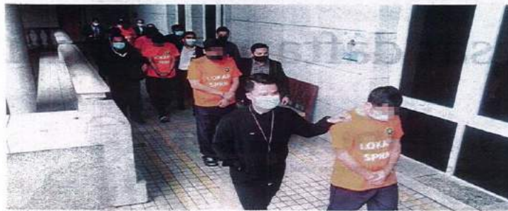
Anggota SPRM membawa tujuh suspek ke Mahkamah Majistret, Putrajaya, semalam.