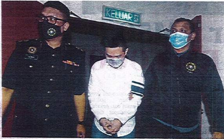
LEN ketika didakwa di Mahkamah Sesyen Shah Alam, kelmarin.

Dia turut berdepan 10 pertuduhan menerima rasuah iaitu lima cek dan wang tunai RM2,139,650 daripada beberapa individu sebagai upah membantu syarikat KK Choong Synergy Sdn Bhd mendapatkan subkontrak Perjanjian Reka dan Bina