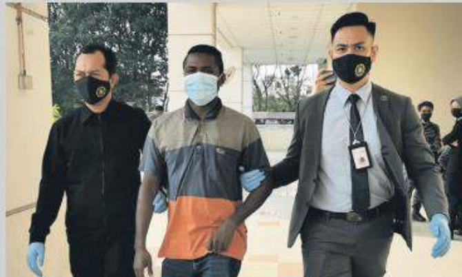
Tertuduh diiringi pegawai SPRM di Mahkamah Sesyen Seremban pada Selasa.