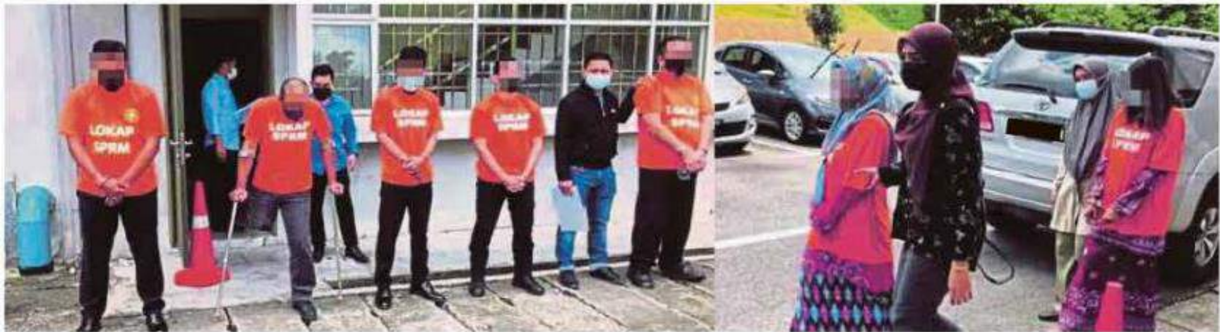
TUJUH petugas kaunter JPJ termasuk dua wanita (gambar kanan) ditahan untuk bantu siasatan.