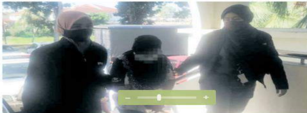
Seorang wanita dipercayai wakil peguam direman lima hari bagi membantu siasatan kes meminta wang RM18,000 di Alor Setar pada Ahad.

Kes disiasat di bawah Seksyen 16 (A) (a) Akta SPRM 2009.