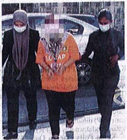
Suspek direman selama enam hari untuk membantu siasatan.

JOHOR BAHRU – Suruhanjaya Pencegahan Rasuah Malaysia (SPRM) Johor menahan seorang penyelia sebuah sekolah asrama di Kota Tinggi bagi membantu siasatan kes membuat tuntutan palsu kontrak pembekalan makanan pelajar sekolah bernilai hampir RM20 juta.