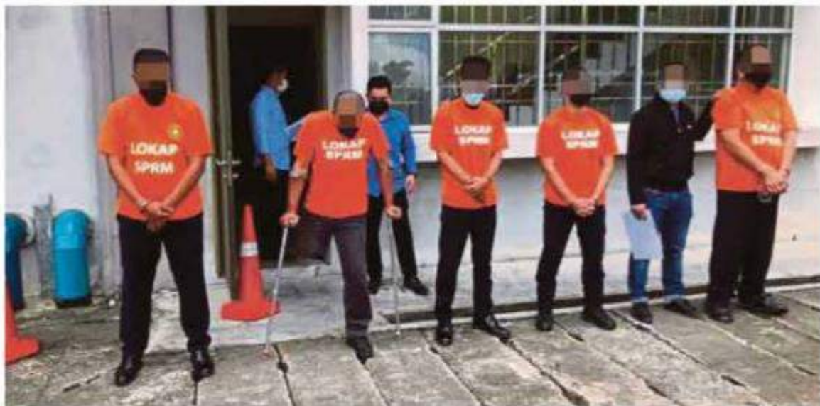
Lima petugas kaunter JPJ Johor yang ditahan SPRM, semalam.