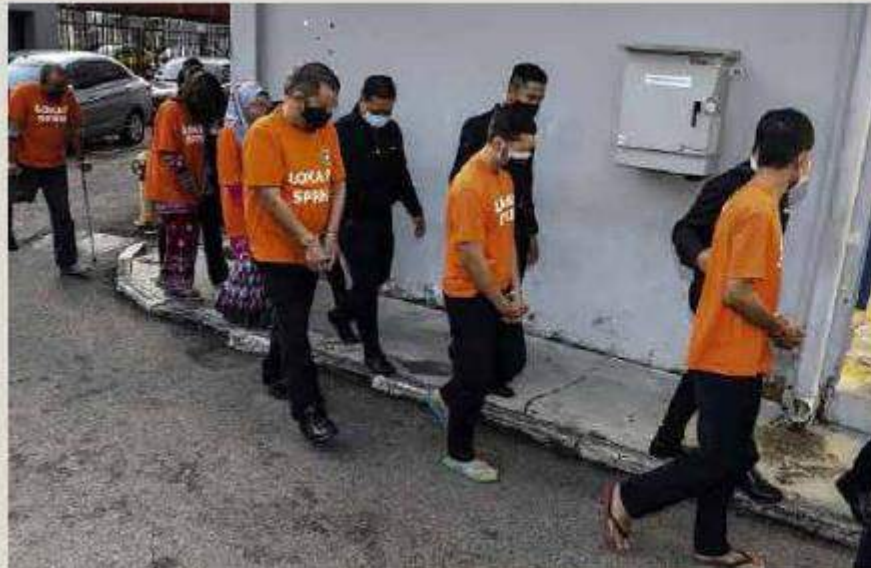
TUJUH kakitangan JPJ Johor direman tujuh hari mulai semalam.