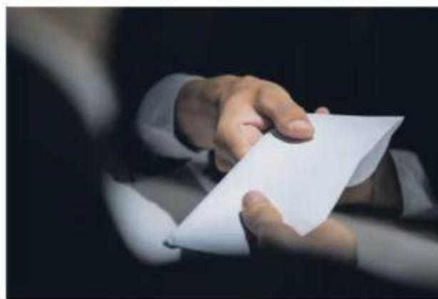
Krisis wabak yang melanda seluruh dunia ketika ini dilihat membuka peluang kepada berlakunya pencabulan integriti seperti rasuah dan penipuan.

"Disebabkan terdapat mekanisme singkat yang diletakkan semasa pandemik ini bagi mendapatkan barangan dan perkhidmatan penting, individu korup akan cuba menggunakan isu global tentang kekurangan