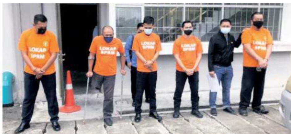
Antara kakitangan JPJ Johor yang ditahan bagi membantu siasatan kes ketirisan kutipan bernilai RM3.1 juta pada Ahad.

Menurut beliau, kescmua suspek dibawa ke Mahkamah Majistret Johor Bahru pada Isnin bagi proses reman dan kesiasatan dijalankan di bawah