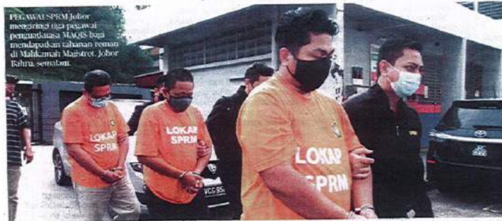
PEJABAT SPRM Johor mengedarkan tiga pegawai penuntut rasuah MAQIS bagi menyalakan tahanan reman di Mahkamah Majistret, Johor Bahru, semalam.

Sebutan semula kes ditetapkan pada 5 Mei depan.