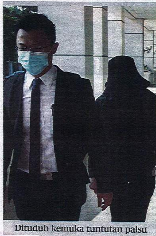
Dituduh kemuka tuntutan palsu

Mahkamah membenarkan tertuduh diikat jamin RM20,000 dengan seorang penjamin dan menetapkan 8 April ini untuk sebutan semula kes.