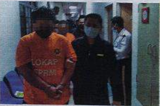
KES KARTEL DAGING