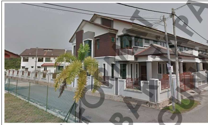
Pandangan Sisi Kiri