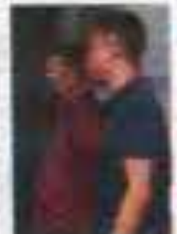
Anak tertuduh cuba menghalang tugas jurukamera semasa sidang media...