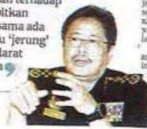
Azam Baki, Ketua Pengerusi SPRM

SPRM sentiasa melakukan sebaik mungkin untuk mengambil tindakan terhadap kes rasuah yang membabitkan ketirisan dalam negara, sama ada dilakukan 'ikan bilis' atau 'jerung' yang mendatangkan mudarat kepada rakyat dan negara