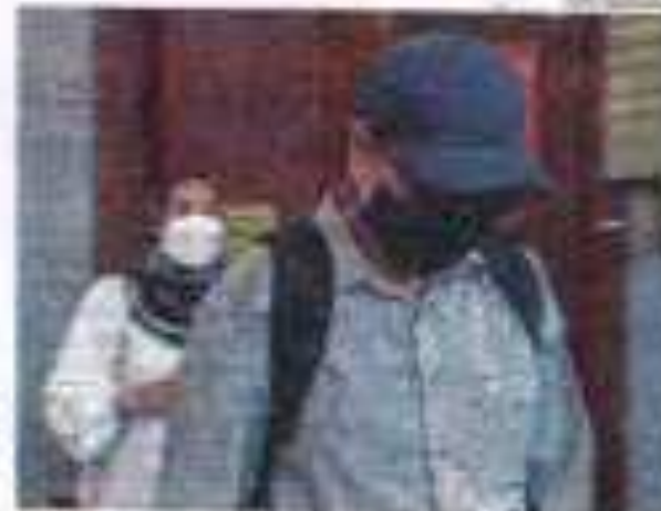
Seorang pegawai polis (kanan) akan ditutur di Mahkamah Rayuan Kuala Lumpur...