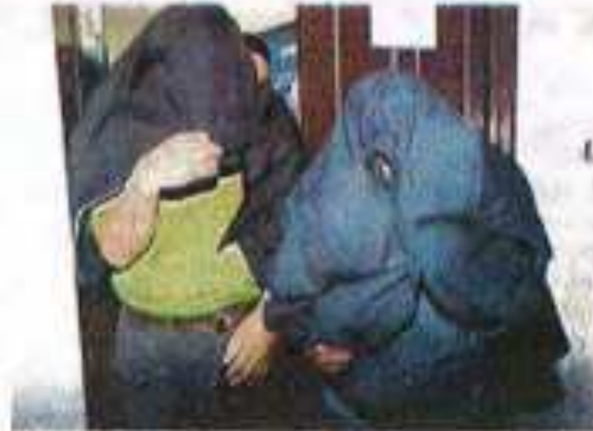
BEKAS Pengarah Imigresen Perak dan bekas ketua Unit Pendakwaan Imigresen negeri dituntut keluar dari Mahkamah Sesyen Ipoh, semalam.