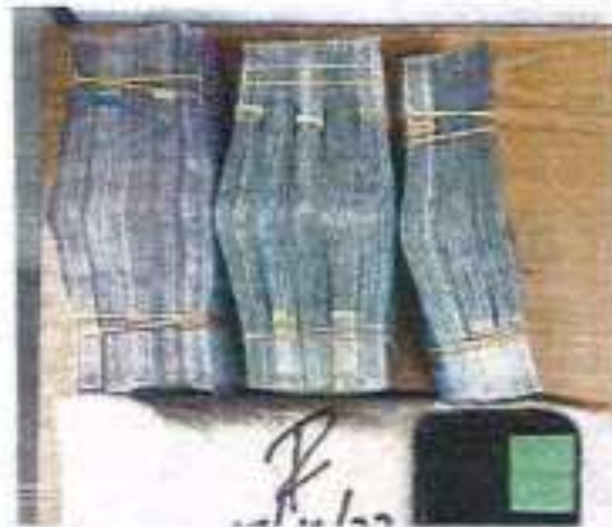
WANG yang ditawarkan kepada polis sebelum dewanar sebagai melepaskan rakan suspek yang disiasat bertubung kes tawaran kerja dalam talian yang tidak wujud.