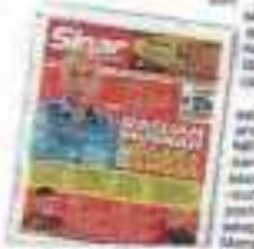
Peraturan sukan di Kemari Times pada Sabtu.