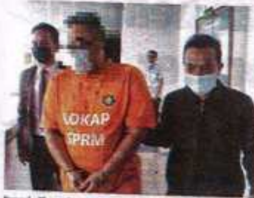
Suspek dibawa ke Kompleks Mahkamah Melaka pada Selasa.