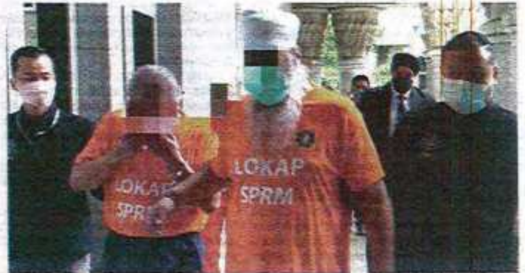
Tiga individu yang disyaki menerima rasuah lebih RM24 juta dibawa ke Mahkamah Majistret Putrajaya pada Selasa untuk proses reman.

Menurut sumber, suspek wanita berusia lingkungan 50-an bersama dua suspek lelaki berusia 53 hingga 58 tahun