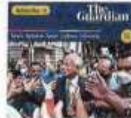
Najib Razak, Malaysia's Former Prime Minister, is headed to prison

Laporan sifatkan nasib bekas PM sebagai jatuh dari puncak kuasa terus ke penjara