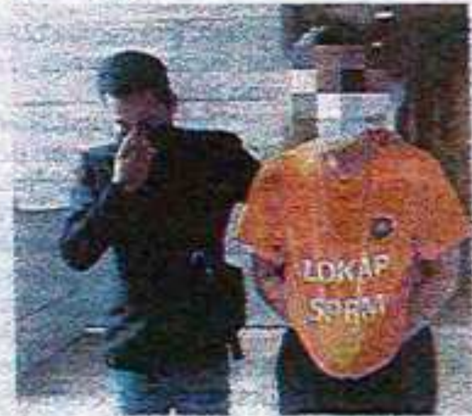
Suspek dibawa ke Mahkamah Majistret Putrajaya pada Sabtu untuk permohonan reman.