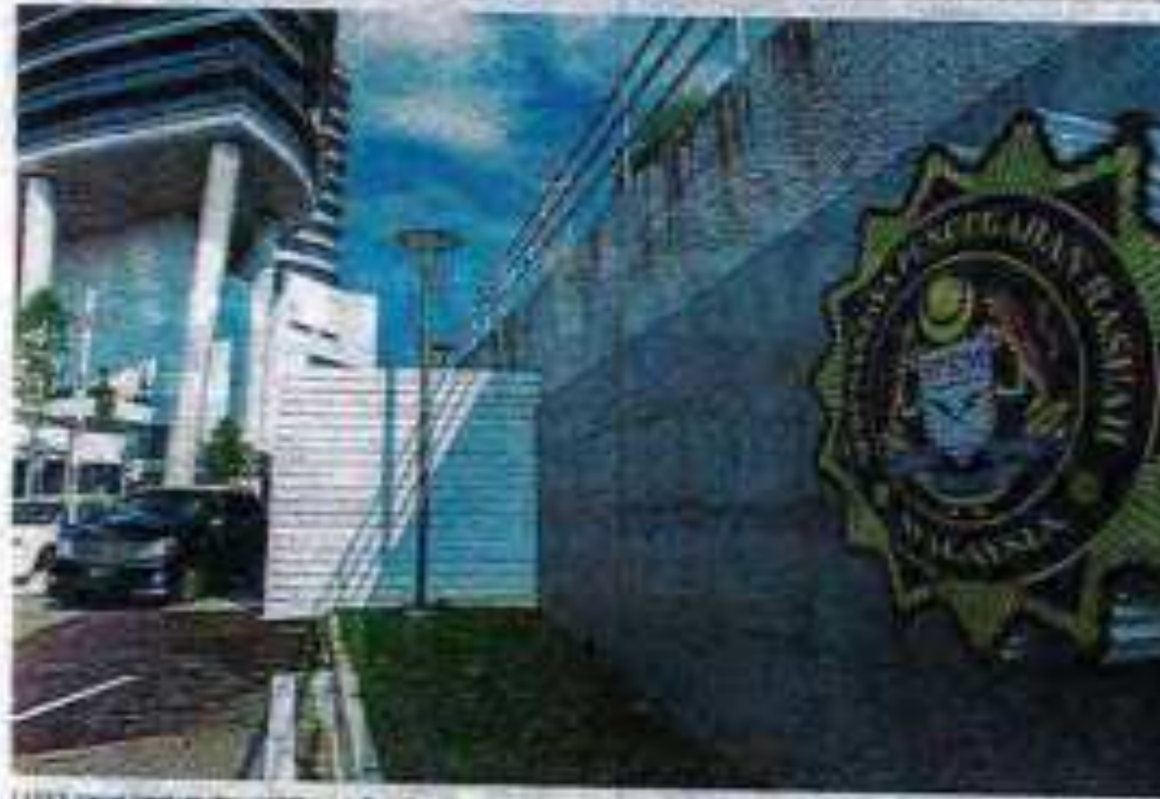
LARAK dapat bergaji dan keahlian trafik diurus pegawai SPRM