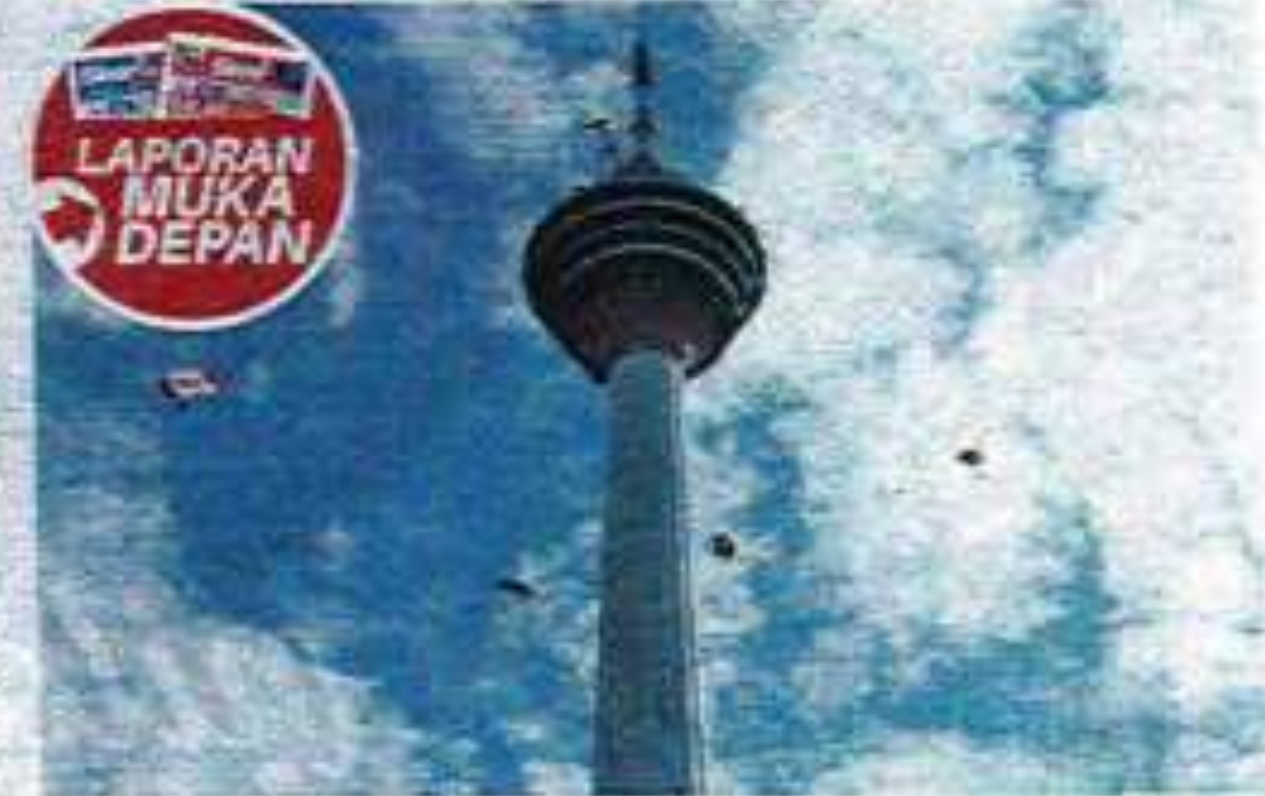
Isu pengambilalihan Menara KL tular di media sosial susulan keputusan TM memindah pemilikan kepada syarikat lain.

Sebelum itu, isu pengambilalihan pengurusan Menara KL, tular di media sosial apabila orang ramai mempersoalkan keputusan Telekom Malaysia (TM) melalui anak syarikatnya, Menara Kuala Lumpur Sdn Bhd