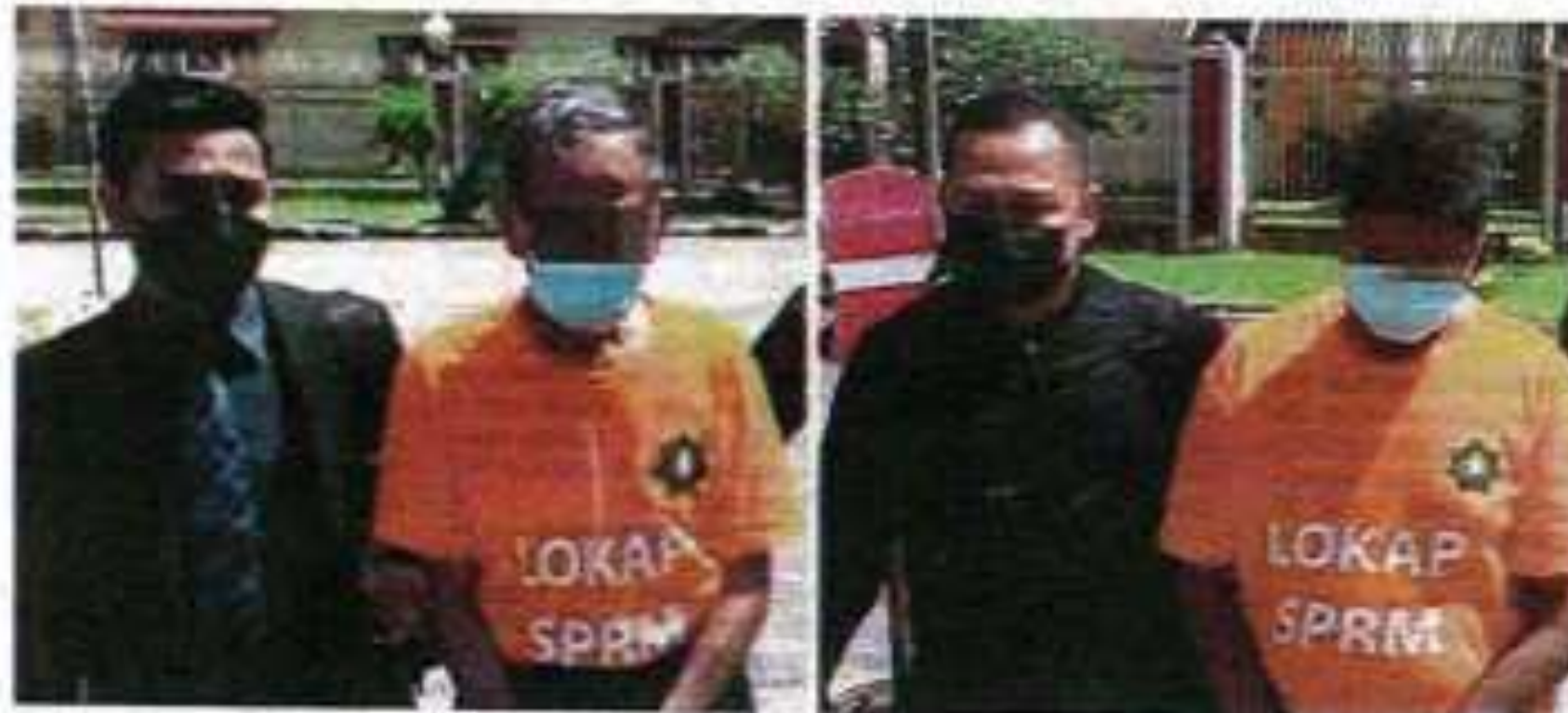
YDP pertubuhan kebajikan dan pengarah urusan syarikat usaha sama ditahan SPRM ketika hujung memberi keterangan.