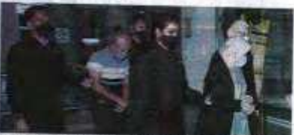
Seorang lelaki (dua orang) dan isterinya (dua orang) didakwa subahat dan salah guna kedudukan di Mahkamah Sesyen di sini pada Rabu.

Pasang dan isteri, pasangan suami isteri, didakwa subahat dan salah guna kedudukan di Mahkamah Sesyen di sini pada Rabu atas dua pertuduhan rasuah berjumlah RM100,000.00.