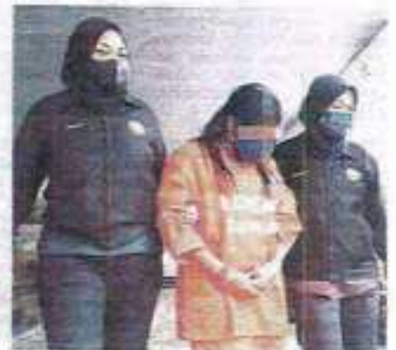
Dua individu dibawa ke Mahkamah Majistret Jenayah di Georgetown, semalam.