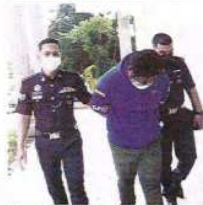
MALIAN dibawa ke Mahkamah Majistret, Pasar Mas, semalam.