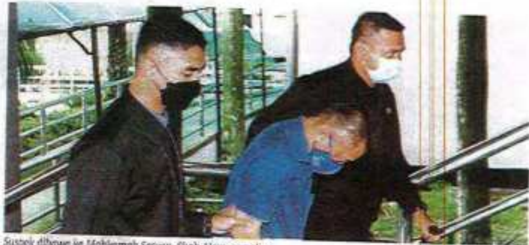
Suspek dibawa ke Mahkamah Sesyen, Shah Alam, semalam.

Sabit kesalahan tertuduh boleh dipenjarakan selama tempoh yang boleh sampai dua tahun atau dengan denda, atau kedua-duanya.