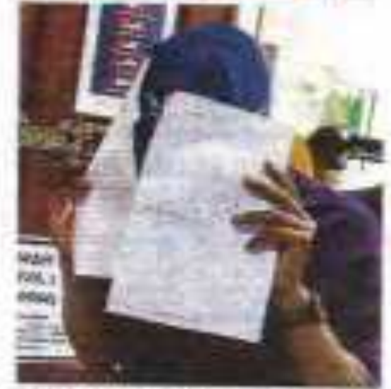
Small text caption at the bottom of the photograph, likely identifying the person or the context of the image.

Sarjan menyatakan tidak mengaku terhadap tiga tuduhan rasuah yang dituduhkan kepadanya. Sarjan, 48, yang berketurunan Cina, mengaku tidak bertanggung jawab terhadap tiga tuduhan rasuah yang dituduhkan kepadanya.