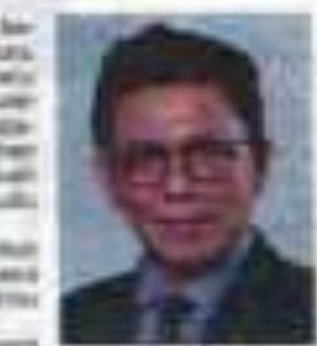
Keputusan rasuah bermula daripada diri sendiri adalah permulaan yang paling besar untuk menolak gejala rasuah bermula daripada diri sendiri.