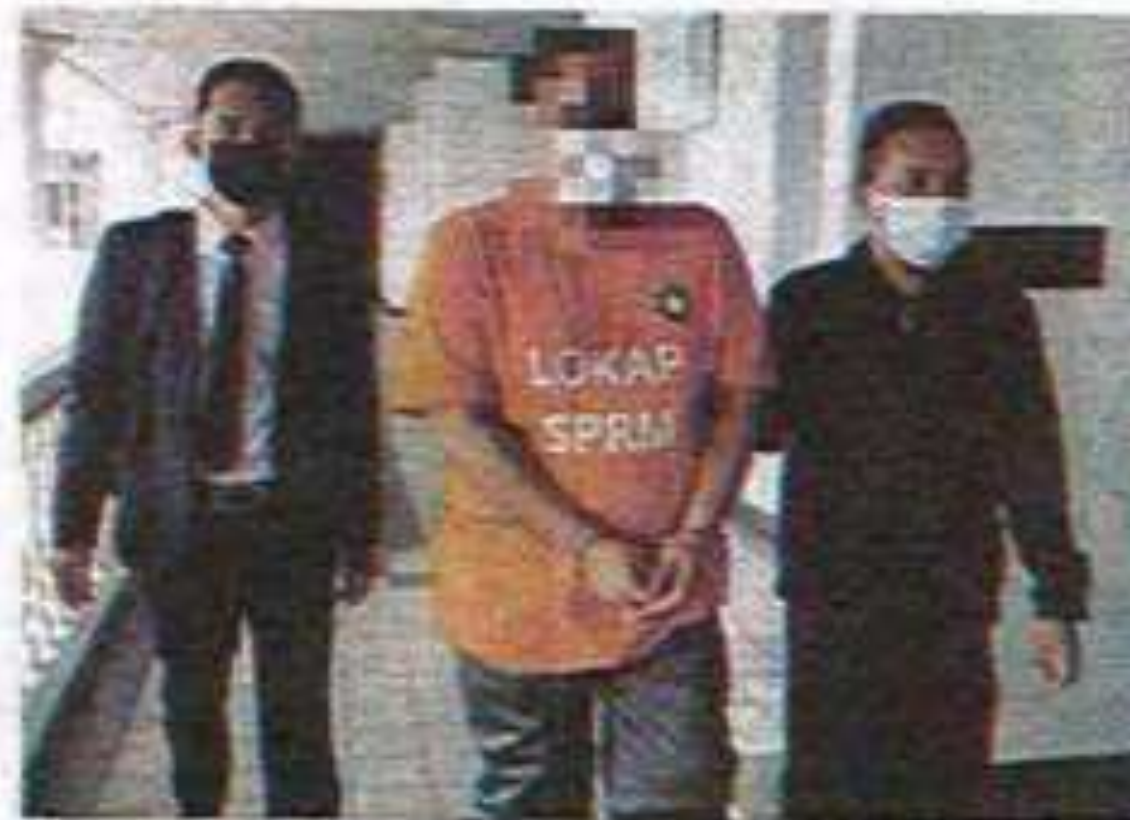
SUSPEK tiba di Kompleks Mahkamah Melaka dengan diiringi pegawai SPRM.

Perintah itu diberikan bagi membolehkan siasa-