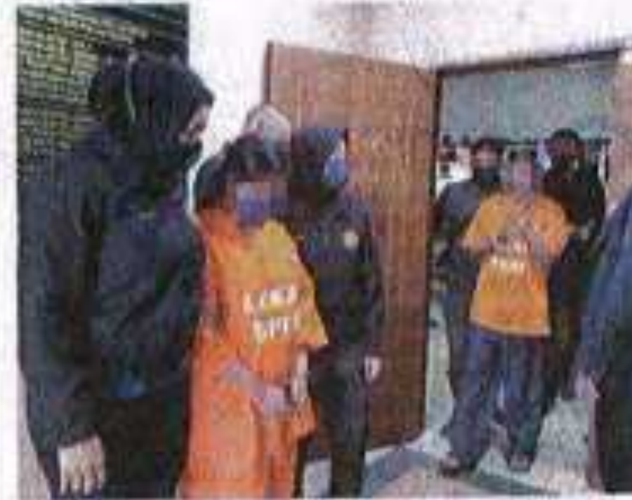
Dua suspek direman empat hari bagi membantu siasatan berhubung kes tuntutan palsu berjumlah RM41,442.

Suspek lelaki berusia 56 tahun dan suspek wanita berusia 29 tahun itu ditahan bagi membantu siasatan berhubung kes mengemukakan tuntutan palsu bernilai lebih