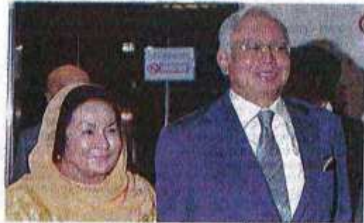
Kes Najib dan Rosmah membuktikan undang-undang negara dilaksanakan dengan sama rata dan kebebasan kehakiman telah dibuktikan wujud di Malaysia.

Pada 23 Ogos lalu, Najib yang juga bekas Perdana Menteri dijatuhi hukuman penjara selama 12 tahun dan denda RM210 juta selepas didapati bersalah menyalahgunakan dana SRC International