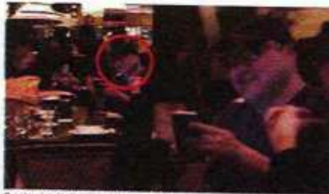
Gambar lelaki dipercayai Jho Low dalam platform aplikasi video YouTube.

Menerusi episod pertama program DK Minda Jho Low yang disiarkan di platform aplikasi video YouTube, semalam, Hope bersama seorang penulis, Tom Wright, berkongsi seping gambar memaparkan Jho Low bersama