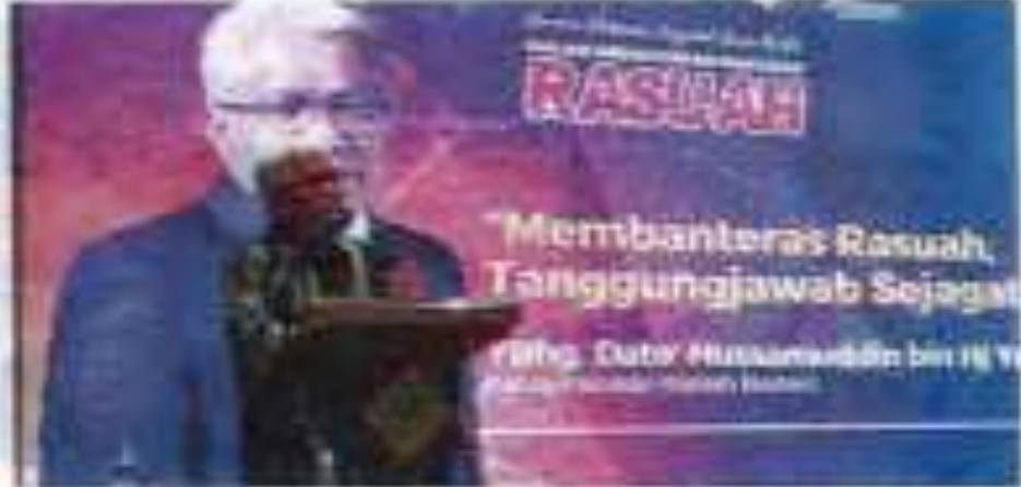
Keputusan rasuah bermula daripada diri sendiri adalah permulaan yang paling besar untuk menolak gejala rasuah bermula daripada diri sendiri.

Kuasa permulaan rantalan paling besar untuk menamatkan gejala rasuah bermula daripada diri sendiri