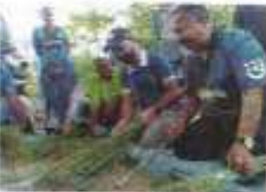
Atletis muda dari Kemari bersempena dengan pertandingan sukan yang dianjurkan oleh projek di Kemari Times, Kemari pada Sabtu.

Menteri Besar, Datuk Seri Ismail Sabri Yaakob, menegaskan bahawa pemimpin yang tidak bersih pada PRU15 akan ditolak. Ismail berkata, pemimpin yang tidak bersih akan ditolak oleh rakyat. Beliau berkata, pemimpin yang tidak bersih akan ditolak oleh rakyat. Beliau berkata, pemimpin yang tidak bersih akan ditolak oleh rakyat. Ismail berkata, pemimpin yang tidak bersih akan ditolak oleh rakyat. Beliau berkata, pemimpin yang tidak bersih akan ditolak oleh rakyat. Beliau berkata, pemimpin yang tidak bersih akan ditolak oleh rakyat.