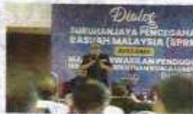
SPRM menjemput penduduk setempat untuk menyuarakan suara mereka terhadap rasuah yang berlaku di negara ini.

perubahan sistem pemerintahan adalah sangat penting bagi negara ini. Beliau berkata, perubahan sistem pemerintahan adalah sangat penting bagi negara ini. Beliau berkata, perubahan sistem pemerintahan adalah sangat penting bagi negara ini. Beliau berkata,