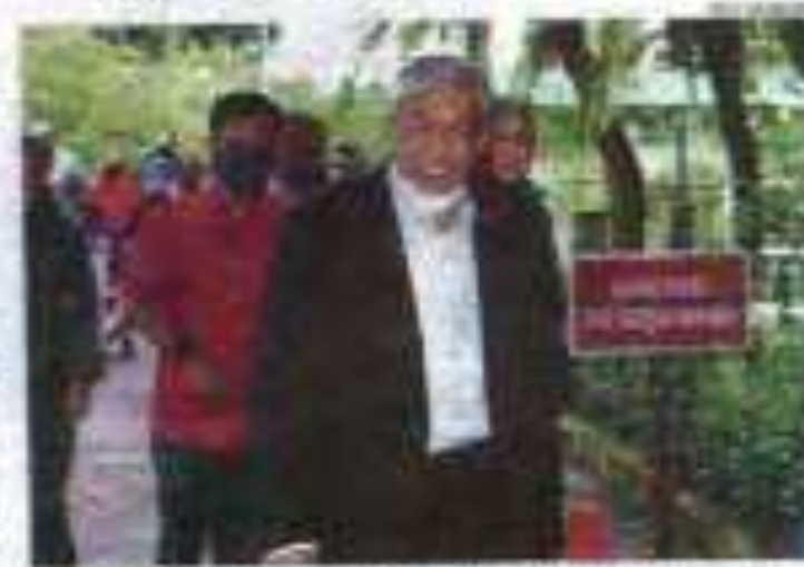
Zahid Zahid Haron di Kompleks Muzium Negara Kuala Lumpur bagi persembahan kepada 100 orang kakitangan MCA pada hujung minggu.

Utusan Melayu hari ini melaporkan bahwa Zahid Zahid Haron mungkin dibebaskan atau diperintah bela diri atas rasuah VLN. Utusan Melayu menyebutkan bahawa Zahid Zahid Haron mungkin dibebaskan atau diperintah bela diri atas rasuah VLN berhubung Al-Jazeera melaporkan ber- hubung Zahid Zahid Haron pada 23 September ini.