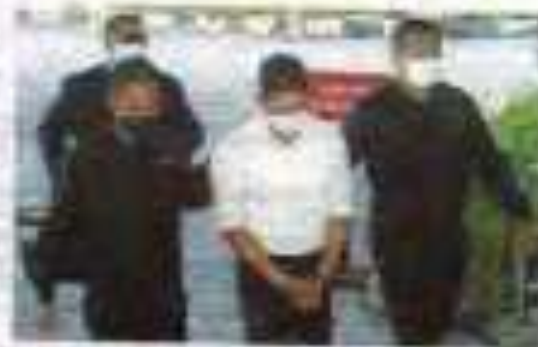
Bekas Ketua Penolong Pegawai Daerah di Pejabat Daerah dan Tanah Kuala Kangsar didakwa menerima suapan.

Keputusan rasuah pejabat tanah didakwa terima suapan. Menteri Dalam Negeri, Datuk Seri Anwar Ibrahim berkata, kes rasuah ini melibatkan pejabat tanah di Ipoh. Anwar berkata, kes rasuah ini melibatkan pejabat tanah di Ipoh.