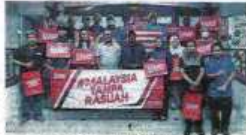
Anggota Rasuah Busters Johor diundang dalam mesyuarat khas mengenai perubahan sistem kerajaan PRU pada Sabtu.

Berita yang juga berhubung perubahan sistem pemerintahan