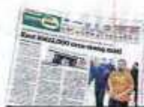
BERITANYA Kosmo! 8 Oktober 2021.

Mengikut pertuduhan, ketiga-tiga mereka semasa kejadian bertugas di Unit Forensik, Hospital