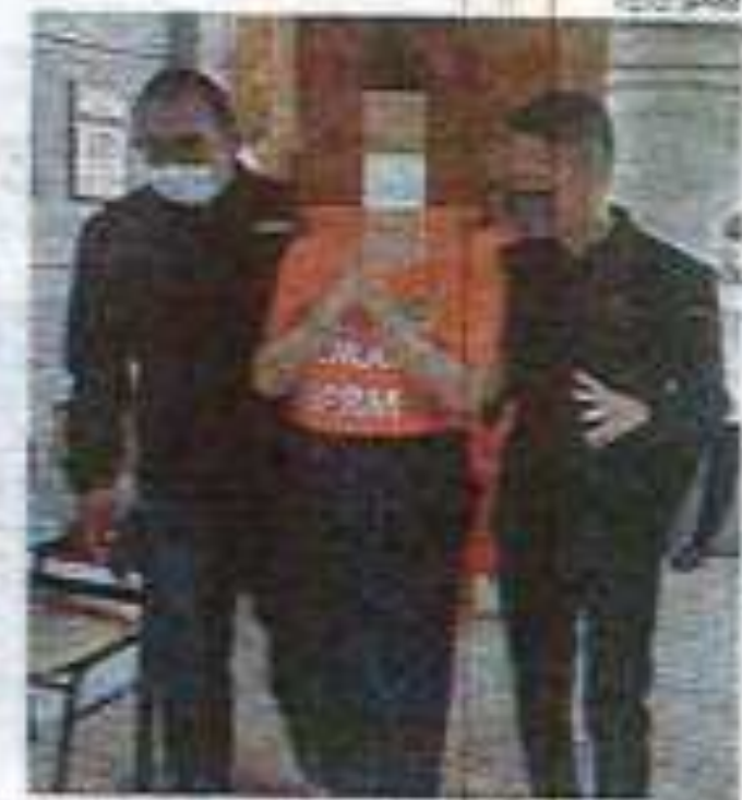
Antara individu yang ditahan SPRM bagi membantu siasatan.

Sementara itu, menurut sumber, bekas CEO lelaki berkenaan ditahan di rumahnya di Ipoh kira-kira jam 4 petang, Jumaat.