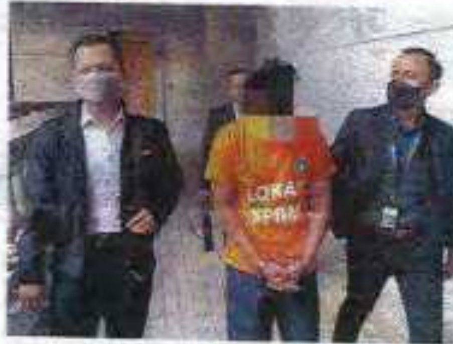
Suspek (tengah) dibawa ke Mahkamah Majlis di Puchong untuk pemanggilan semula pada Rabu.

S uporterJaya: Perancangan Rasuah Malaysia (SPRM) pada Selasa menahan seorang pegawai khas kepada seorang ketua jabatan sebuah agensi kerajaan.