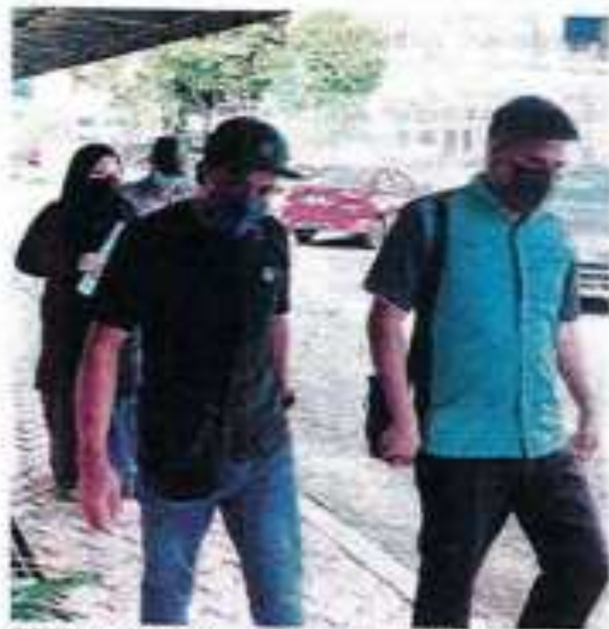
EMPAT tertuduh menyerahkannya hukuman Mahkamah.