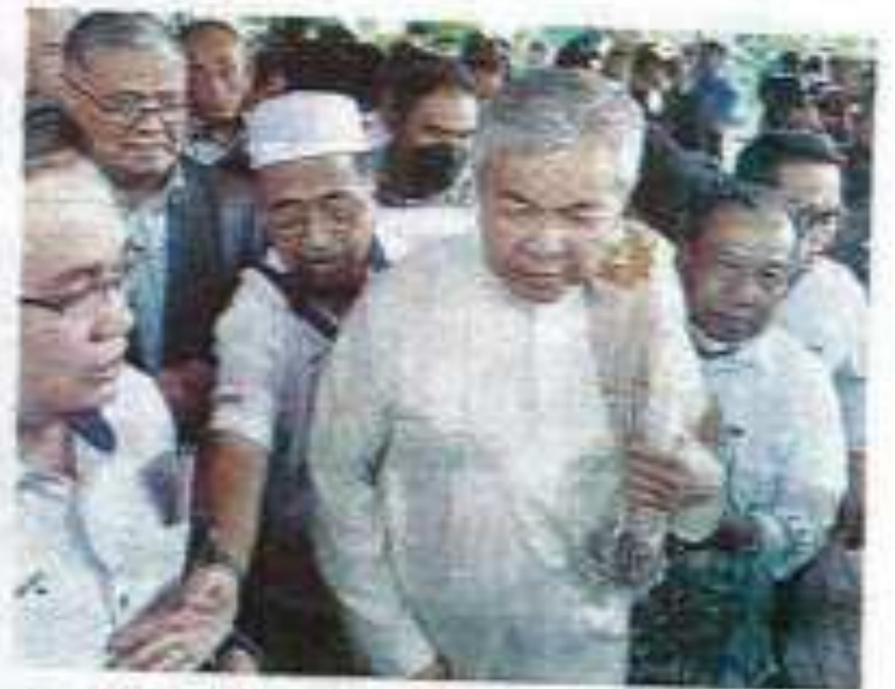
Ahmad Zahid dilepas dan dibebaskan oleh Mahkamah Tinggi Shah Alam pada Jumaat atas 40 pertuduhan rasuah berhubung Sistem VLN.

Malah beliau berkata, pendakwaan tidak memanggai pemandu kepada tiga saksi utama itu, pengawal di kediaman