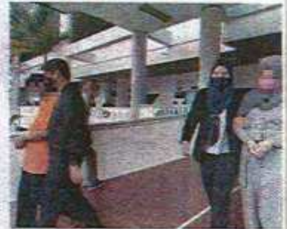
Antara individu yang direman di Melaka berhubung kes tuntutan palsu.

Katanya, kesemua suspek direman antara tiga ke tujuh hari di Mahkamah Majistret di negeri masing-masing.