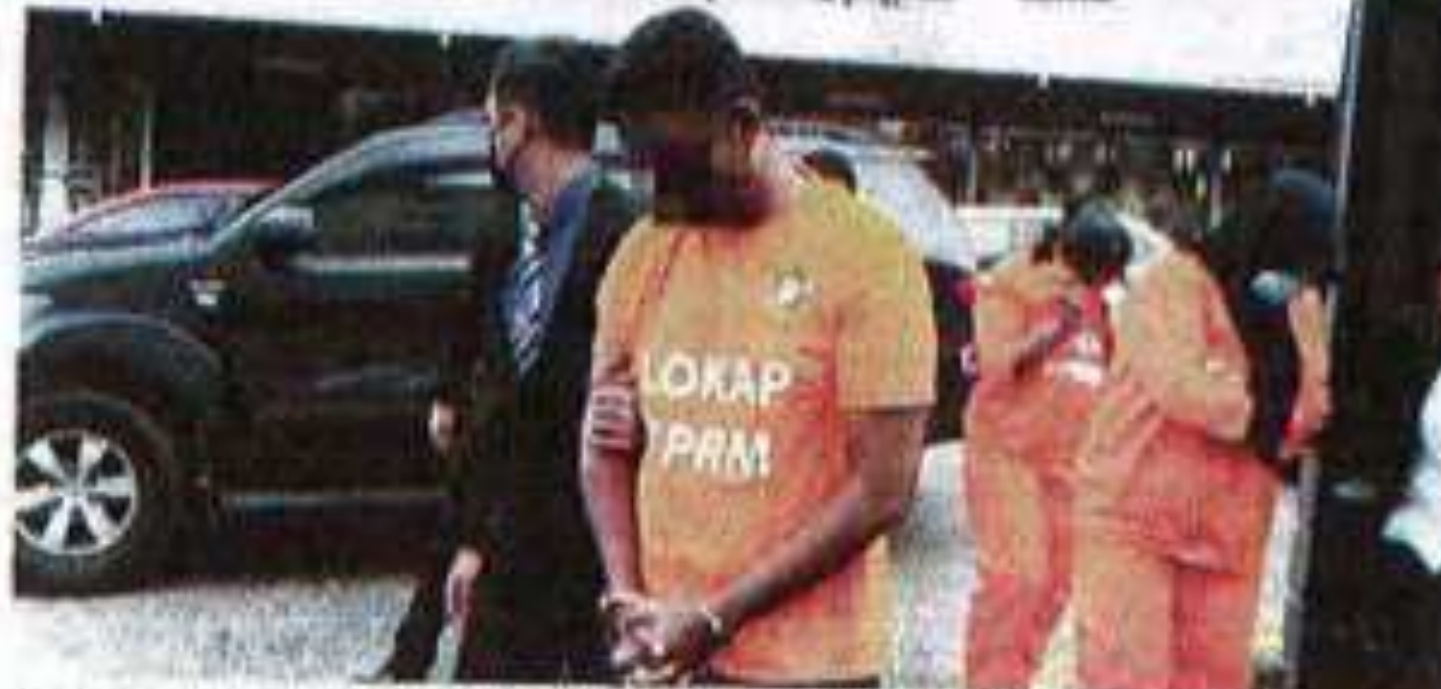
DUA pegawai polis dan seorang anggota ditahan reman tiga hari bagi membantu siasatan satu kes meminta rasuah berjumlah RM180,000, hulan lalu.

Selari sebelum itu, pengadu mendakwa dia ada menyerahkan RM20,000 kepada seorang anggota polis wanita untuk tujuan yang sama.