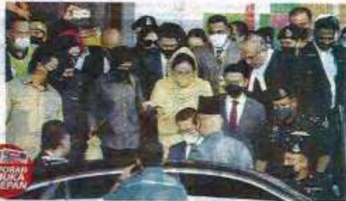
Rosmah Mansor dan Mahkamah Tinggi Kuala Lumpur setelah hakim membenahi hukuman. Rosmah ke atas kes rasuah yang ditentanginya.