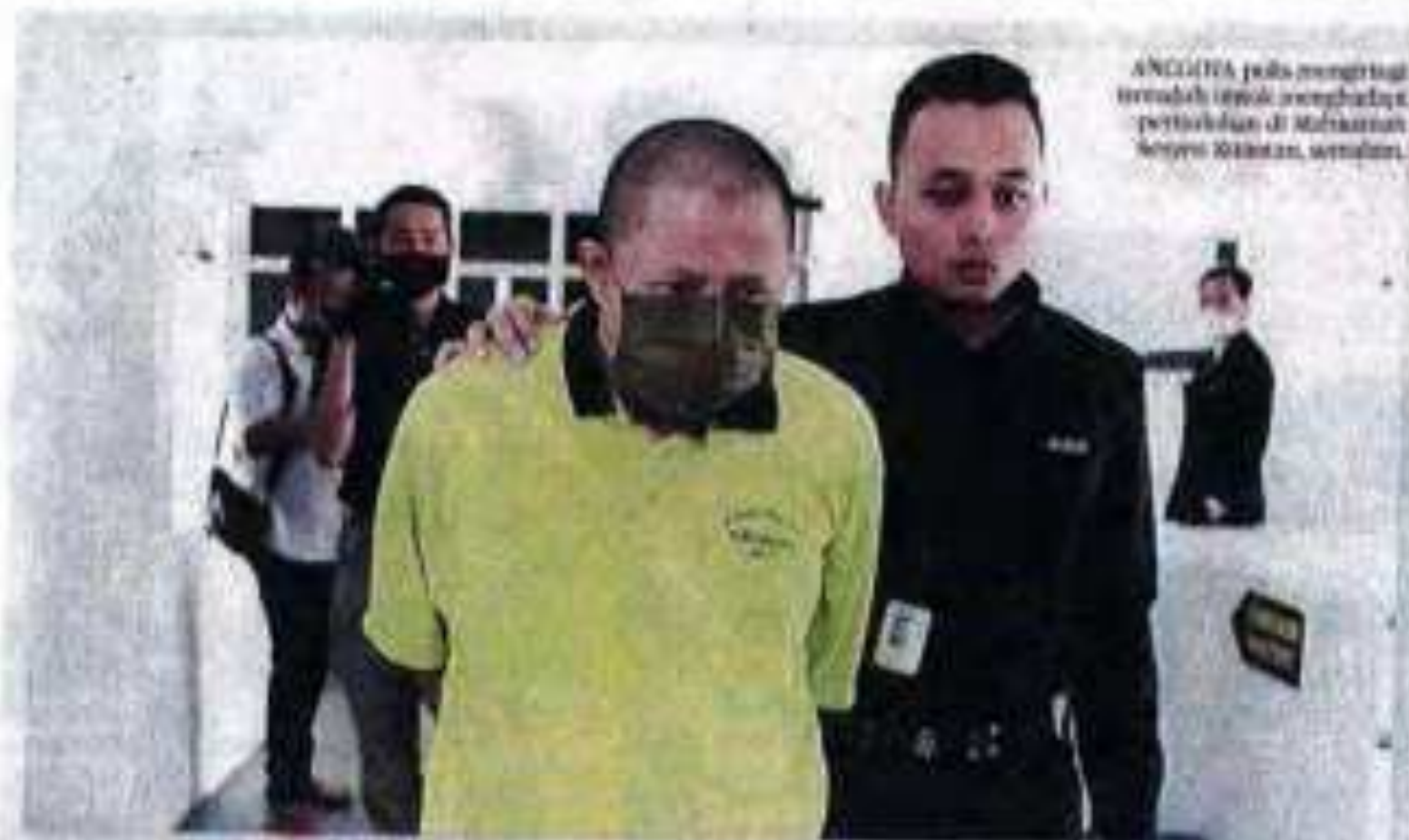
ANGGITA pula mengkritik terhadap imbuhan penghadapan pertuduhan di Mahkamah Sesyen Klang, semalam.