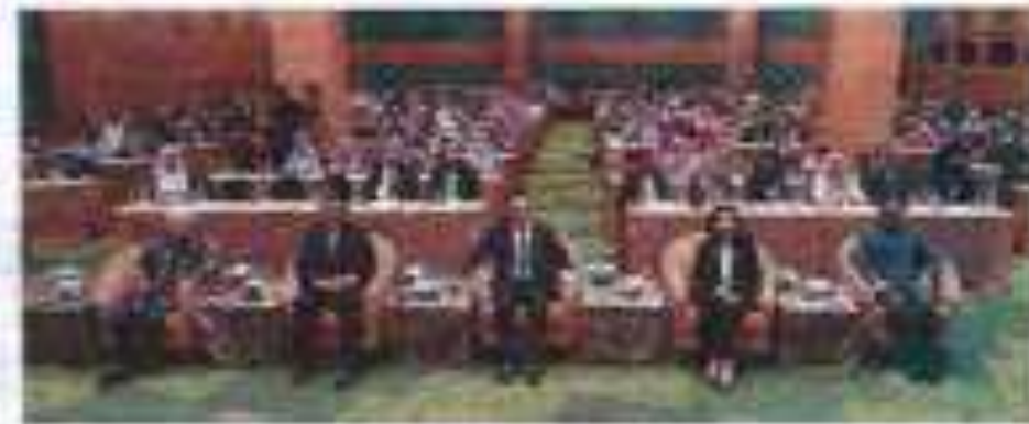
Keputusan rasuah bermula daripada diri sendiri adalah permulaan yang paling besar untuk menolak gejala rasuah bermula daripada diri sendiri.