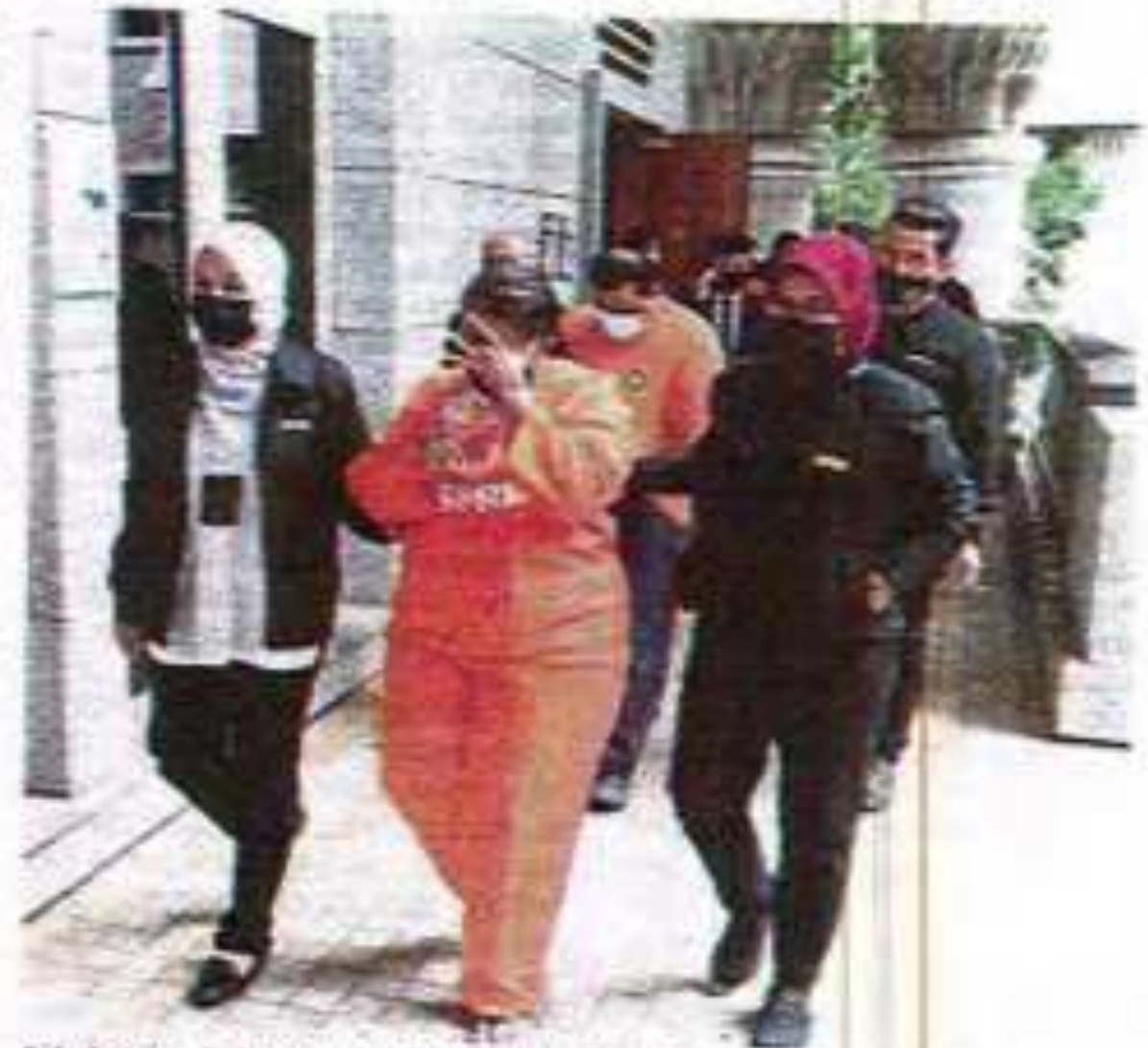
Sebahagian individu yang ditahan SPRM bagi membantu siasatan bertubuh isu tuntutan palsu dan penyelewengan dana PenjanaKerjaya di Putrajaya, semalam.

"Mereka disyaki mengemukakan dokumen tuntutan yang mengandungi butiran palsu secara dalam talian kepada PERKESO bagi menuntut begaran insentif pengambilan pekerja dan latihan