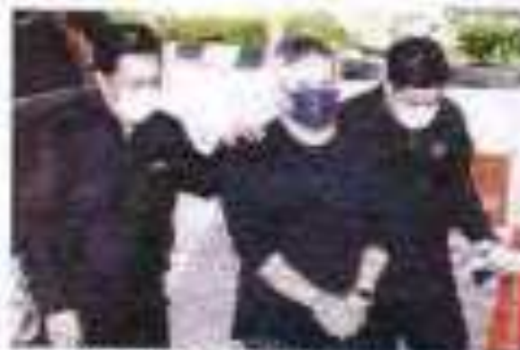
Maklumi bahawa pegawai kanan SSDU dituduh lantik terus syarikat milik ahli keluarga.

SHAH ALAM - Seorang pegawai kanan SSDU dituduh lantik terus syarikat milik ahli keluarga.