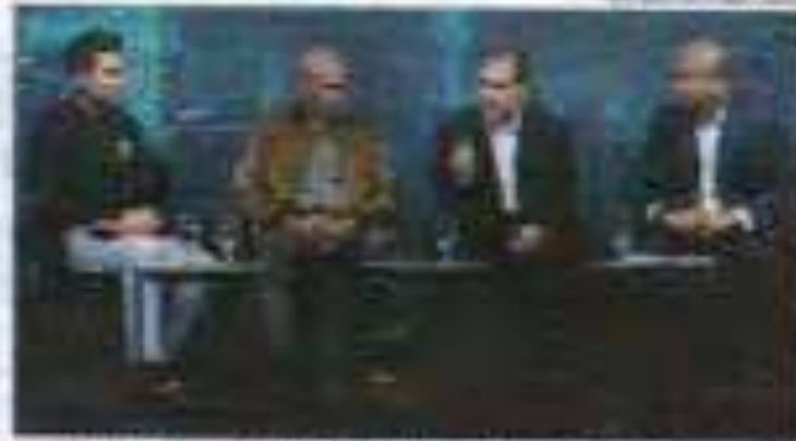
Tan Sri Mohd Noor Hassanali, Menteri Dalam Negeri dan Ketua Polis Negara, bersama pegawai-pegawai polis dan pegawai-pegawai Suruhanjaya Pencegahan Rasuah Malaysia (SPAM) 2009.

"Kalau pegawai polis menerima rasuah, itu bermaksud ada rasuah dalam organisasi polis," kata Ketua Polis Negara, Tan Sri Mohd Noor Hassanali. "Jika ada rasuah dalam organisasi polis, itu bermaksud ada rasuah dalam organisasi polis," kata Ketua Polis Negara, Tan Sri Mohd Noor Hassanali.