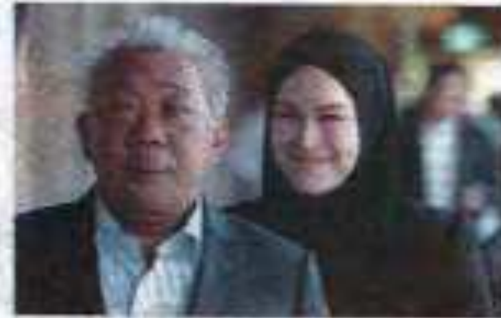
Bung Moktar dan isteri, Zizie Izame.

Keputusan kes rasuah bekas Menteri Besar Selangor Bung Moktar Sabar dan isteri, Datuk Seri Zizie Izame akan dibuat Mahkamah Sesiyen di sini hari ini. Mahkamah Sesiyen di sini akan membuat keputusan terhadap Bung Moktar Sabar dan isteri, Datuk Seri Zizie Izame. Mahkamah Sesiyen di sini akan membuat keputusan terhadap Bung Moktar Sabar dan isteri, Datuk Seri Zizie Izame.