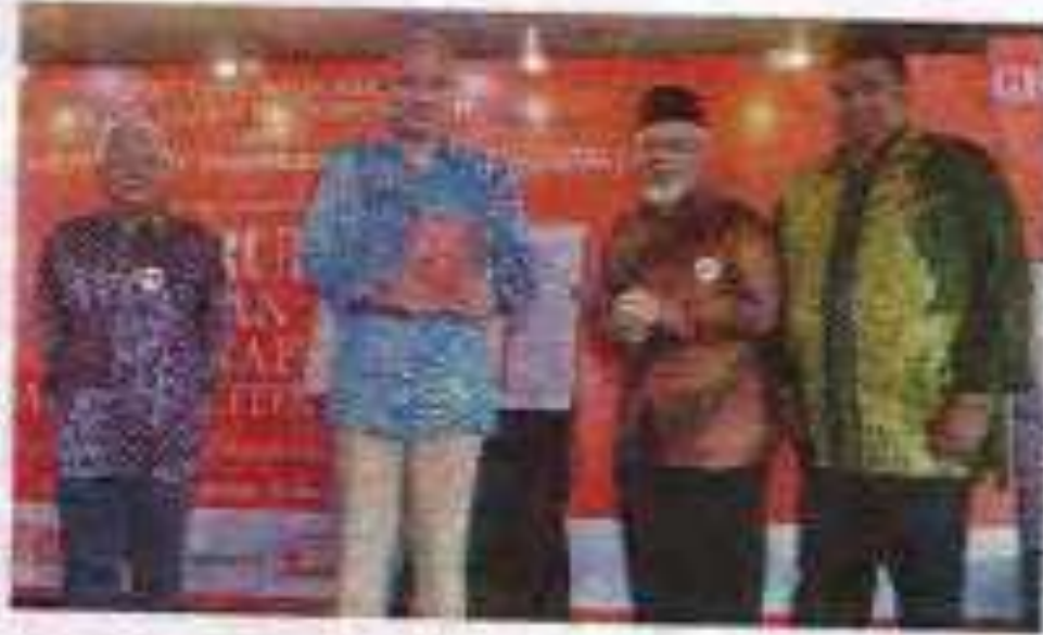
Sultan Nazrin (dua dari kiri) menyampaikan perutusan tahunannya dalam Dewan Perak, Perak State Assembly, di Kompleks Kerajaan, Shah Alam pada Khamis. Turut hadir, Menteri Besar Perak, Datuk Seri Ahmad Faizal Yusoff (dua dari kanan) dan Raja Azlan.

"Sebagai pemimpin, saya akan berusaha untuk membantaras rasuah."