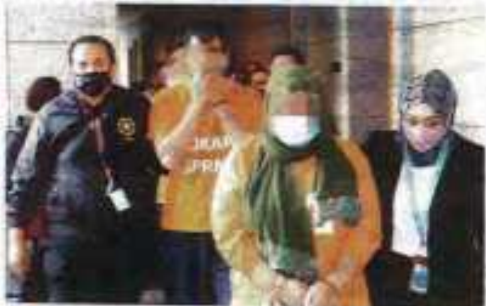
Limas lima individu ditahan untuk membantu siasatan berkaitan tuntutan lebih RM27 juta. Mereka ditahan pada 18 Ogos 2022 bagi menghadapi siasatan.