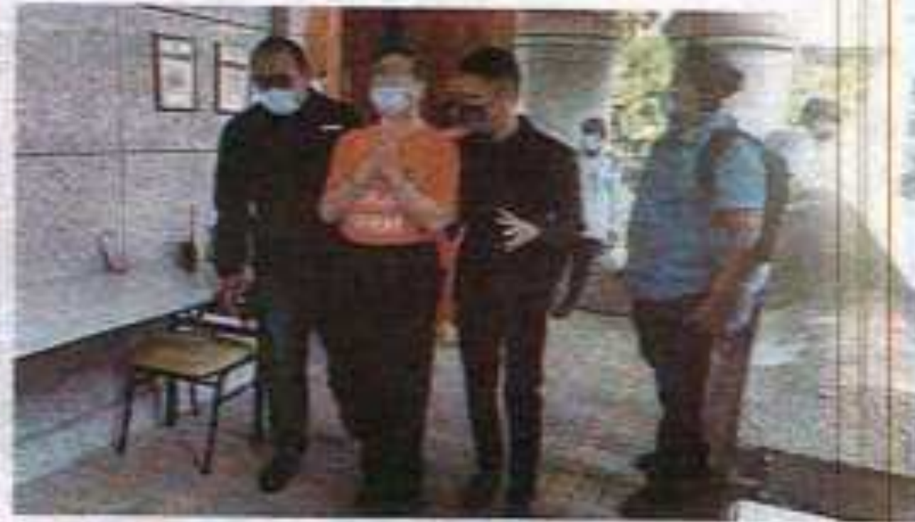
SUSPEK berpakaian Datuk (Pena) ke Mahkamah Majistret Putrajaya untuk permohonan reman.

Dalam pada itu, sumber sama berkata, setakat ini pasukan siasatan dikatakan berjaya mendapatkan kembali hampir keseluruhan wang berjumlah RM24 juta hasil sitaan wang serta aset