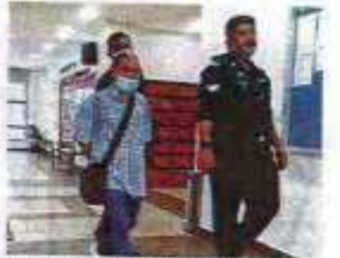
Tertuduh (tengah) didakwa di Mahkamah Syariah di sini terhadap empat pertuduhan mengenai wang deposit berjumlah keseluruhan RM45,000 pada Ogos lalu.

Tertuduh juga dikenakan syarat tambahan untuk memulakan diri di bilik polis terdekat sebaik sahaja sehingga hari Selasa.