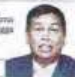
38 syarikat lalai ditahan tender projek MBSA