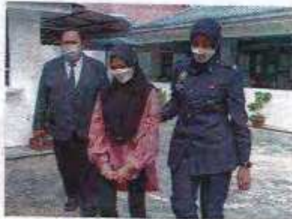
Tertuduh (tengah) didakwa di Mahkamah Syariah SK saat 22 pertuduhan berkaitan wang deposit berjumlah RM876,375 tanpa lesen sah.

Jika siasat kesalahan boleh didenda atau penjara RM500 atau penjara tidak lebih 18 bulan atau