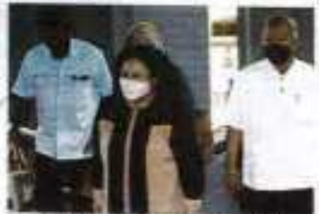
Rayuan Rosmah ditetapkan 5 Oktober ini. Kes projek solar hibrid. Rayuan Rosmah ditetapkan 5 Oktober ini.