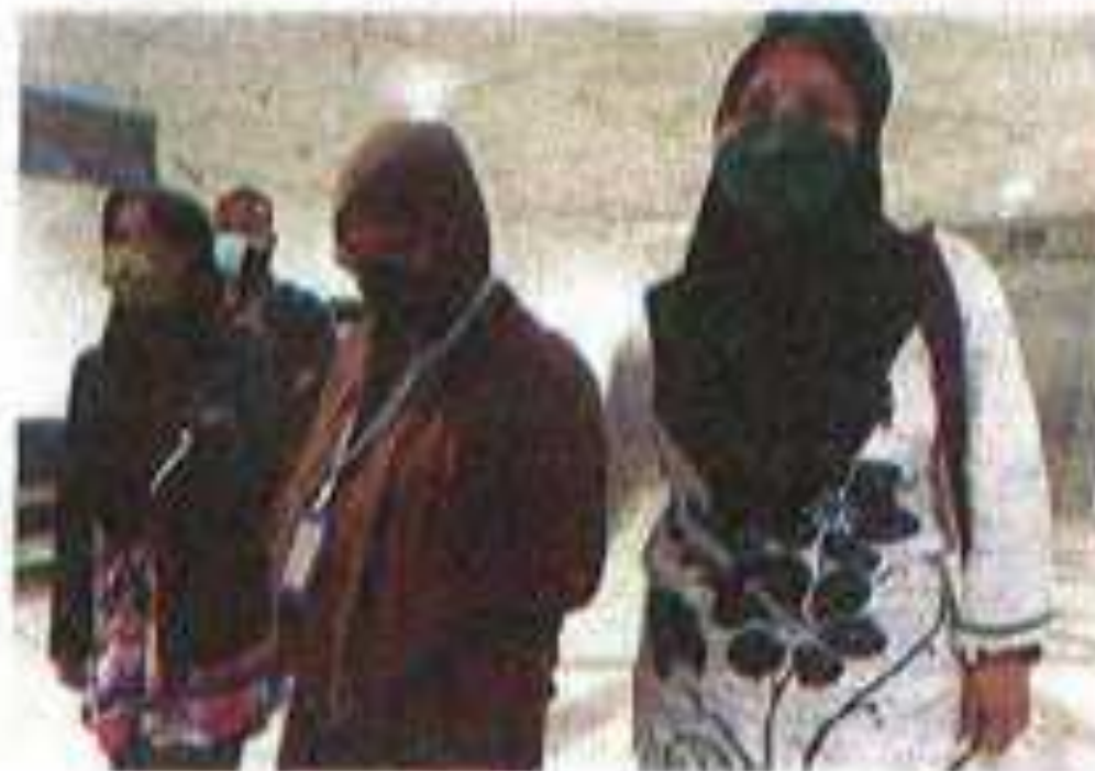
Tertuduh (dua dari kanan) dihadapkan ke Mahkamah Sesyen Kuala Terengganu pada Isnin atas dakwaan memalsukan borang pendaftaran pekerja di bawah Program Insentif Pengambilan Pekerja (PerjanaKerjaya) dua tahun lalu.

Tarikh sebutan semula kes ditetapkan pada 18 Oktober ini.