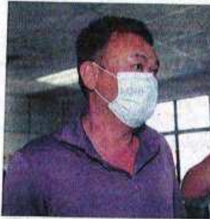
MAHKAMAH membenarkan tertuduh diikat jamin RM5K.

didakwa melakukan kesalahan yang boleh dihukum mengikut Seksyen 417 Kanun Keselamatan.