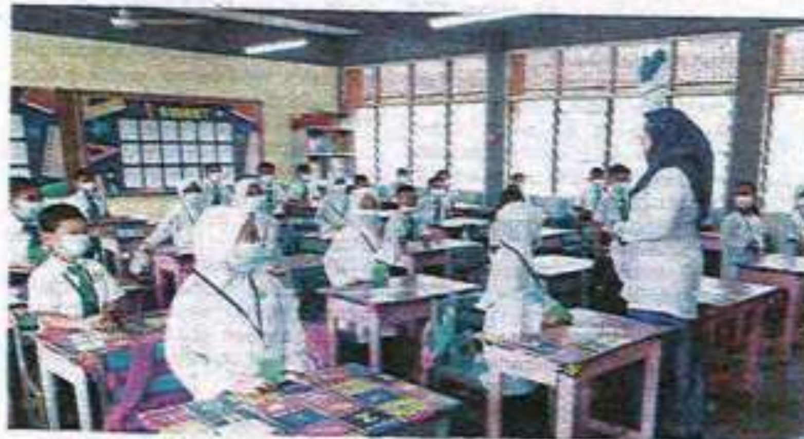
Pendidikan mengenai keburukan dan ancaman rasuah perlu diterapkan lebih awal di sekolah. - Gambar hiasan

Pada program sama, Irii Putri turut berkongsi kisah beliau yang mempunyai anak istimewa yang secara tidak langsung membuka minda masyarakat dalam memahami kehendak dan karakter sebenar anak istimewa tersebut.