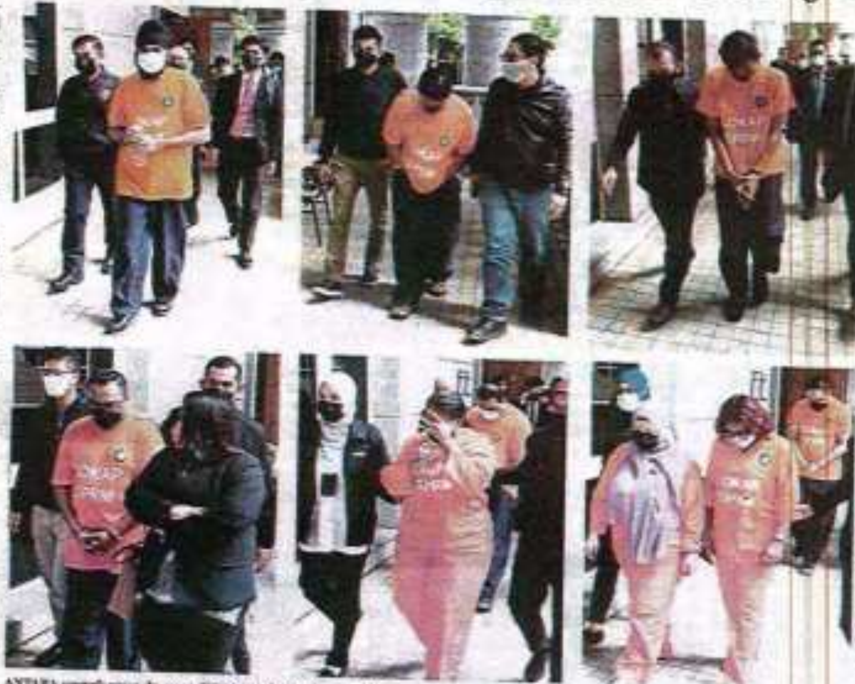
ANTARA suspek yang direman SPRM untuk membantu siasatan.

Di Selangor pula, permohonan reman selama tiga hari dibenarkan terhadap lima individu sehingga