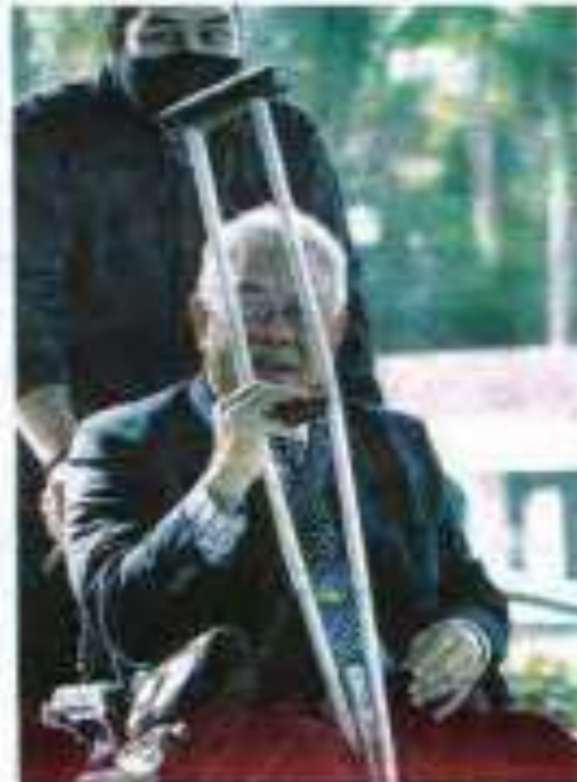
Sabudin Mohd. Sabih hadir di Mahkamah Kuala Lumpur semalam bagi mendengar keputusan dan cuba dia bebas rasuah yang dituduh.

Beliau, bekas Menteri Kanan Keselamatan, telah berdebat dengan检控官 (prosecutor) dalam sidang dengar pendapat di Mahkamah Tinggi Kuala Lumpur (MLT) pada 14 September 2022.