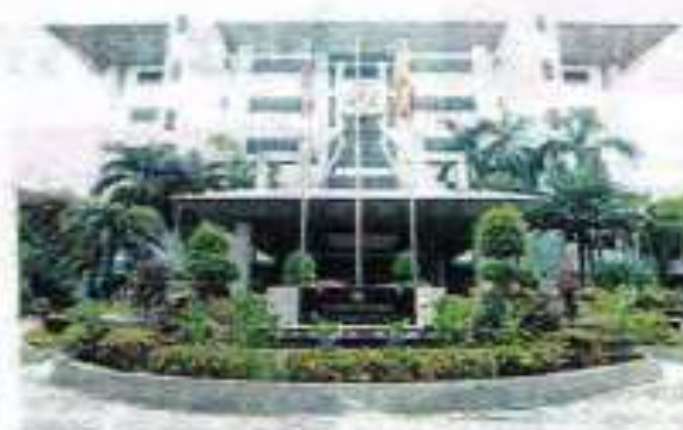
DI MAHKAMAH Shah Alam ialah tiga staf hospital dijatuh hukuman jel.