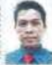
38 syarikat lalai ditahan tender projek MBSA