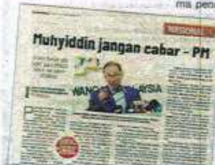
Laporan Star Harian pada Rabu.