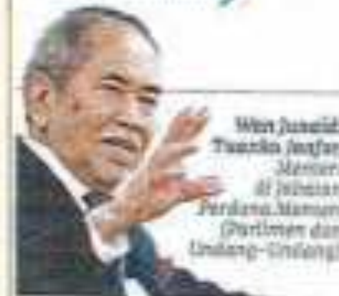
Wan Junaidi Tuanku Jaafar, Menteri di Jabatan Perdana Menteri (Parlimen dan Undang-Undang)

Siasatan akan menentukan sama ada pemberian atau penerimaan wang adalah berunsur rasuah ataupun tidak