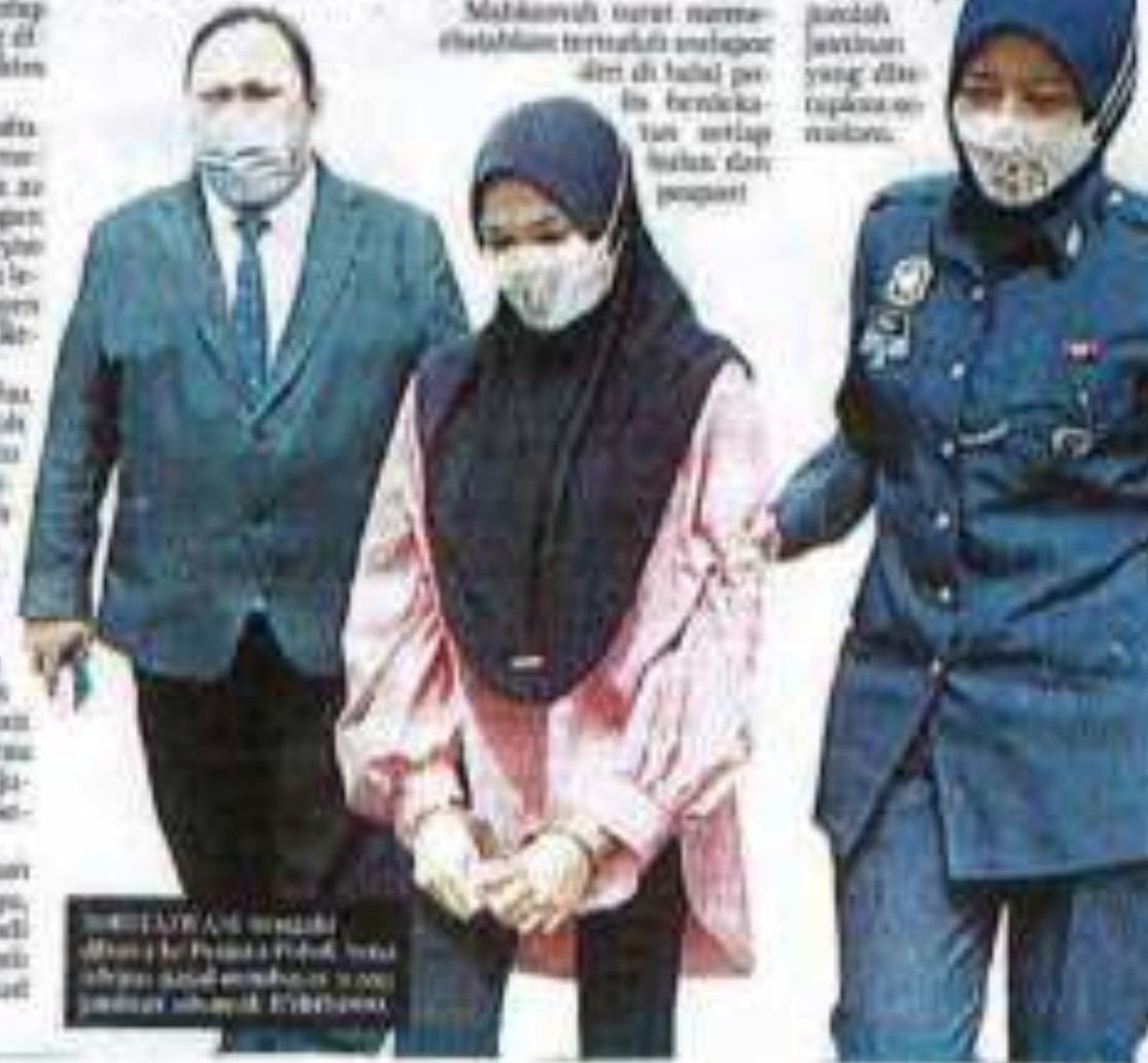
BERDAPATKAN maklumat mengenai kes ini, hubungi pihak berkuasa atau hubungi 03-2060-2000.

Terdakwa yang dijemput sebagai saksi, berkata pertuduhan ini merupakan langkah pertama untuk memastikan pertuduhan ini dapat diselesaikan dengan cepat.