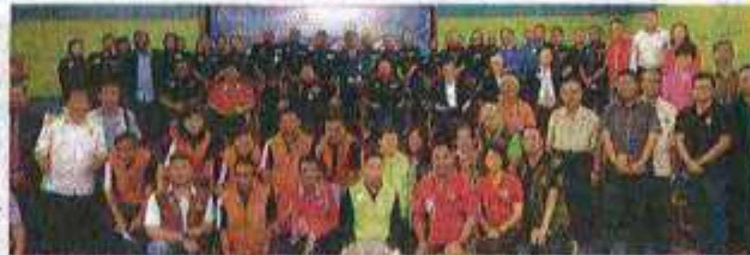
Pada peserta Program Dialog Basmil Rasuah Hapus Jenayah Tanggungjawab Bersama di Pantai Cahaya Bulan, Kota Bharu pada Isnin.

"Dari segi kaedah pelaksanaan penugasan, pelbagai cara boleh digunakan termasuk penyamaran dan onbagainya.