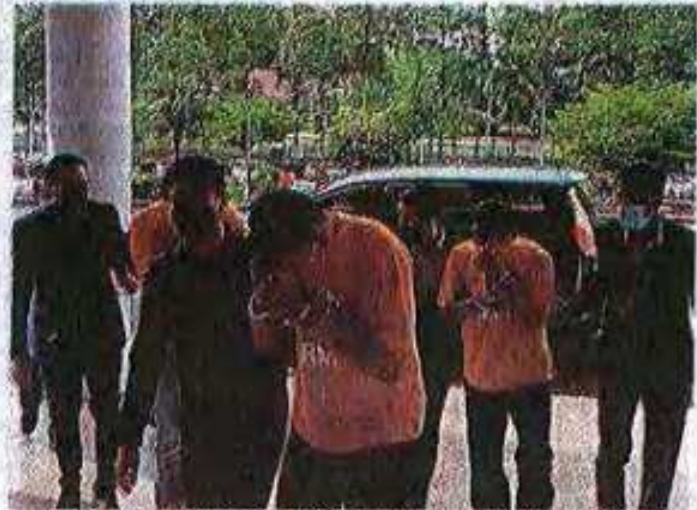
Empat suspek alirang pegawai SPRM dibawa ke Kompleks Mahkamah Ayer Keroh, semalam.

orang suruhan tahanan antara RM600 hingga RM9,000 melalui kira-kira 20 transaksi dalam tempoh setahun bermula 2019 hingga 2020.