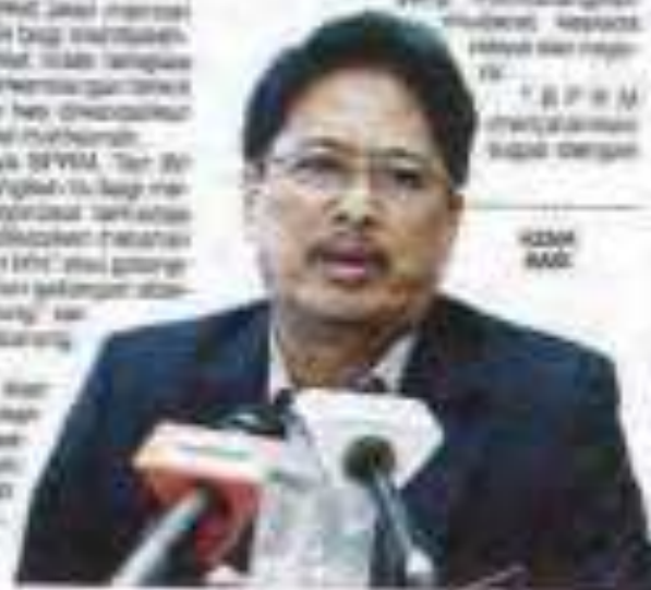
TAN SRI AZAM BAKI

"Kita akan mengadakan siri seminar dan bengkel untuk meningkatkan kesedaran masyarakat tentang rasuah. Kita akan mengadakan siri seminar dan bengkel untuk meningkatkan kesedaran masyarakat tentang rasuah."