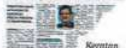
Keratan akhbar BH, Rabu lalu.

Kontraktor warga Malaysia lari daripada tahanan rumah