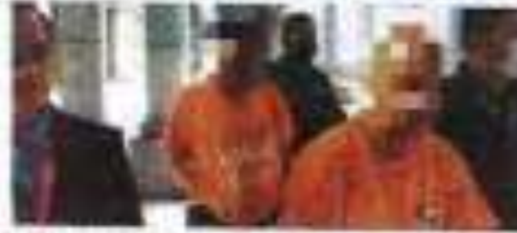
Dua beradik ditahan tiga hari bagi membantu siasatan berkaitan RM23 juta pembayaran palsu. Mereka ditahan pada 18 Ogos 2022 bagi menghadapi siasatan.

PUTRAJAYA - Dua beradik di bawah tahanan tiga hari berkaitan Pembayaran Palsu, Malaysia (PPM), bagi membantu siasatan berkaitan RM23 juta pembayaran palsu. Mereka ditahan pada 18 Ogos 2022 bagi menghadapi siasatan.