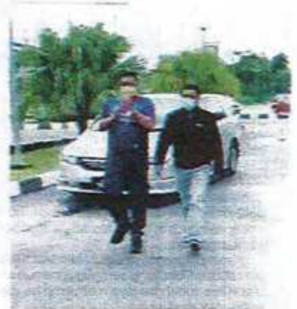
Suspek (kiri) diiringi anggota SPRM bagi mendapatkan perintah reman di Mahkamah Alor Setar pada Ahad.

Menurutnya, siasatan dibuat di bawah Seksyen 17(a) Akta SPRM 2009.