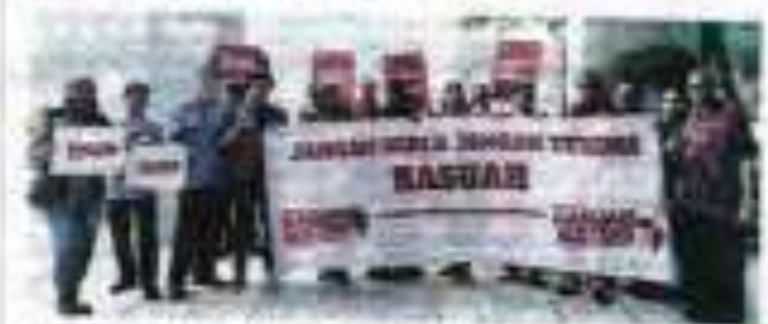
Program ikrar lawan rasuah diadakan di hadapan Istana Kehakiman pada Selasa.

Program ikrar lawan rasuah diadakan di hadapan Istana Kehakiman pada Selasa. Program ikrar lawan rasuah diadakan di hadapan Istana Kehakiman pada Selasa.