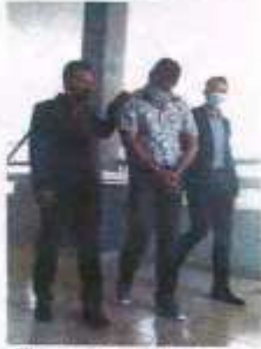
Uji tumpu yang dijalankan di Mahkamah Rendah Seremban melibatkan (dari kiri) pegawai JKR, pemandu lori dan saksi.