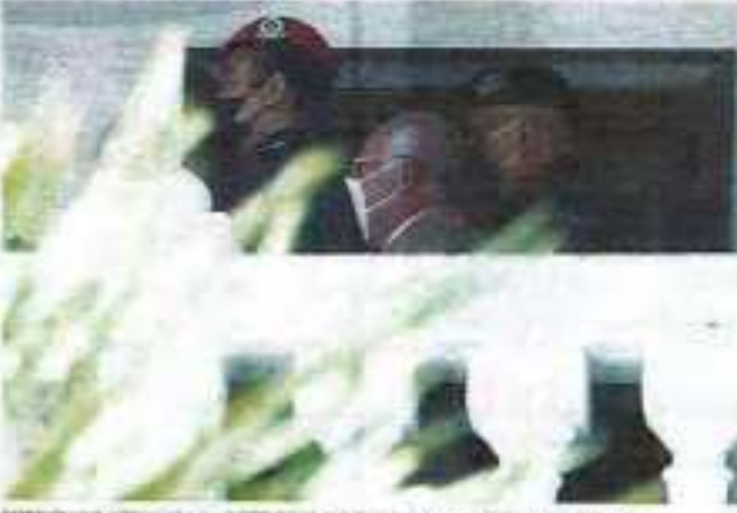
Makan malam berbahan enak disediakan oleh pihak berkuasa tempatan Putrajaya.

Media tempatan Sistem di tingkat pertama dan kedua Kompleks Mahkamah Putrajaya pada Selasa (30) mencatat 383 transaksi cek yang bernilai RM8.4 juta. Jumlah ini menunjukkan peningkatan berbanding dengan 340 transaksi pada bulan Disember 2021. Manfaat Trust di sini menunjukkan peningkatan berbanding dengan 19 transaksi individu dan 152 transaksi korporat. Jumlah ini menunjukkan peningkatan berbanding dengan 180 transaksi pada bulan Disember 2021. Manfaat Trust di sini menunjukkan peningkatan berbanding dengan 19 transaksi individu dan 152 transaksi korporat. Jumlah ini menunjukkan peningkatan berbanding dengan 180 transaksi pada bulan Disember 2021.