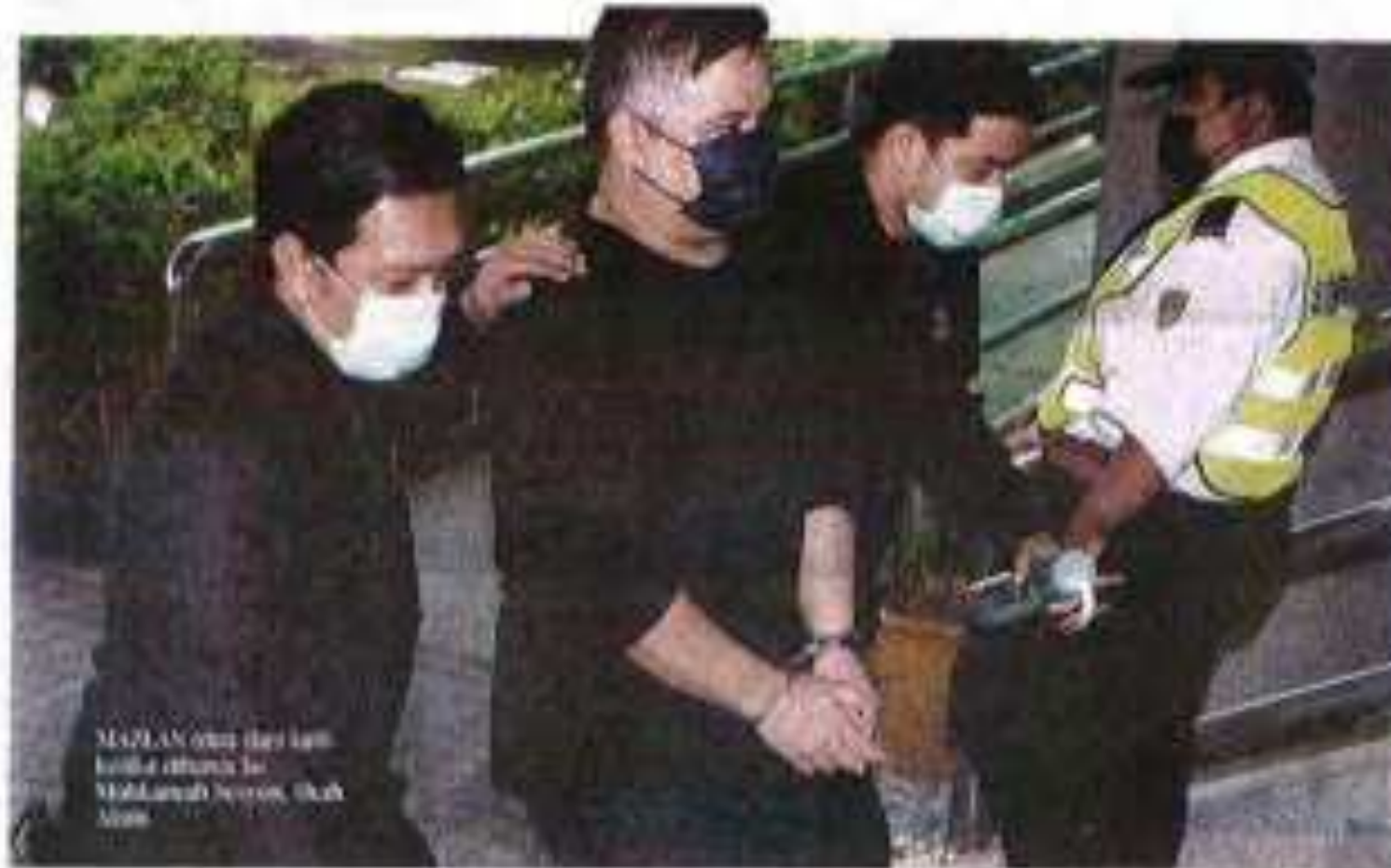
MALAN yang hari ini telah ditahan ke Mahkamah Sesiwan, Shah Alam.

Dhah Nurazrina Che Nuh en@harianmetro.my