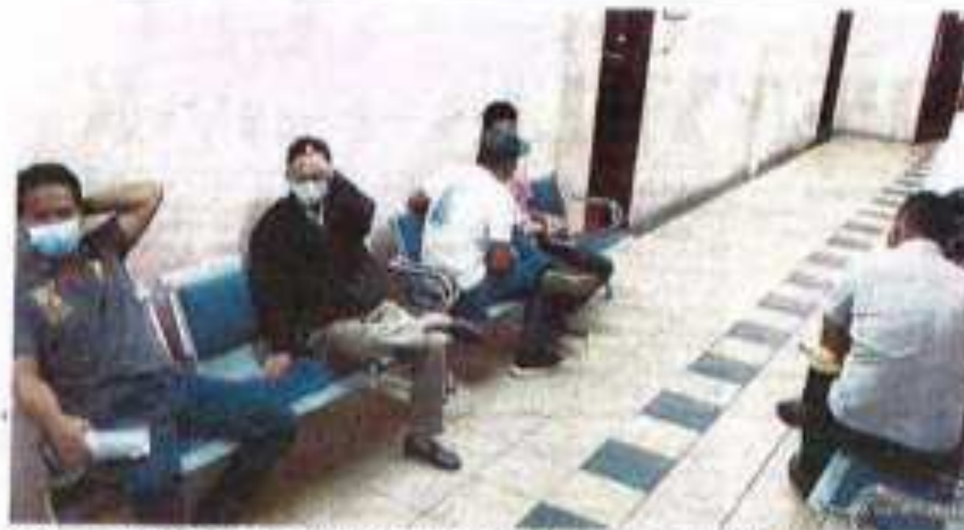
UAM kemudiannya menerima prapembiayaan dari pihak MAMPU di Mahkamah Kebangsaan. Manakala, pihak swasta yang terlibat menerima dan mengumpul maklumat setelah selesai di lapangan.