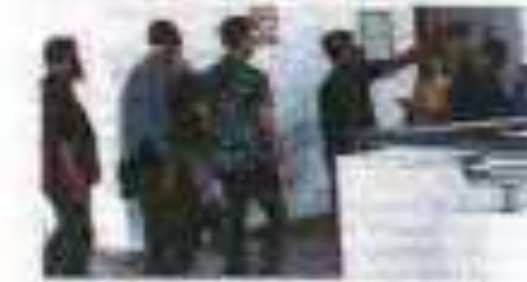
...di Mahkamah Rendah Syariah...