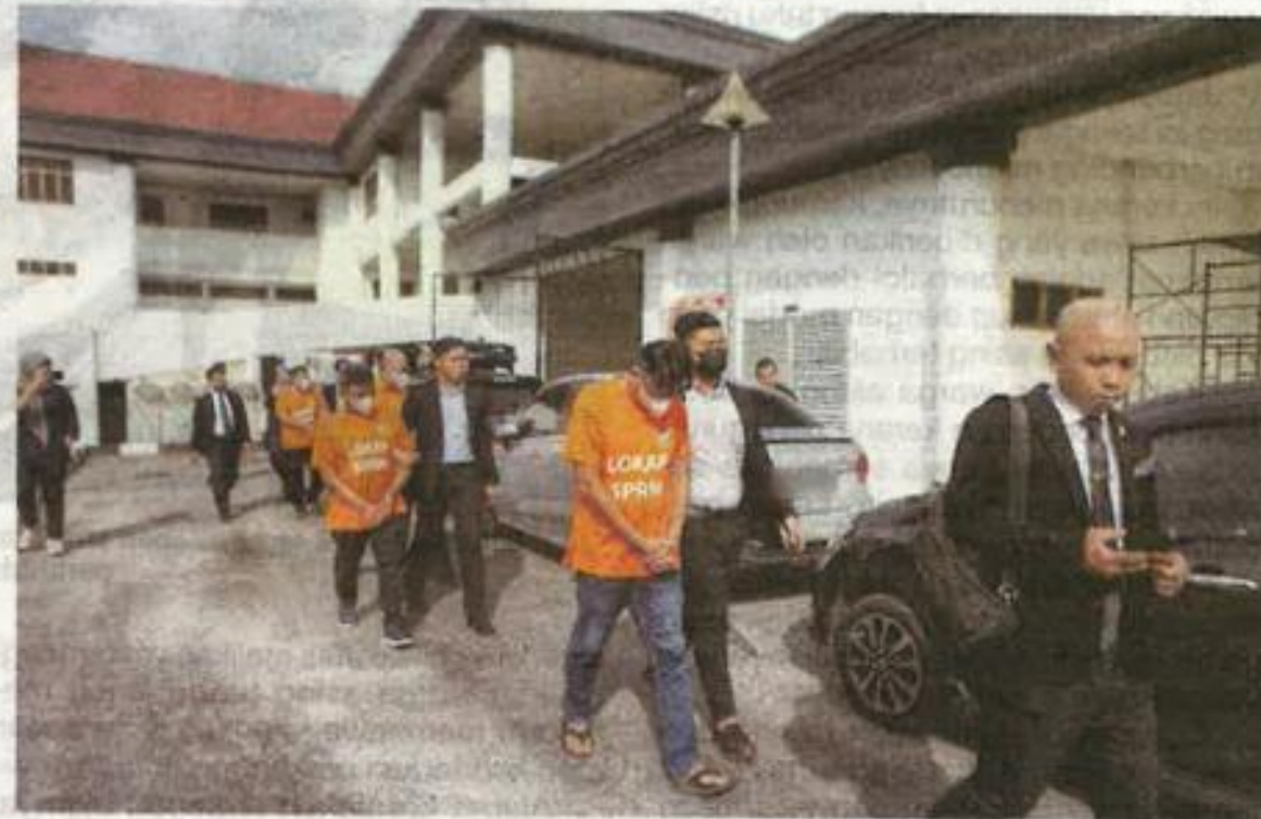
Keempat-empat suspek diiringi pegawai SPRM selepas mendapatkan perintah reman di Mahkamah Majistret Alor Setar pada Jumaat.