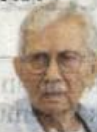
Daim Zainuddin, Bekas Menteri Kewangan

Peguam saya sudah dimaklumkan bahawa saya akan didakwa pada hari Isnin (29 Januari) atas kesalahan di bawah Seksyen 36(2) Akta SPRM 2009