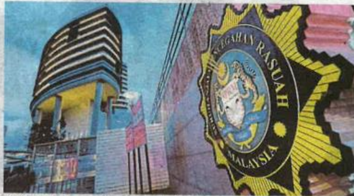
SPRM nafi dakwaan tidak menjalankan siasatan.

Sehubungan itu, SPRM menekankan dakwaan BPR/SPRM tidak menjalankan siasatan ter-