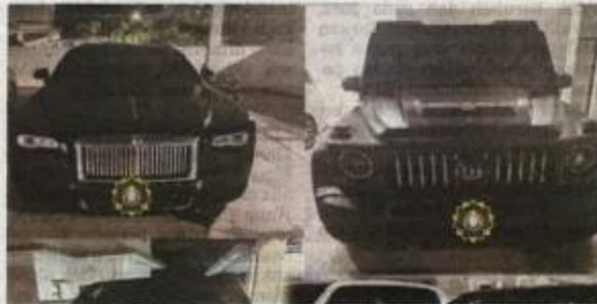
Antara kenderaan mewah dipercayai milik suspek disita SPRM.