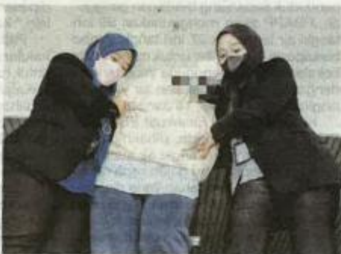
SPRM menahan reman seorang penolong pengurus syarikat kerana disyaki menerima suapan sebanyak RM18,000.

Pengarah SPRM Melaka, Mohd Shahril Che Saad mengesahkan penahanan individu terbabit di bawah Seksyen 16(a)(A) Akta SPRM 2009 yang mana jika sabit kesalahan boleh dikenakan hukuman denda lima kali nilai suapan atau RM10,000 yang mana tinggi dan penjara tidak melebihi 20 tahun.