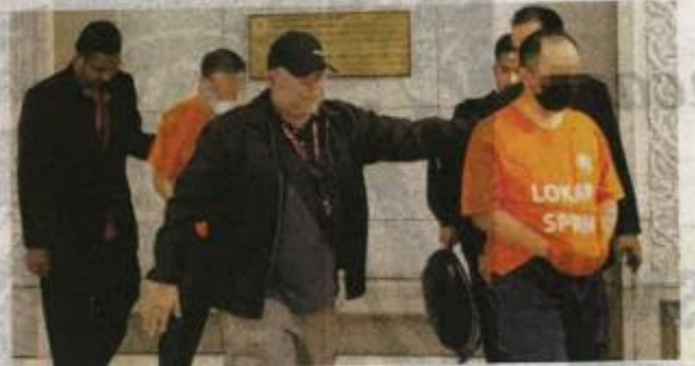
Dua termasuk ahli perniagaan bergelar Datuk Seri dilanjut reman tiga hari untuk siasatan lanjut.

"Kenderaan tersebut ialah Rolls Royce Ghost V12 EWB,