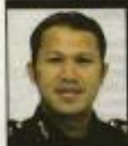
Pengarah Bahagian Penyelidikan dan Penyelidikan Rasuah Malaysia (SPRM)

• Korea Selatan dilihat berjaya membentuk budaya rakyatnya agar tidak berkompromi kepada rasuah, penyelewengan dan salah laku