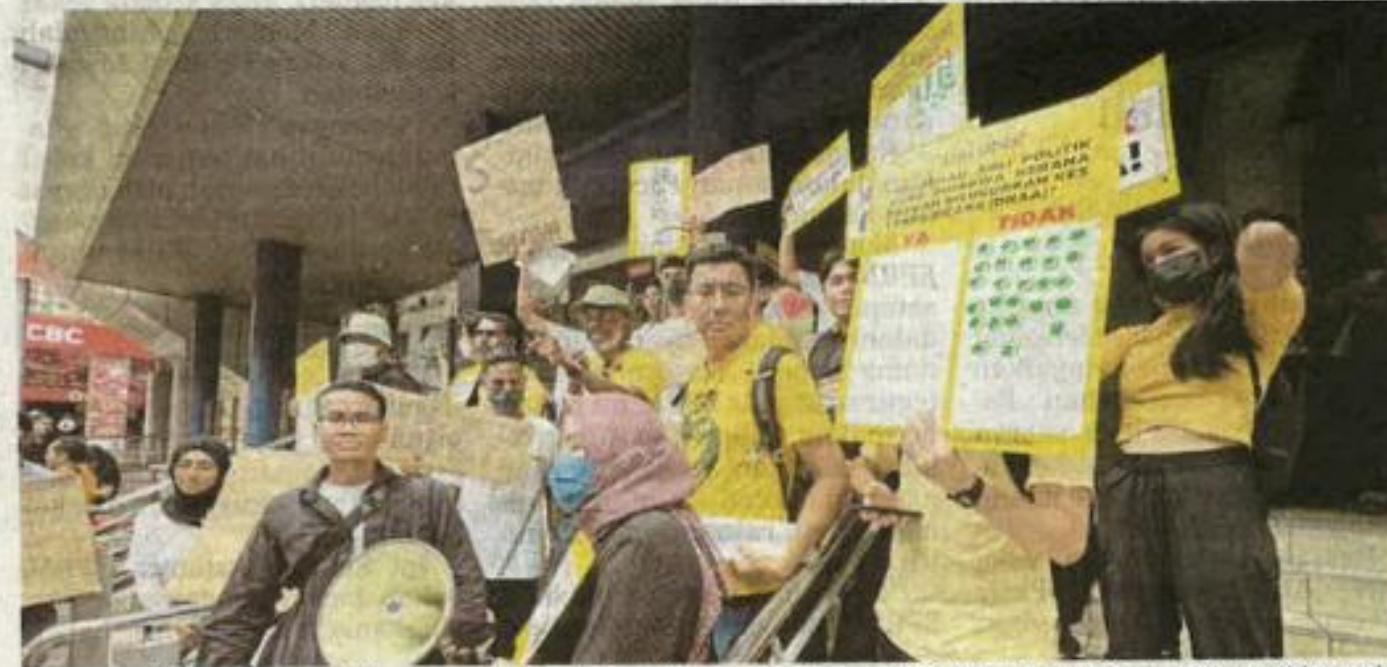
Himpunan 'flashmob' BERSIH yang turut disertai wakil anak muda dan NGO di hadapan Stesen LRT Masjid Jamek, Kuala Lumpur, semalam.

Seiring itu, katanya, BERSIH menggesa Perdana Menteri, Datuk Seri Anwar Ibrahim mengumumkan garis masa pelaksanaan pemisahan bidang kuasa Peguam Negara dan Pendakwa Ra-