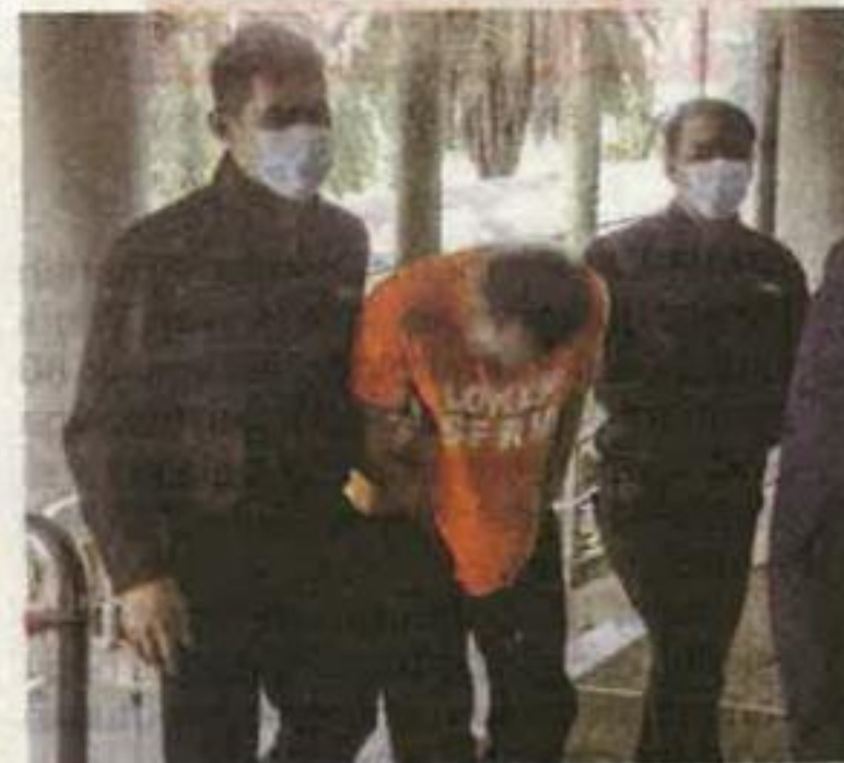
Suspek yang memakai baju lokap berwarna oren dibawa untuk mendapatkan permohonan reman di Mahkamah Masjistret Shah Alam pada Khamis.

Sementara itu, Pengarah SPRM Selangor, Datuk Alias Salim mengesahkan penahanan terhadap suspek dan kes disiasat mengikut Seksyen 16(a)(B) Akta SPRM 2009.