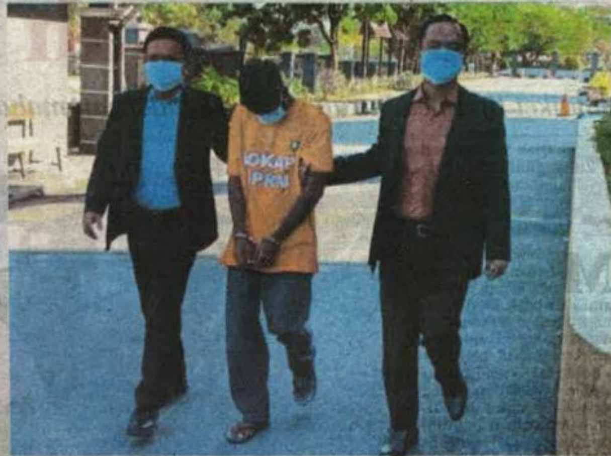
PEMANDU lori direman tujuh hari selepas didapati menawarkan dan memberikan rasuah RM500 kepada anggota JPJ.