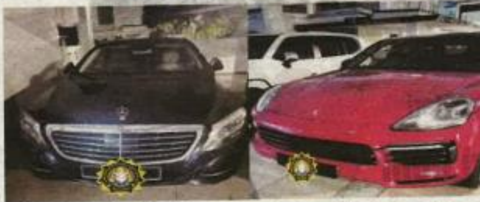
Antara kenderaan mewah yang disita SPRM untuk siasatan meminta serta menerima suapan daripada beberapa syarikat yang mendapat tender di sebuah kementerian.

Mereka dipercayai menerima suapan daripada syarikat serta kontraktor yang mendapat tender kerja bernilai jutaan ringgit di sebuah kementerian sekitar 2020 hingga 2021.