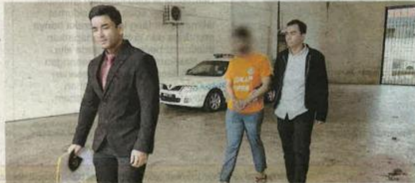
Suspek dibawa ke Mahkamah Majistret Alor Setar untuk mendapatkan perintah reman.