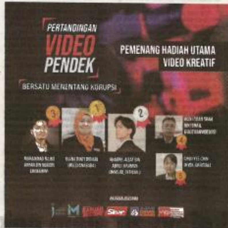
Pemenang-pemenang utama pertandingan video pendek.

Pertandingan berkenaan merupakan inisiatif bersama Ikram Muda Malaysia, Sinar Harian, Ajar Demokrasi dan Persatuan Profesional Kewangan Muslim Malaysia (MPFK).