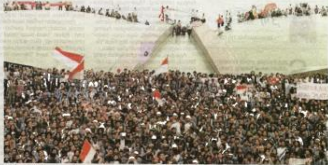
Indonesia sekat untuk membatasi gejala rasuah di negara tersebut sehingga berjaya mencapai Indeks Persepsi Rasuah (CPI) yang amat membanggakan.

S AYA menganggi program Penguatan Antikorupsi untuk Penyelenggara Berintegritas (Paku Integritas) amat bermakna sekali. Buat julung-julung kalinya kesemua calon presiden (capres) dan calon wakil presiden (timbalan presiden atau cawapres) berada di Komisi Pemberantasan Korupsi (KPK) untuk menyatakan komitmen mereka memerangi rasuah.