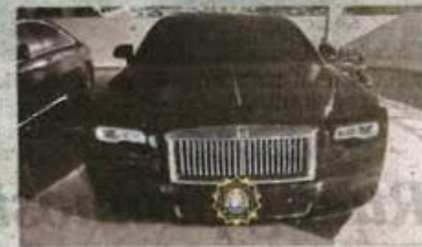
ANTARA kereta yang disita SPRM.