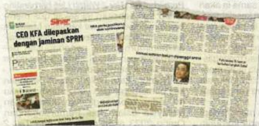
Laporan Sinar Harian mengenai kes rasuah KFA.

Wang itu dipercayai sebagai balasan bagi membantu seorang pemilik syarikat mendapatkan tender projek pembinaan litar lumba dan projek mengurus, mengoperasikan serta menyelenggara lima loji takungan air di Kedah.