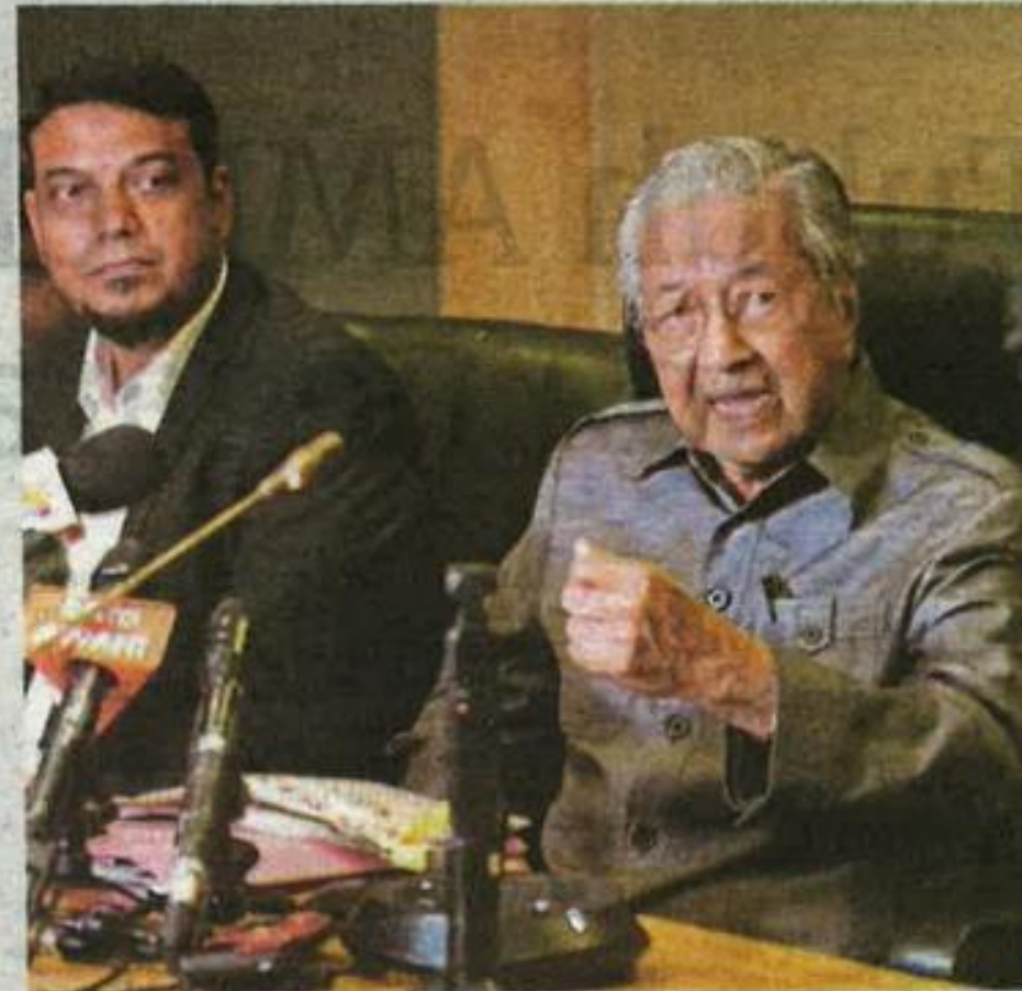
Dr Mahathir ketika sidang media di Yayasan Kepimpinan Perdana, Putrajaya, semalam.

Dr Mahathir berkata, beliau tiada kuasa justeru mudah disiasat, sebaliknya adalah lebih sukar menyiasat mereka yang berkuasa terutama Perdana Menteri, Timbalan Perdana Menteri, menteri kanan dan Ke-