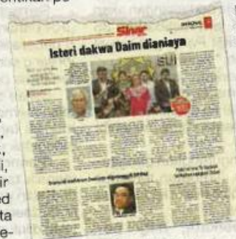
Laporan Sinar Harian pada Khamis.