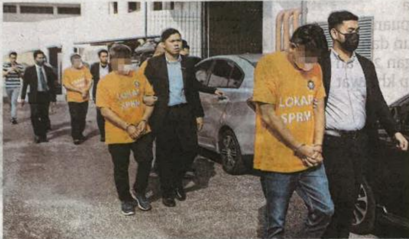
SPRM tahan reman empat individu bantu siasatan berhubung dakwaan meminta serta menerima rasuah bernilai lebih RM6 juta.