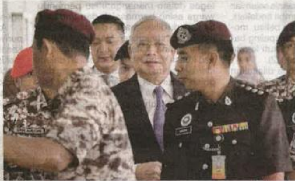
Najib (tengah) ketika hadir bagi prosiding sambung bicara kes penyelewengan dana 1MDB di Mahkamah Tinggi Kuala Lumpur pada Jumaat.

"Datuk Seri Najib sebagai Perdana Menteri ketika itu sepatutnya tahu bahawa perbincangan usaha sama G2G aras tertinggi seperti ini memerlukan saluran diplomatik yang sah dan bukannya berpunca daripada