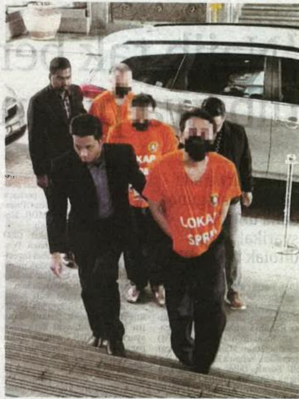
Suspek dibawa ke Mahkamah Majistret Putrajaya, semalam.

Beliau berkata, SPRM juga kemungkinan memanggil beberapa individu lain bagi memberi keterangan untuk membantu siasatan.