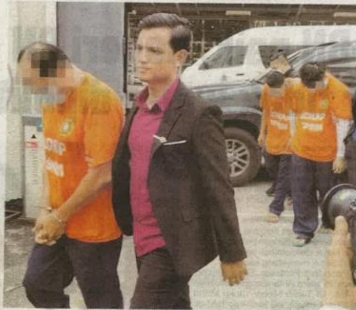
Ketiga-tiga suspek di pekarangan mahkamah pada Jumaat.

Tangkapan terhadap ketiga-tiga individu terbabit dipercayai dibuat atas kesalahan tuntutan palsu dan menjadi dalang kartel terbabit kepada 13 syarikat