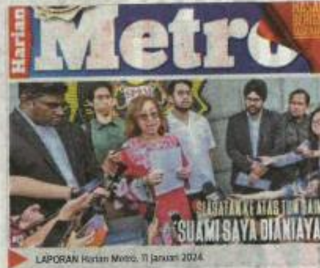
LAPORAN Harian Metro, 17 Januari 2024

"SPRM juga bertindak secara tidak sah apabila mengeluarkan 36 notis di bawah Seksyen 36(1) Akta SPRM kepada Daim dan ahli keluarganya supaya mendedahkan maklumat mengenai harta mereka yang berkaitan dengan kesalahan di bawah akta