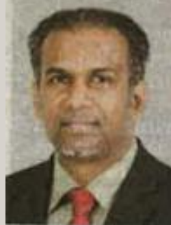
Timbalan Pengarah Pusat Kokurikulum Dan Pembangunan Pelajar, Universiti Putra Malaysia (UPM)