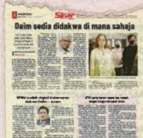
Laporan Sinar Harian pada Khamis.

SHAH ALAM - Bekas Menteri Kewangan, Tun Daim Zainuddin akan didakwa di mahkamah pada minggu depan, kata Ketua Pesuruhjaya Suruhanjaya Pencegahan Rasuah Malaysia (SPRM), Tan Sri Azam Baki.