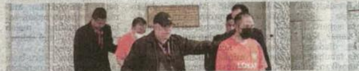
REMAN bekas setiausaha politik bekas menteri dan seorang ahli perniagaan bergelar Datuk Seri disambung di Mahkamah Majistret Putrajaya.

Januari lalu bagi membantu siasatan terhadap kes berkenaan," katanya.