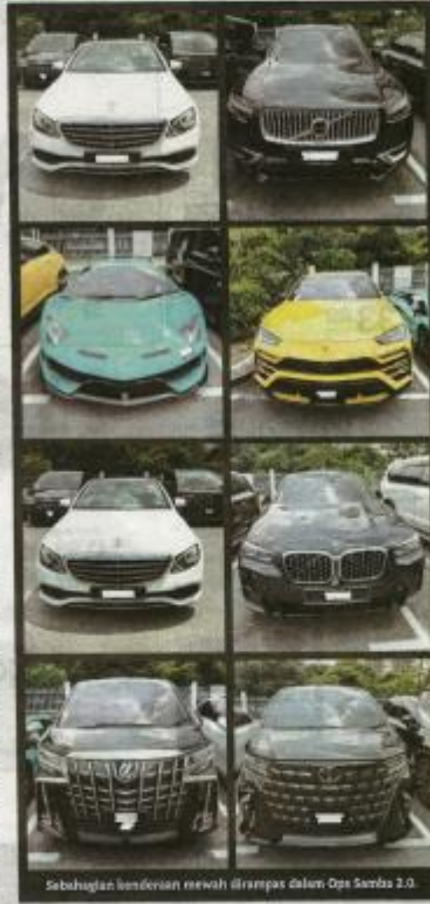
Sebahagian kenderaan mewah dirampas dalam Ops Samba 2.0.