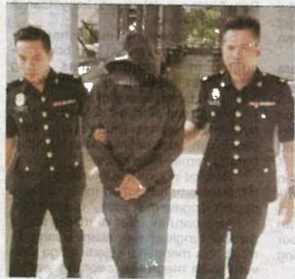
Tertuduh dibawa keluar dari Mahkamah Sesyen di Seremban pada Selasa.