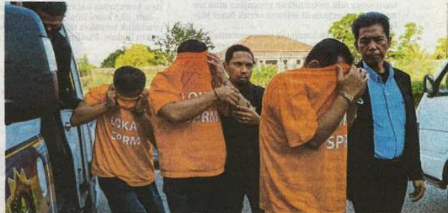
Tertuduh tiba di Mahkamah Sesyen Kota Bharu, semalam.

Media semalam melaporkan, tiga pegawai kanan agensi kerajaan berusia antara 40 hingga 49 tahun ditahan kerana disyaki terbabit meminta dan menerima rasuah bagi pelbagai projek, ter-