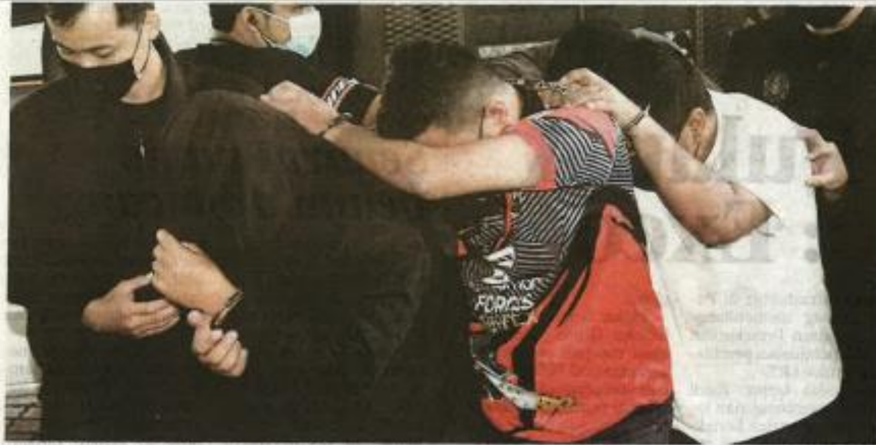
TERTUDUH dibawa ke Mahkamah Sesyen Shah Alam atas pertuduhan menerima rasuah dengan nilai keseluruhan RM39,750.