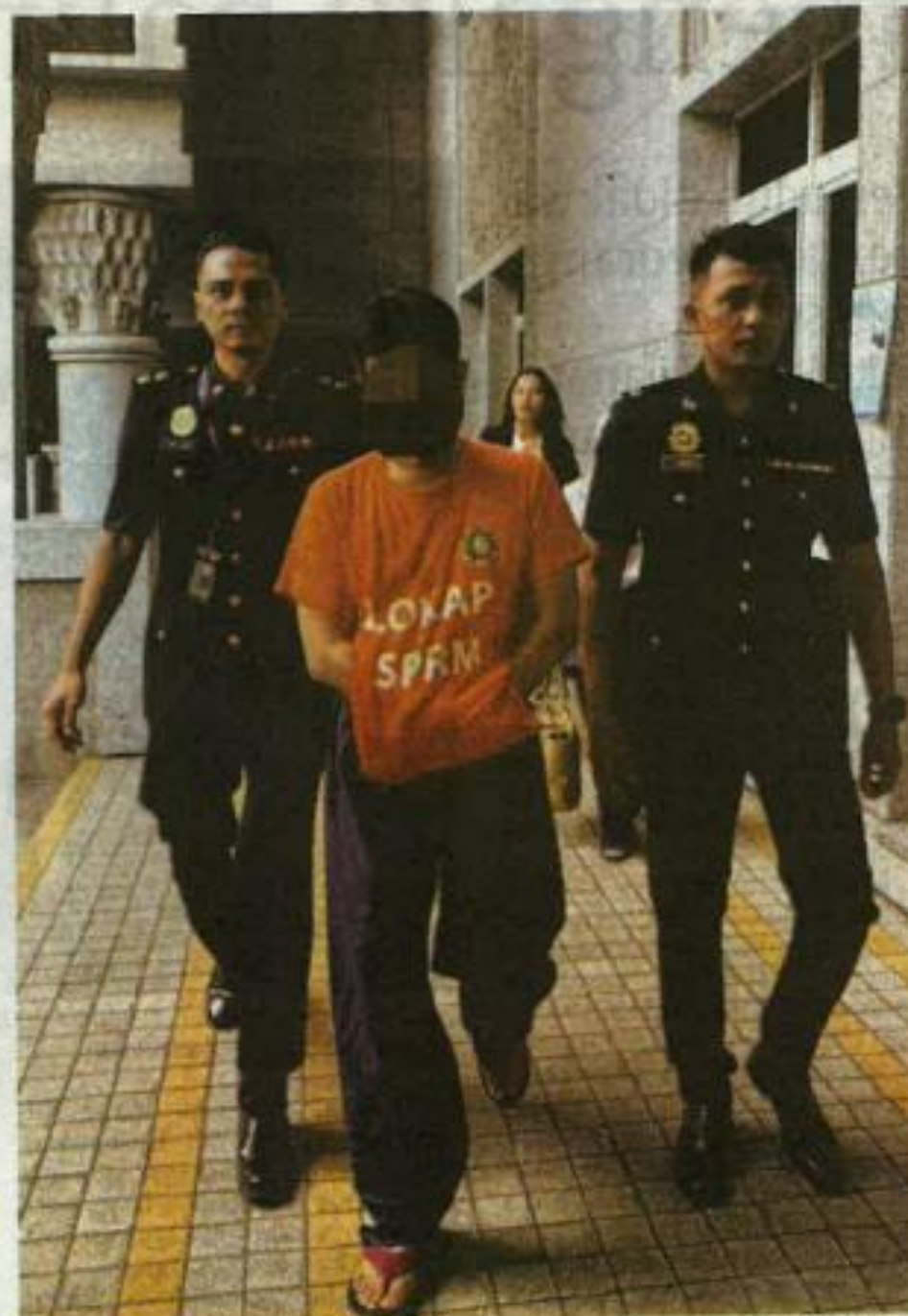
Bekas ketua pegawai eksekutif badan berkanun dibawa ke Mahkamah Majistret Putrajaya, semalam.