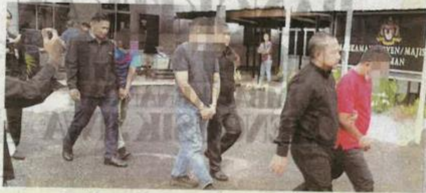
Suspek dibawa keluar dari Mahkamah Sesyen Kemaman pada Isnin.