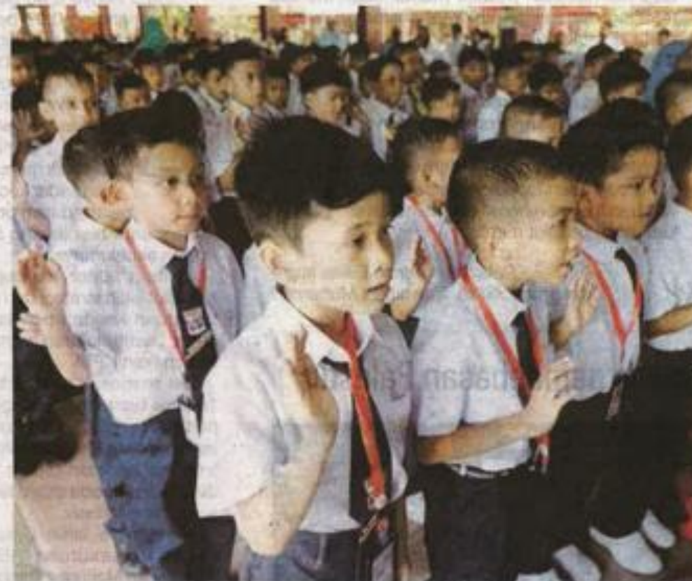
Kempen kesedaran dan pendidikan benci rasuah boleh bermula dari peringkat sekolah melalui aktiviti kokurikulum. - Gambar hiasan

"Malah, ibu bapa adalah individu yang paling rapat dengan anak-anak turut memainkan peranan penting dengan memberikan contoh yang baik