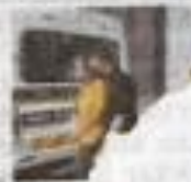
Keratan akhbar BH, 25 April lalu.