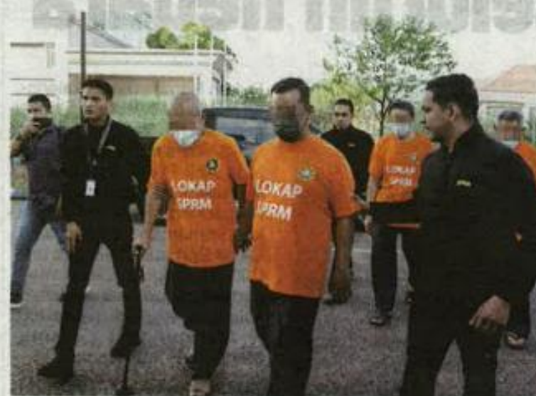
Empat individu termasuk dua bekas pegawai kanan syarikat air direman di Mahkamah Majistret Kota Bharu pada Khamis.

KOTA BHARU - Dua bekas pegawai kanan syarikat air dan dua konsultan pembinaan telaga direman tiga hari bagi membantu siasatan Projek Pembinaan Telaga Jejari membabitkan nilai lebih RM300 juta.