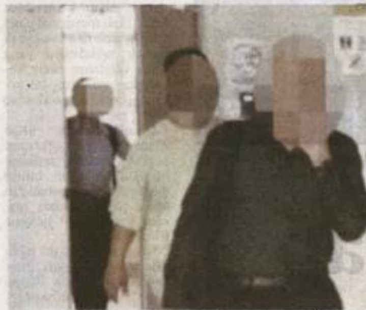
SUSPEK yang ditahan SPRM.

perceyai disebabkan berlakunya amalan rasuah dan penyelewengan dalam pelaksanaan projek pembinaan telaga jejari itu.