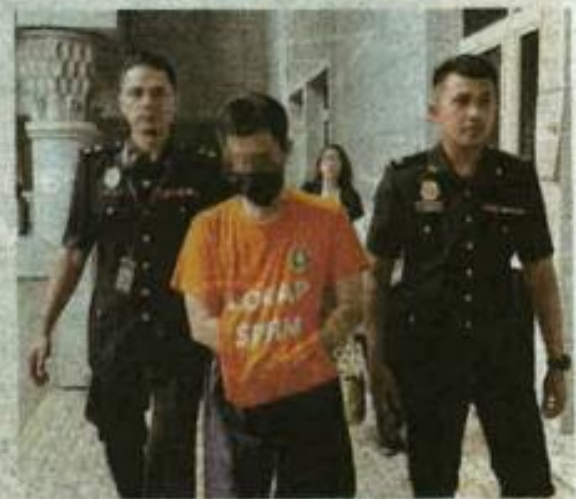
Suspek dibawa ke Mahkamah Majistret Putrajaya untuk permohonan reman pada Khamis.