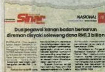
Laporan Sinar Harian pada Khamis.

Oleh TUAN BUQHAIRAH TUAN MUHAMAD ADNAN PUTRAJAYA