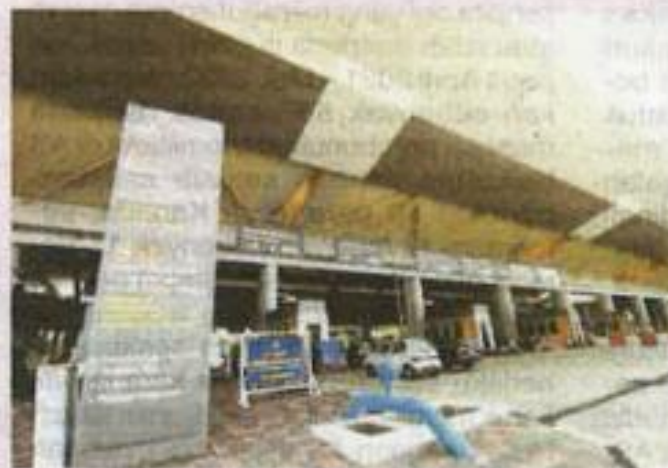
Pintu sempadan negara perlu dikawal oleh anggota penguat kuasa yang berintegriti. - Gambar hiasan

"Begitu juga jika dadah diseludup masuk ke negara ini, yang kita rata-rata me-