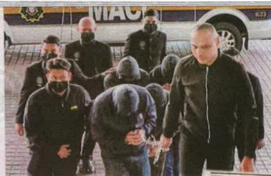
Tertuduh dibawa ke Mahkamah Sesyen Shah Alam, semalam.

Mereka didakwa mengikut Seksyen 17(a) Akta Suruhanjaya Pencegahan Rasuah Malaysia 2009 [Akta 694], yang boleh dihukum di bawah Seksyen 24(1) akta sama yang memperuntukkan hukuman penjara maksimum 20 tahun atau