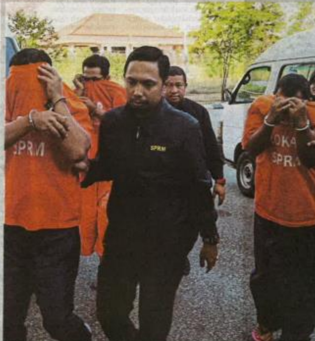
SUSPEK yang memakai baju lokap SPRM tiba di Mahkamah Sesyen Kota Bharu dengan dikawal oleh pegawai SPRM.

Seorang daripada mereka ditahan pada 30 April lalu untuk siasatan mengikut Seksyen 18 Akta SPRM 2009 selepas disyaki membuat tuntutan palsu sejak tahun lalu dan direman selama enam hari.