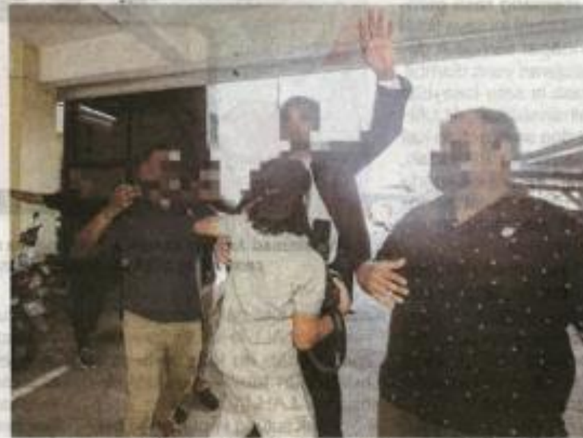
Beberapa individu dipercayai peguam dan pengawal peribadi OKS terbabit meminta supaya diberikan laluan dengan menolak jurugambar yang mahu menjalankan tugas.

IPOH - Suasana pekarangan Mahkamah Majistret Ipoh pada Selasa kecoh apabila petugas media dihalang merakam gambar seorang pengarah urusan sebuah syarikat hartanah yang direman Suruhanjaya Pencegahan Rasuah Malaysia (SPRM) bagi siasatan kes tanah rizab Melayu.