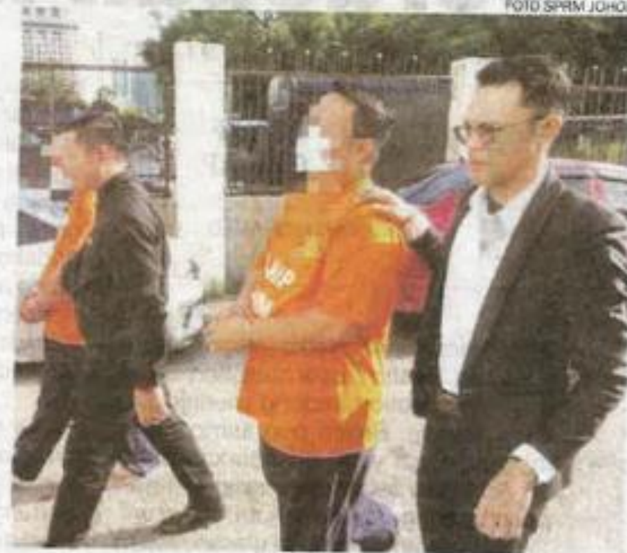
Dua suspek (berbaju lokap SPRM) direman selama sehari bagi membantu siasatan kes rasuah RM3.3 juta daripada dua pemilik syarikat kontraktor.

Sumber itu memberitahu, siasatan ke atas kedua-dua pegawai atasan berkenaan setelah SPRM menerima beberapa aduan sekitar tahun lalu di mana kedua-dua