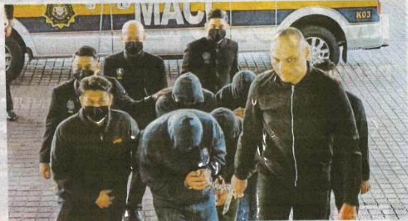
EMPAT pembantu penguasa JKDM didakwa di Mahkamah Sesyen Shah Alam, semalam.

Mereka didakwa mengikut Seksyen 17(a) Akta Suruhanjaya Pencegahan Rasuah Malaysia 2009 (Akta 694) yang boleh dihukum di bawah Seksyen 24(1) akta sama yang memperuntukkan hukuman penjara maksimum 20 tahun atau denda tidak kurang daripada lima kali ganda jumlah atau nilai suapan atau RM10,000, mengikut mana-mana yang lebih tinggi.