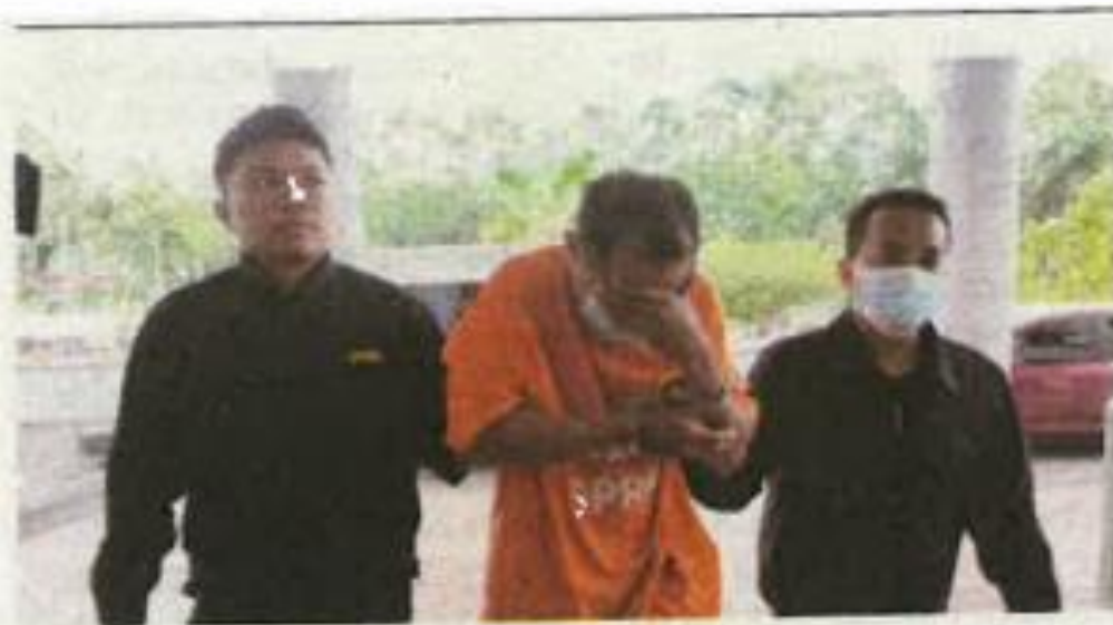
PENJAWAT awam sebuah institusi pendidikan direman lima hari di Mahkamah Majistret Ayer Keroh.