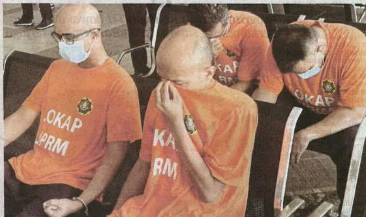
EMPAT individu termasuk jurutera direman bagi membantu siasatan mengemukakan tuntutan palsu pada 2020.

“ Projek itu tidak dilaksanakan mengikut spesifikasi yang ditetapkan Sumber