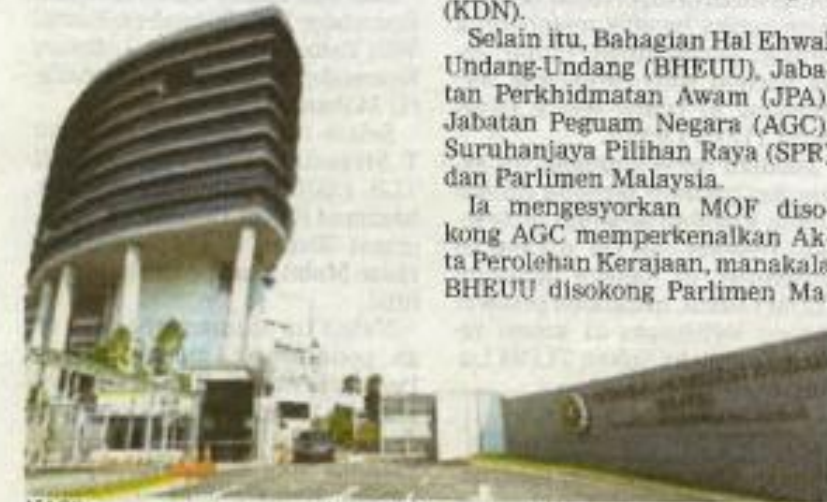
NACS 2024-2028 menyarankan SPRM menerajui substrategi bagi meneliti syarat dalam pelantikan dan pemecatan ketua pesuruhjayanya.

Bagi strategi Insentif pula disyor substrategi rebat cukai untuk individu dan syarikat yang mengambil bahagian dan menyumbang dalam program pencegahan rasuah, semakan elan saksi dalam kes perbicaraan rasuah, tawaran insentif kepada pemberi maklumat serta pengurangan cukai untuk galak penyertaan entiti yang menganjur-