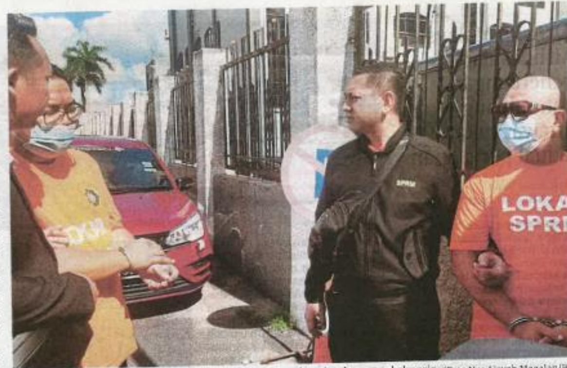
Suspek dibawa ke Mahkamah Majistret Johor Bahru untuk perintah reman, kelmarin.

Sumber SPRM dilaporkan berkata, kedua-dua suspek lelaki berusia 38 dan 35 itu telah ditahan di pejabat SPRM Selangor kira-kira jam 4 petang kelmarin