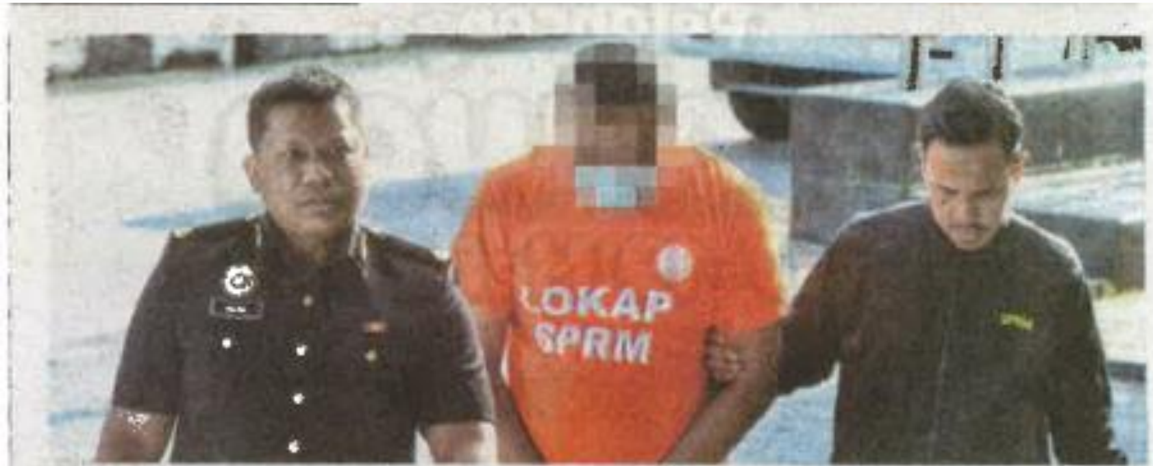
PEGAWAI SPRM mengiringi penjawat awam di Mahkamah Majistret Sivil, Seremban.

Seremban: Seorang penjawat awam ditahan Suruhanjaya Pencegahan Rasuah Malaysia (SPRM) kerana disyaki menyalahgunakan jawatannya bagi memohon dan meluluskan dana berjumlah RM12,000 untuk kepentingan dirinya.