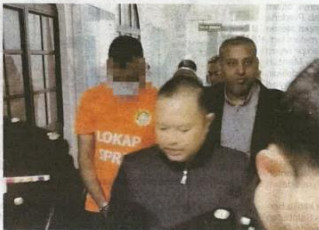
Salah seorang suspek dibawa ke mahkamah pada Rabu.

Penahanan tersebut berikutan siasatan ke atas beberapa aduan sekitar tahun 2023,