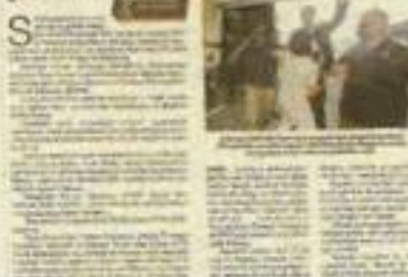
Laporan Sinar Harian pada Rabu.