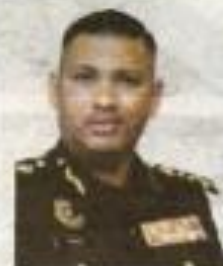
Isu integriti sebilangan pegawai dari institusi kewangan itu sendiri yang membawa kepada kewujudan akaun keldai yang berleluasa

“Institusi pelaporan ini juga bukan hanya bertumpu kepada institusi kewangan, tetapi turut melibatkan institusi lain seperti dalam Jadual Pertama AML/PPUAA,” katanya.