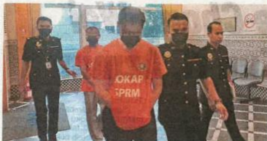
Dua pegawai kanan badan berkanun yang ditahan SPRM kerana disyaki menyalah guna kuasa dan menyeleweng dana peruntukan pinjaman.