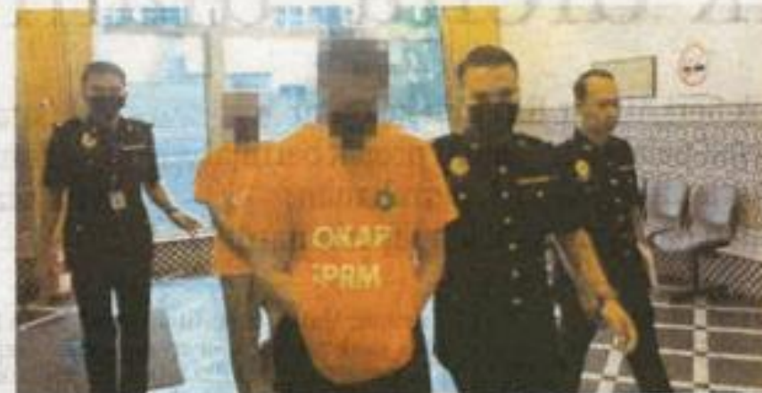
Suspek dibawa ke Mahkamah Majistret Putrajaya untuk perintah reman, semalam.

Beliau berkata, kes itu disiasat mengikut Seksyen 23 Akta SPRM 2009.