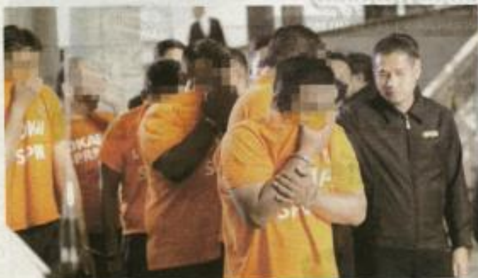
SPRM menahan 34 anggota dan pegawai (JKM dari Grad 19 hingga 44, bersama 27 individu dan pemilik syarikat dalam Ops Samba 2.0.