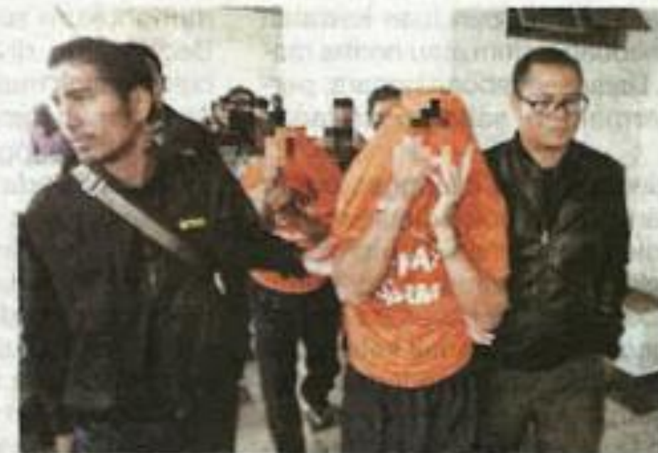
Dua anggota polis direman selama tujuh hari bagi membantu siasatan berhubung kes menerima suapan RM2,500.