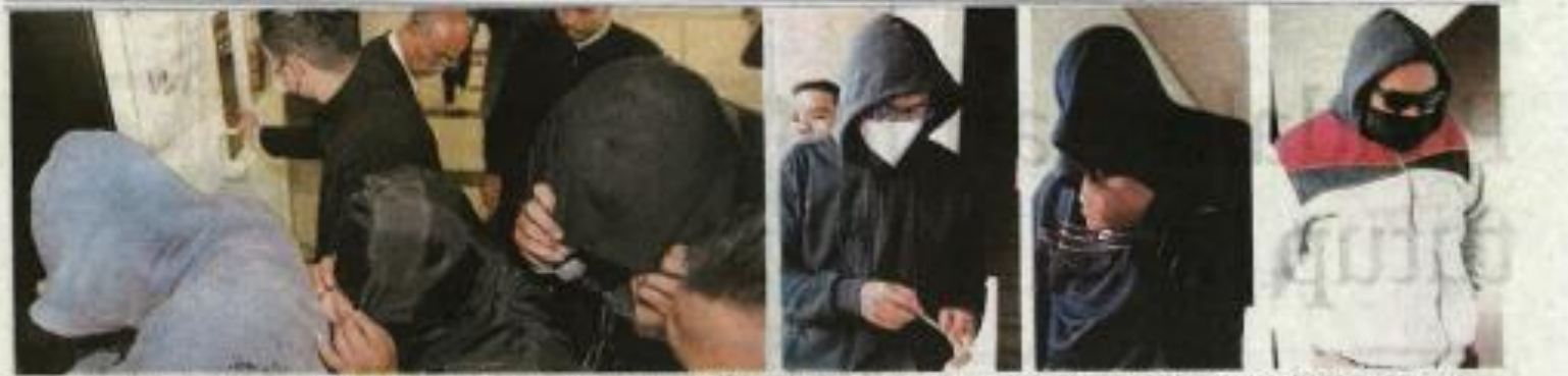
Pegawai dan dua Pembantu Pengawal JKDM dibawa ke Mahkamah Sesyen Shah Alam (gambar kiri), manakala tiga penguat kuasa kastam didakwa di Mahkamah Sesyen Kuala Lumpur, semalam.