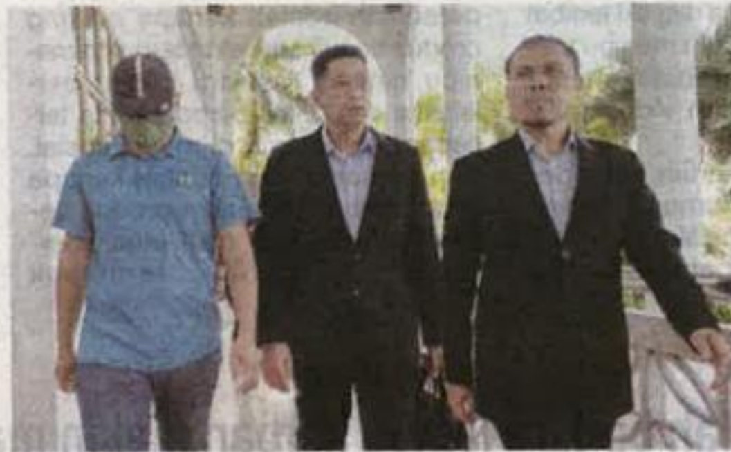
Pegawai polis terbabit (kiri) didakwa di Mahkamah Sesyen Alor Setar pada Selasa.

Perbuatan itu dilakukan dalam sebuah kereta Proton Persona di Kampung Kenangan, Serdang di daerah Bandar Baharu pada jam 10.15 malam, 21 Jun 2021.