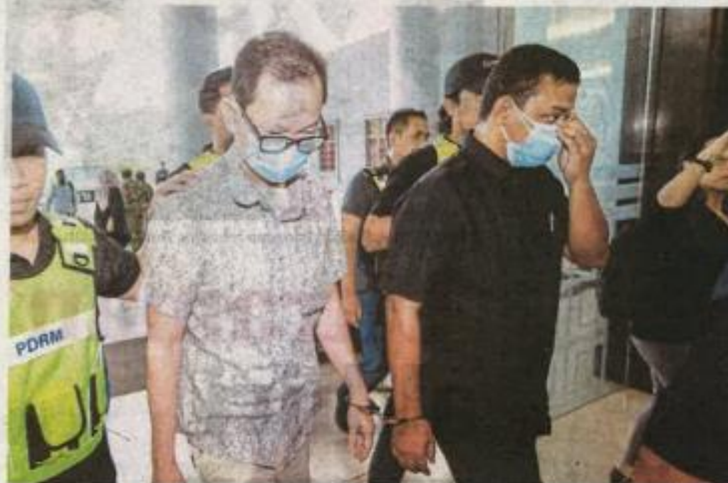
DUA pegawai kanan PDRM diringi Unit Siasatan Jenayah Terkelas (USJT) di Kompleks Mahkamah Kuala Lumpur, Jalan Duta.

dilakukan di pejabat Ketua Penolong Pengarah Siasatan Perakaunan Forensik, Menara KPJ, di sini, pada 12.30 tengah hari, 18 April lalu dan di tempat letak kereta berbayar menara berkenaan antara 10.30 pagi hingga 1 tengah hari 19 April lalu.