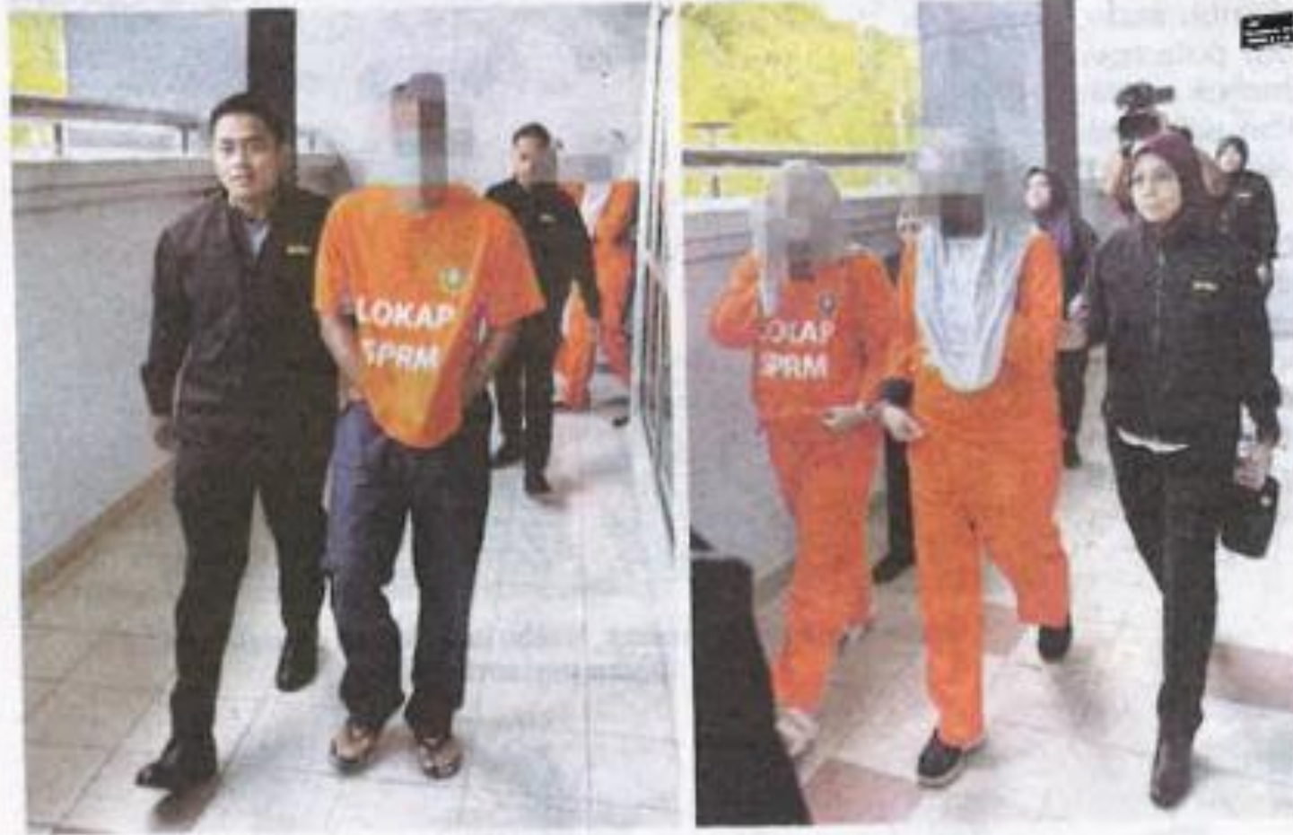
Suspek lelaki dan wanita diiring pegawai SPRM ketika hadir ke mahkamah.

SEREMBAN - Empat penjawat awam direman tujuh hari oleh Suruhanjaya Pencegahan Rasuah Malaysia (SPRM) kerana disyaki meminta dan menerima rasuah sebagai dorongan mendapatkan projek pembekalan dan perkhidmatan.