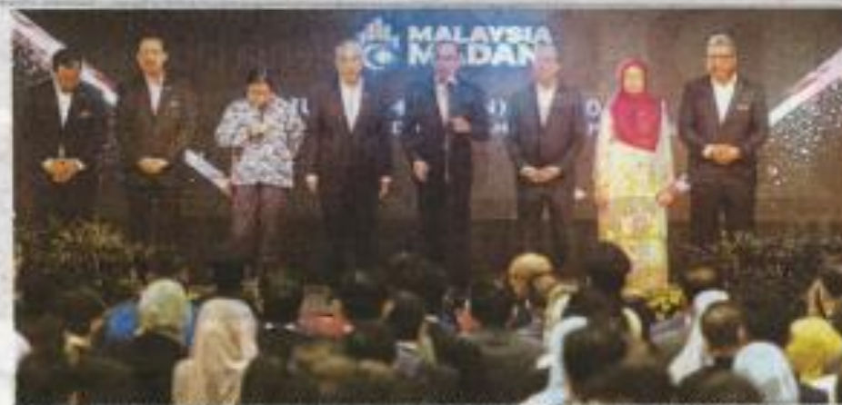
Anwar berucap pada Majlis Perjumpaan bersama warga Jabatan Perdana Menteri bagi Jun di Putrajaya, semalam.