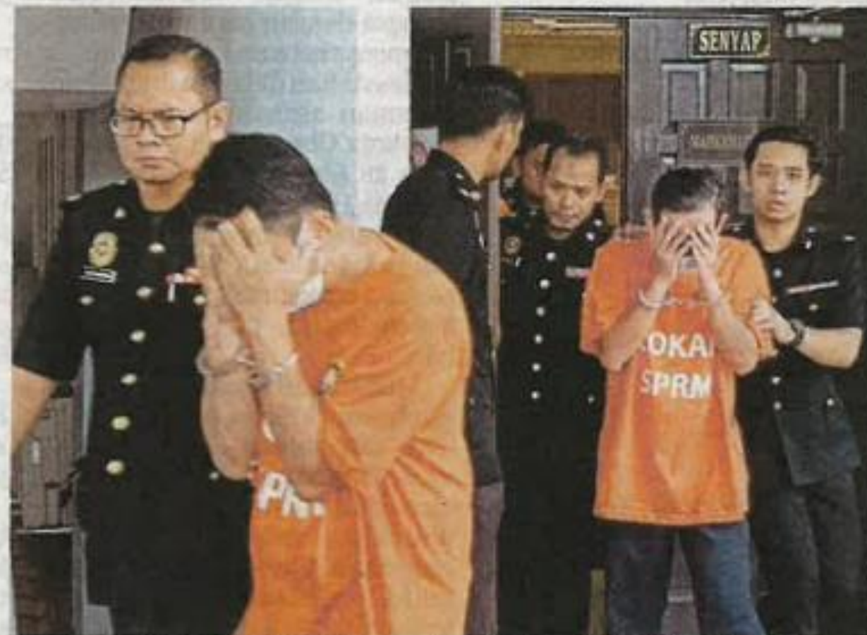
Suspek yang ditahan SPRM dibawa ke Mahkamah Majistret Melaka, semalam.