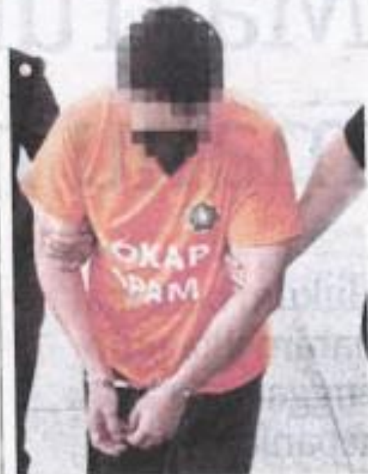
Warga Singapura dibawa ke Mahkamah Majistret Putrajaya, semalam.