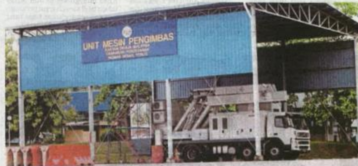
Penggunaan mesin pengimbas diyakini mampu memperkasa tahap keselamatan kawalan pintu masuk sempadan negara. (Foto hiasan)

BH semalam, melaporkan JKDM membeli tujuh mesin pengimbas baharu yang dilengkapi teknologi kecerdasan buatan (AI) untuk ditempatkan di pintu masuk negara, sebagai usaha me-