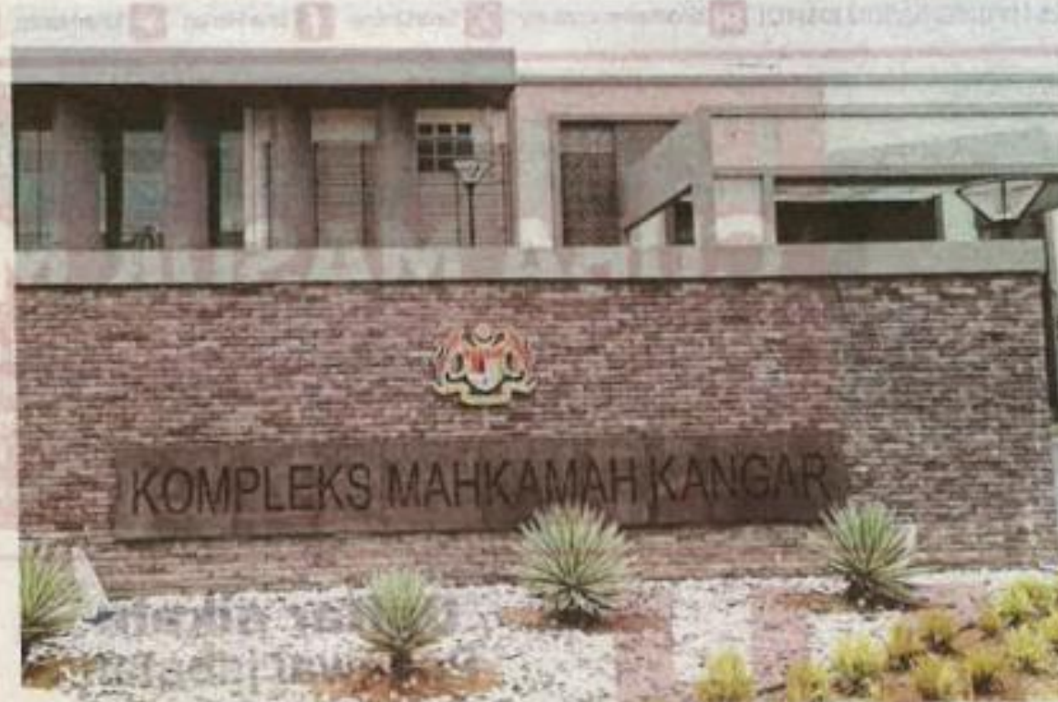
Perintah reman terhadap tiga suspek dikeluarkan Mahkamah Majistret Kangar pada Rabu.

Sumber itu memaklumkan suspek pertama yang bekerja sebagai pendaftar perkahwinan ditahan kira-kira 4 petang hingga 7 malam Selasa di pejabatnya, manakala pemilik syarikat dan bapa ditahan jam 6 petang ketika hadir di pejabat SPRM bagi dirakamkan ke-