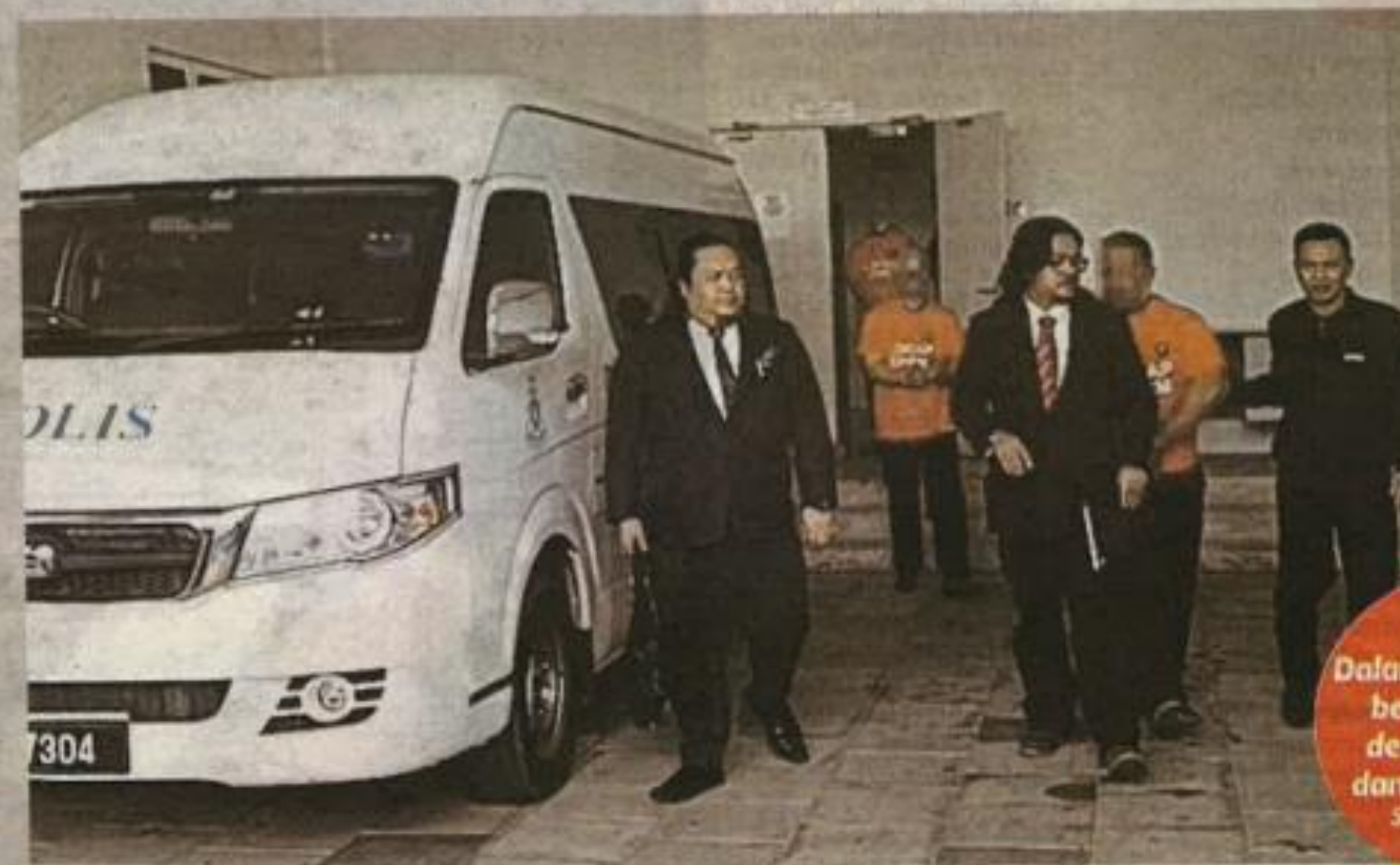
SUSPEK dibawa keluar dari pekarangan Mahkamah Majistret Kangar oleh anggota SPRM Perlis.