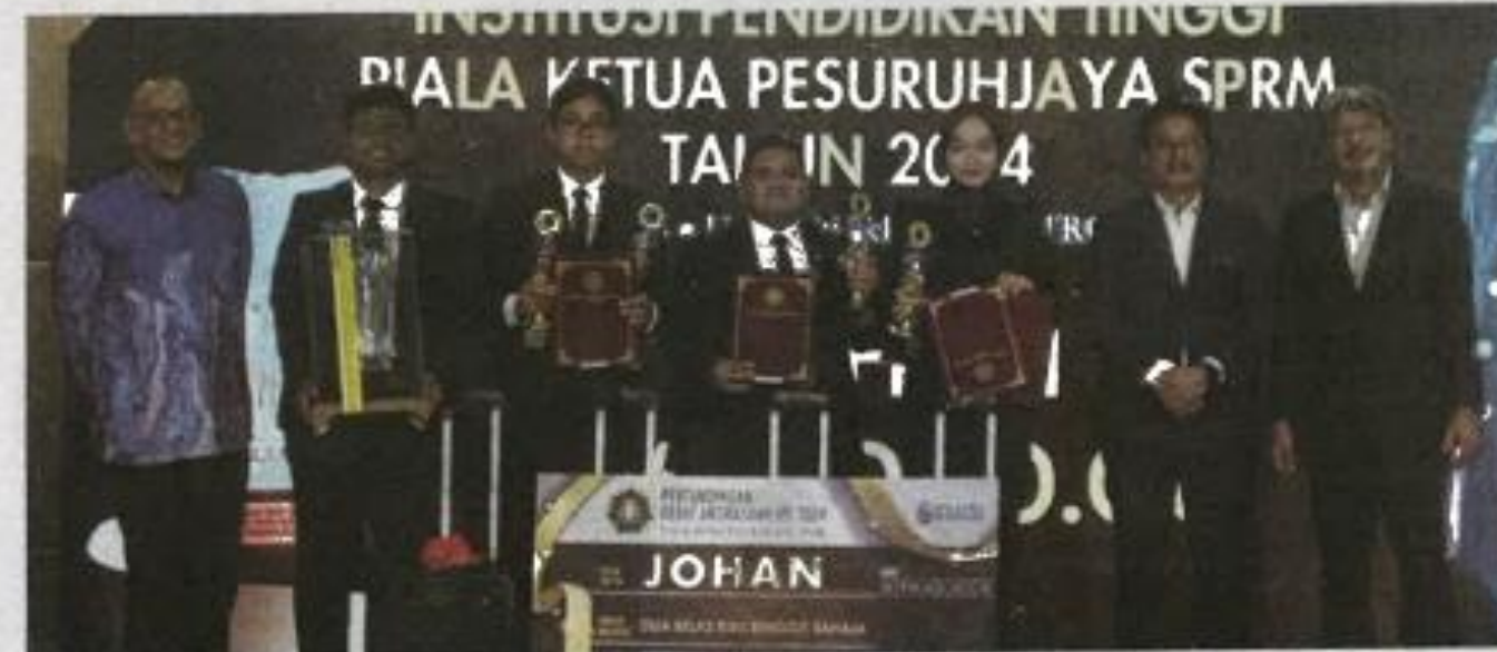
Azam (dua dari kanan) bersama pemenang selepas menyempurnakan Majlis Perasmian Penutupan Pertandingan Debat Antirasuah IPT Piala Ketua Pesuruhjaya SPRM 2024 ke-5 di UTP, di Parit, semalam.

akan dilaksanakan pada waktu terdekat. Azam bagaimanapun tidak dapat memberi kepastian, walaupun mengakui siasatan kini pada peringkat kedua selepas pertuduhan di Mahkamah Sesyen Ipoh ke atas seorang pesara PTG Perak pada 30 April lalu.