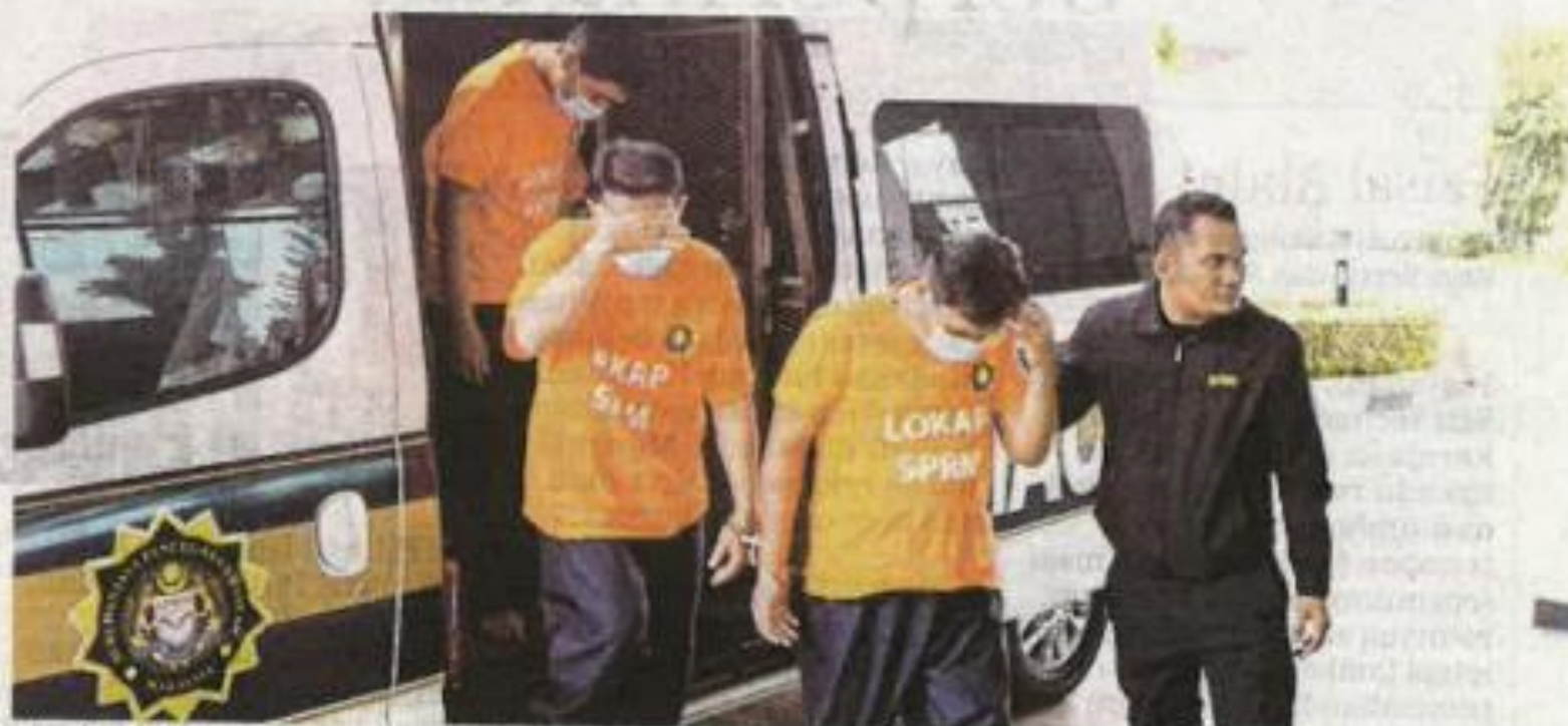
Tiga daripada empat suspek yang direman kerana dipercayai menerima rasuah secara bulanan.

malam, direman tujuh hari hingga 14 Jun ini, manakala seorang suspek yang juga bekas anggota agensi penguat kuasa ditahan reman selama lima hari hingga 12 Jun.