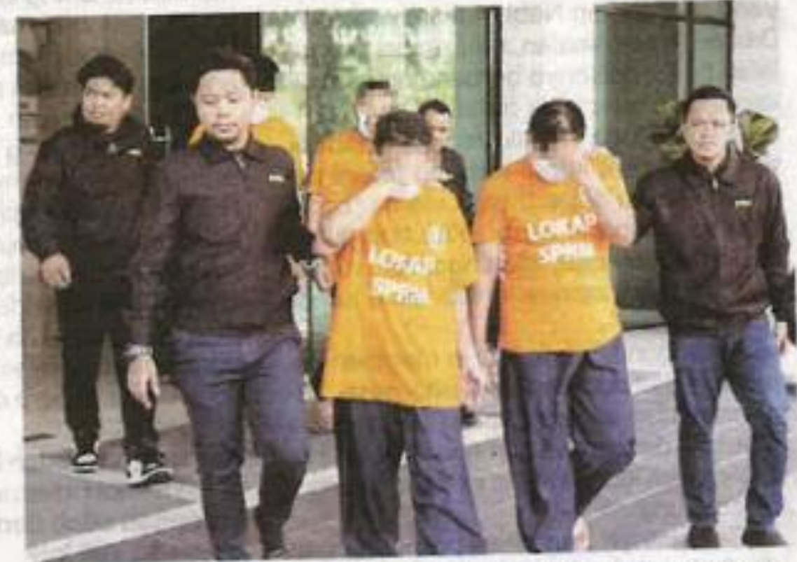
Empat individu termasuk tiga penjawat awam ditahan SPRM Kuala Lumpur pada Jumaat untuk siasatan menerima rasuah bagi melindungi pusat hiburan dan premis urut di ibu negara.

Sementara itu, Menteri di Jabatan Perdana Menteri