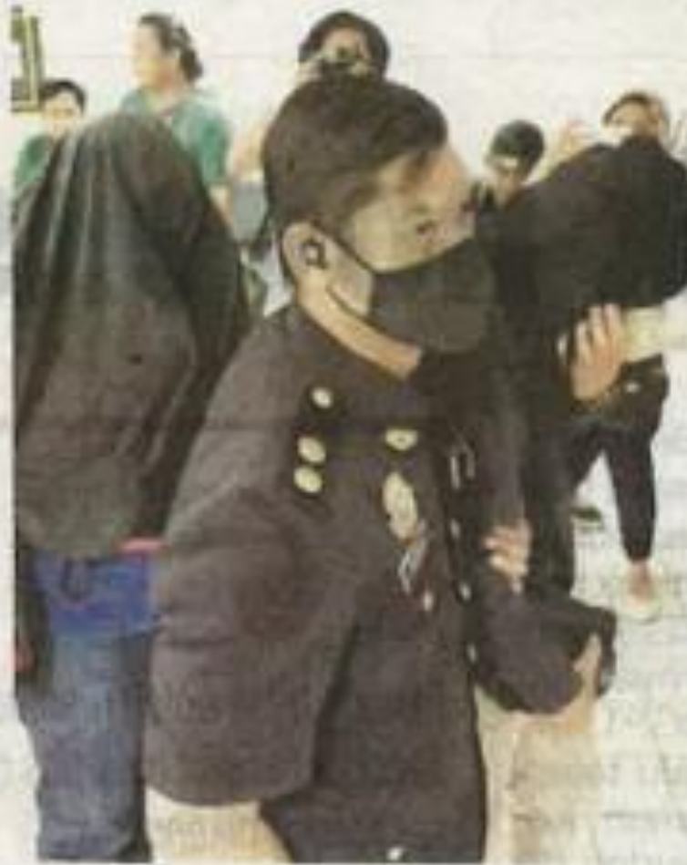
Dua pembantu penguasa kastam (tutup kepala) dihadapkan ke Mahkamah Sesyen Kuala Terengganu, pada Selasa.

KUALA TERENGGANU - Dua pembantu penguasa Jabatan Kastam Diraja Malaysia dihadapkan ke Mahkamah Sesyen di sini pada Selasa, atas 14 pertuduhan menerima rasuah berjumlah RM12,500 sejak 2017 sehingga 2023.