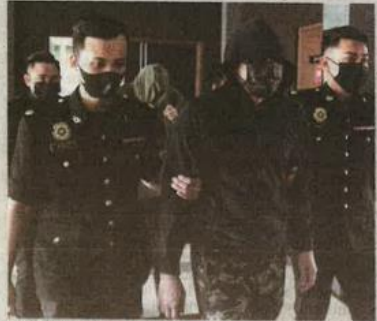
TERTUDUH dibawa ke Mahkamah Sesyen Kota Bharu atas tiga pertuduhan menerima rasuah berjumlah RM4,300.

Mahkamah turut menetapkan 21 Julai untuk sebutan semula kes.