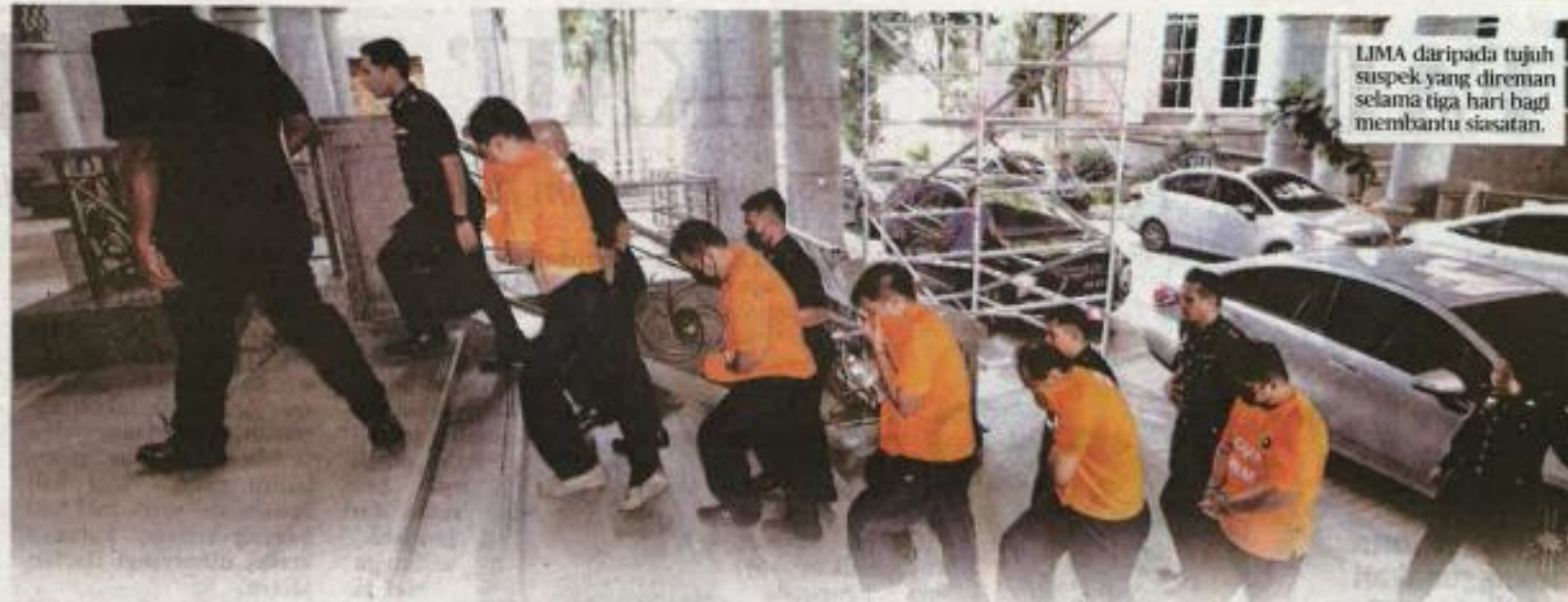
LIMA daripada tujuh suspek yang direman selama tiga hari bagi membantu siasatan.

"Sindiket ini dipercayai membuat pengisytiharan palsu dalam Borang Kastam bagi mengelakkan dikenakan cukai dan pengimportan barangan yang memerlukan permit import beberapa agensi seperti Suruhanjaya Tenaga (ST)