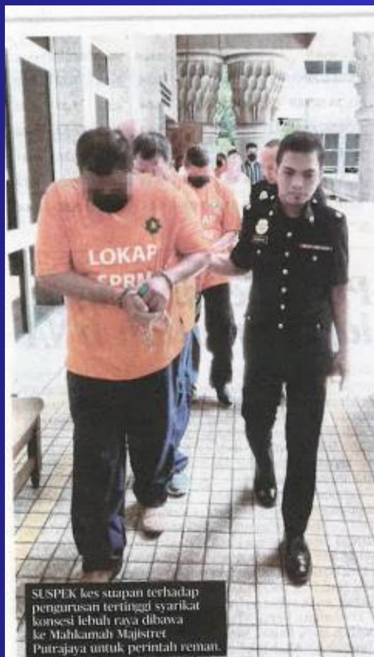
SUSPEK kes suapan terhadap pengurusan tertinggi syarikat konsesi lebuhraya dibawa ke Mahkamah Majistret Putrajaya untuk perintah reman.