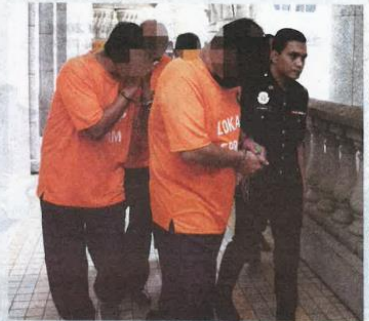
Suspek dibawa ke Mahkamah Majistret Putrajaya untuk perintah reman.

"Keseluruhan nilai kedua-dua projek itu adalah berjumlah RM 11 bilion," katanya.