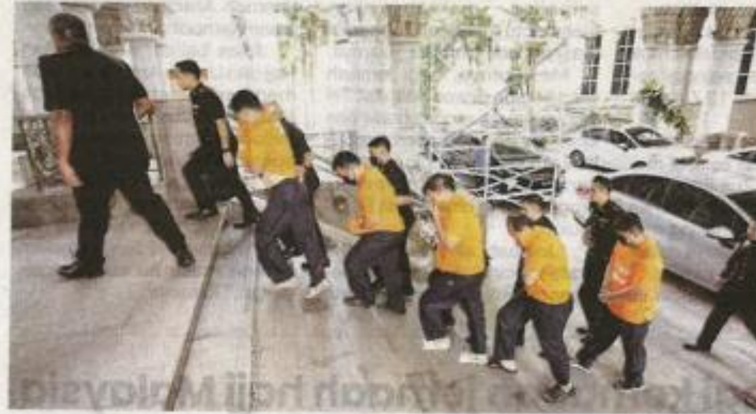
Tujuh individu yang terlibat dalam kes 'kontena terbang' bergiat aktif di Pelabuhan Klang dibawa ke Mahkamah Majistret Putrajaya pada Jumaat bagi proses reman.

Susulan penahanan itu, katanya, kesemua suspek yang terdiri daripada tiga pegawai agensi penguat kuasa, seorang