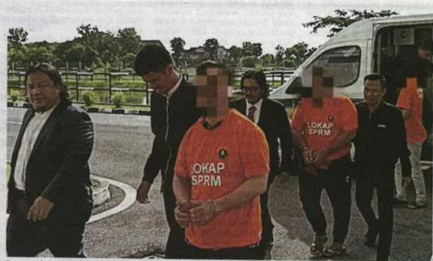
Pegawai kanan JAIPs serta dua suspek dibawa keluar dari pekarangan Mahkamah Kangar, semalam.

Suspek utama yang juga pegawai kanan di JAIPs itu dipercayai bekerjasama dengan dua lagi suspek, iaitu imam masjid itu dan anak imam berkeenaan yang juga pemilik sebuah