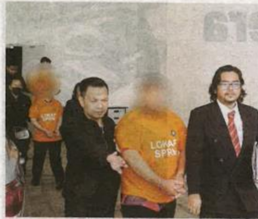
Tiga suspek tersebut disambung reman di Mahkamah Kangar pada Ahad.