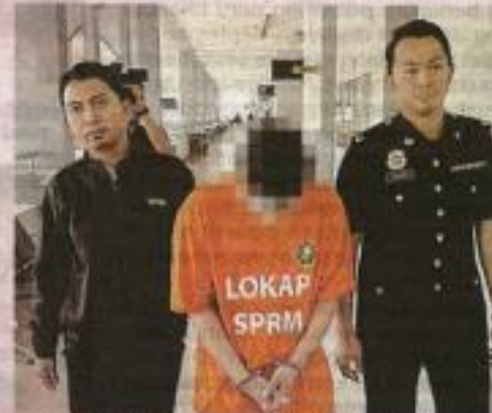
Suspek diiring pegawai SPRM ketika hadir ke mahkamah di Seremban bagi permohonan reman.

Beliau berkata, kes disiasat mengikut Seksyen 23 Akta SPRM 2009.