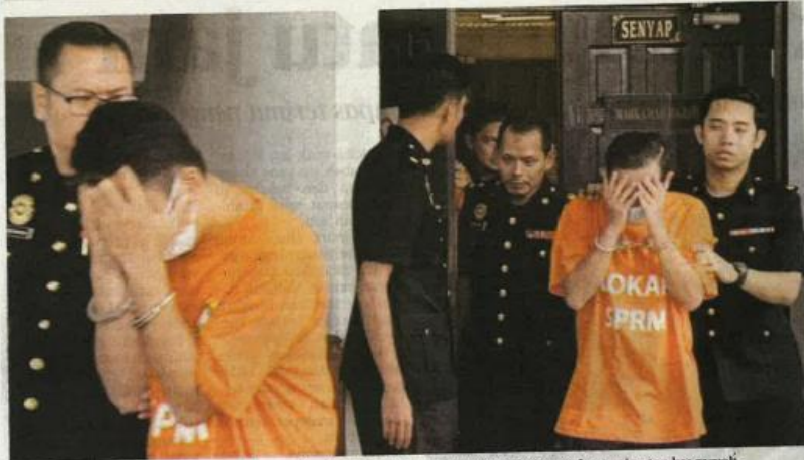
LIMA individu termasuk dua peguam direman tiga hari di Mahkamah Ayer Keroh bagi membantu siasatan kes rasuah.