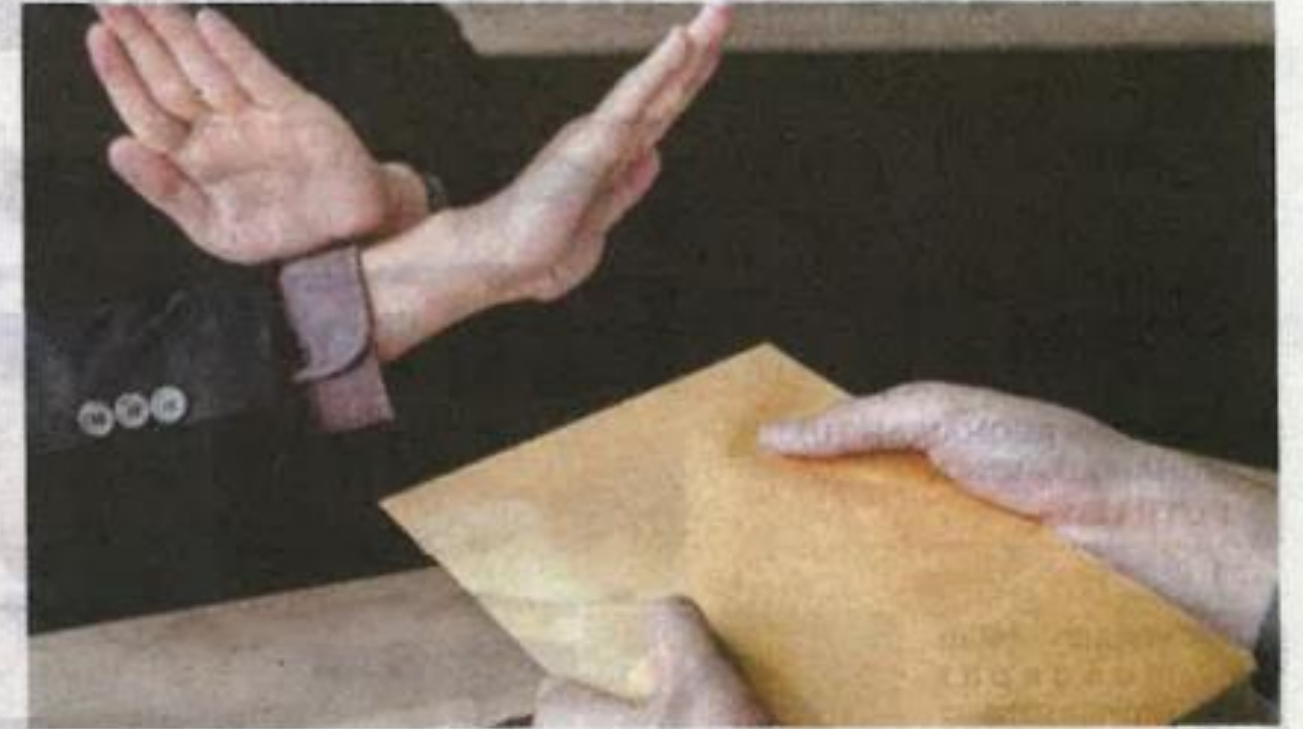
Seramai 514 penjawat awam sudah diberi ganjaran berjumlah lebih RM1 juta kerana melapor dan mendedahkan kes rasuah yang membawa kepada sabitan. Gambar hiasan.

Tambahnya, SPRM merupakan satu-satunya agensi penguatkuasaan yang menggunakan undang-undang berkenaan