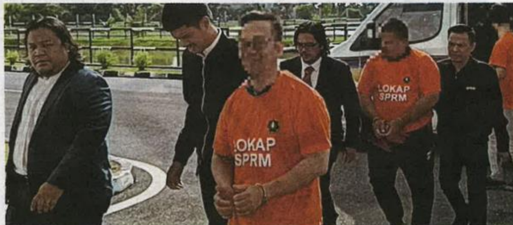
TIGA suspek diiringi peguam dibawa keluar dari Mahkamah Tinggi Kangar oleh anggota SPRM.

"Kita tidak menolak kemungkinan akan membe-