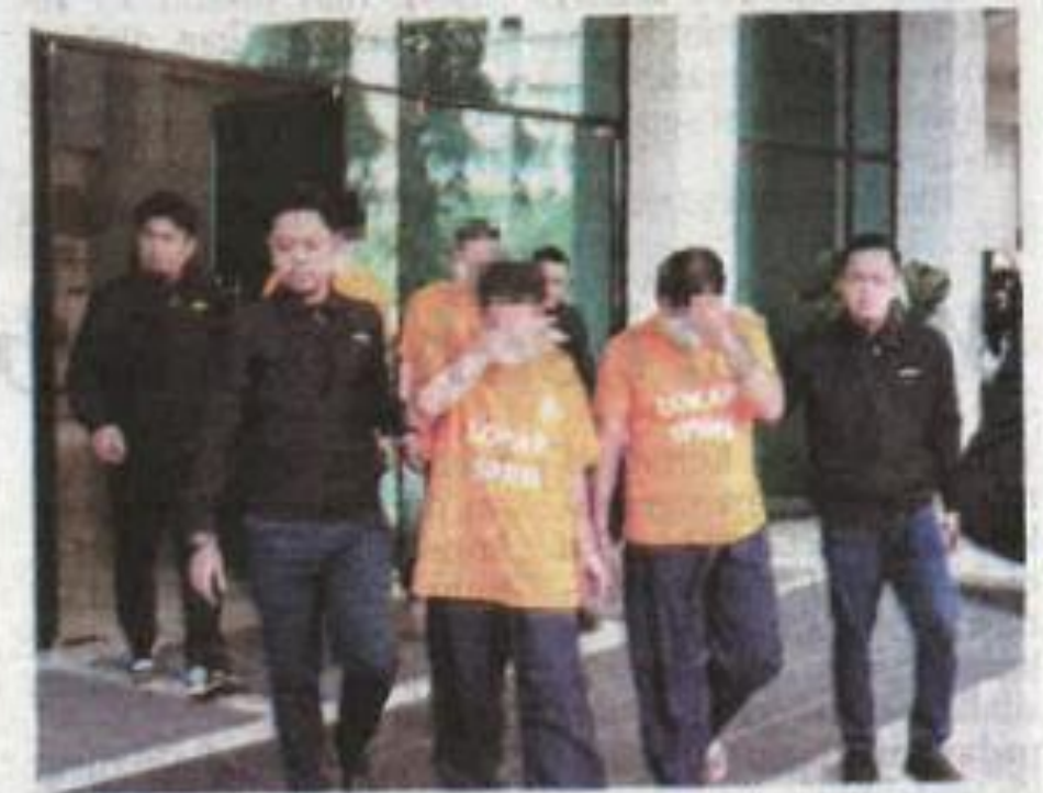
SPRM menahan reman tiga penjawat awam dan seorang bekas penjawat awam kerana dipercayai menerima rasuah secara bulanan daripada aktiviti premis perniagaan haram.

Katanya, kes disiasat mengikut Seksyen 17(a) dan Seksyen 16(a)(A) Akta SPRM 2009.