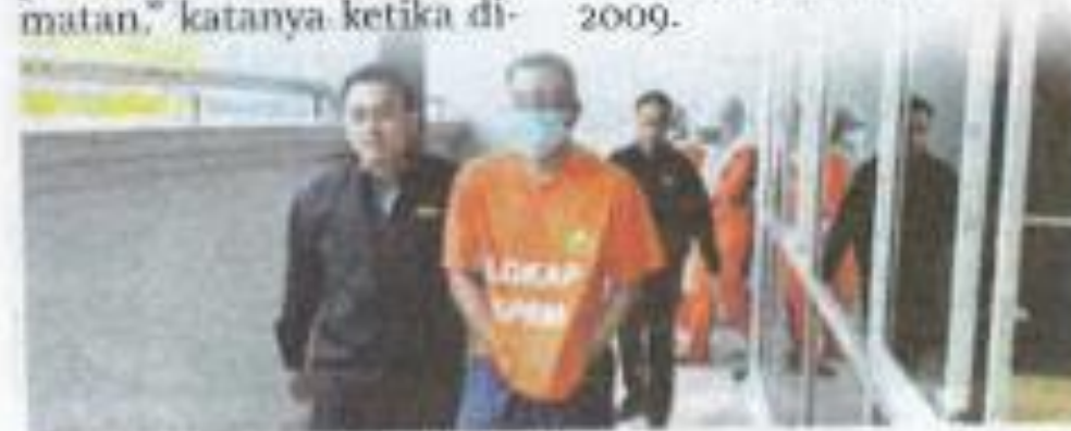
EMPAT penjawat awam dibawa ke Mahkamah Majistret Sivil untuk perintah reman selama tujuh hari.