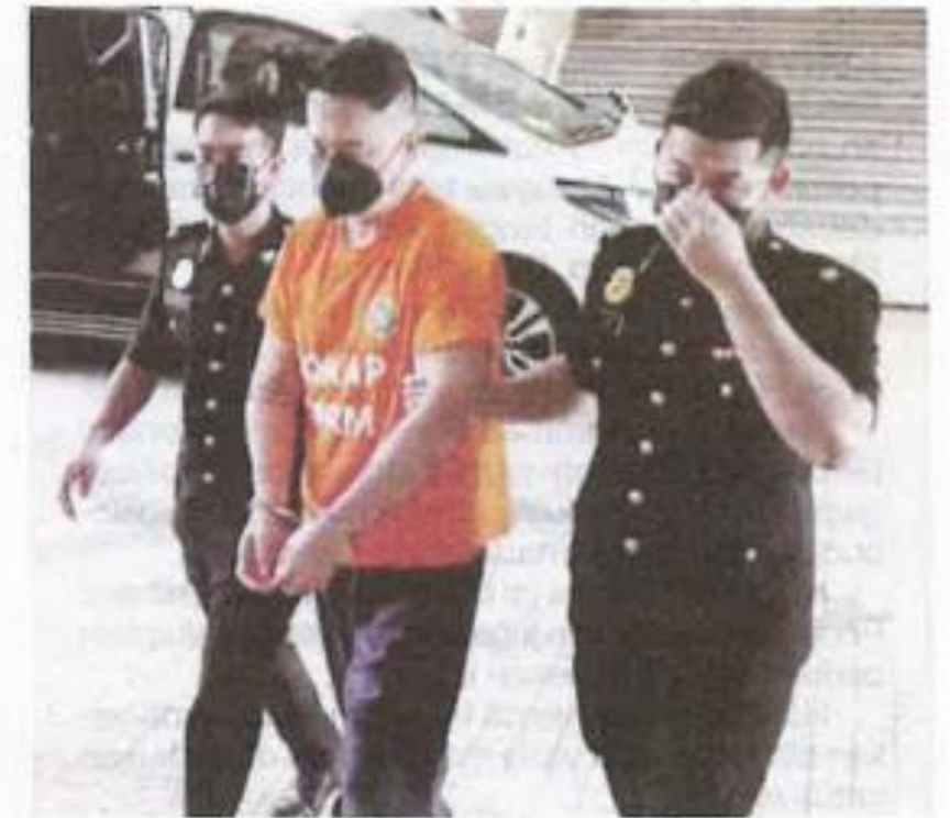
Lelaki warga Singapura (tengah) dipercayai jadi dalang kes kontena terbang diberkas Suruhanjaya Pencegahan Rasuah Malaysia di Putrajaya, pada Isnin.

SPRM sebelum ini mengesan lebih 100 syarikat disyaki terbabit sindiket 'kontena terbang' yang merasuah pegawai penguat kuasa bagi melicinkan proses penyeludupan tanpa melalui pengisytiharan serta pemeriksaan di pintu masuk negara.