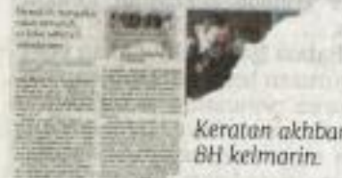
Keratan akhbar BH kelmarin.

2 lagi pembantu penguasa kastam didakwa rasuah