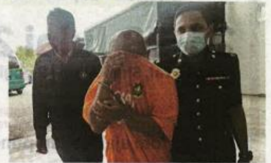
Suspek (tengah) dikawal anggota SPRM ketika tiba di Mahkamah Kota Bharu, Kelantan pada Isnin.

"Suspek ditahan bagi membantu siasatan ketika hadir di pejabat SPRM untuk diambil keterangan," katanya.