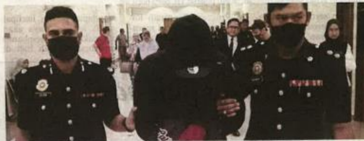
TERTUDUH dibawa keluar dari Mahkamah Sesyen Kuantan.

Tertuduh didakwa mengikut Seksyen 17(a) Akta Suruhanjaya Pencegahan Rasuah Malaysia 2009 yang boleh dihukum mengikut Seksyen 24(1) akta sama yang memperuntukkan hukuman penjara maksi-