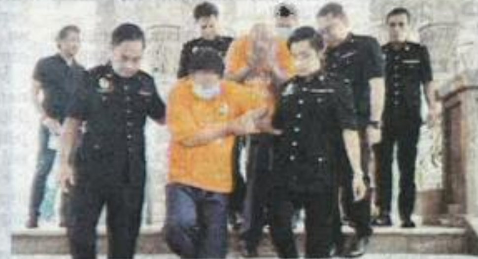
Sebahagian suspek yang ditahan SPRM babit siasatan kes rasuah berkaitan projek lebuhraya di Lembah Klang.

"Suspek dipercayai menerima wang rasuah daripada satu syarikat sebagai