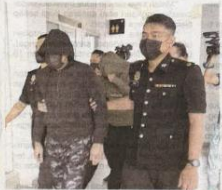
Kedua-dua tertuduh ketika keluar dari Mahkamah Sesyen Kota Bharu pada Ahad.