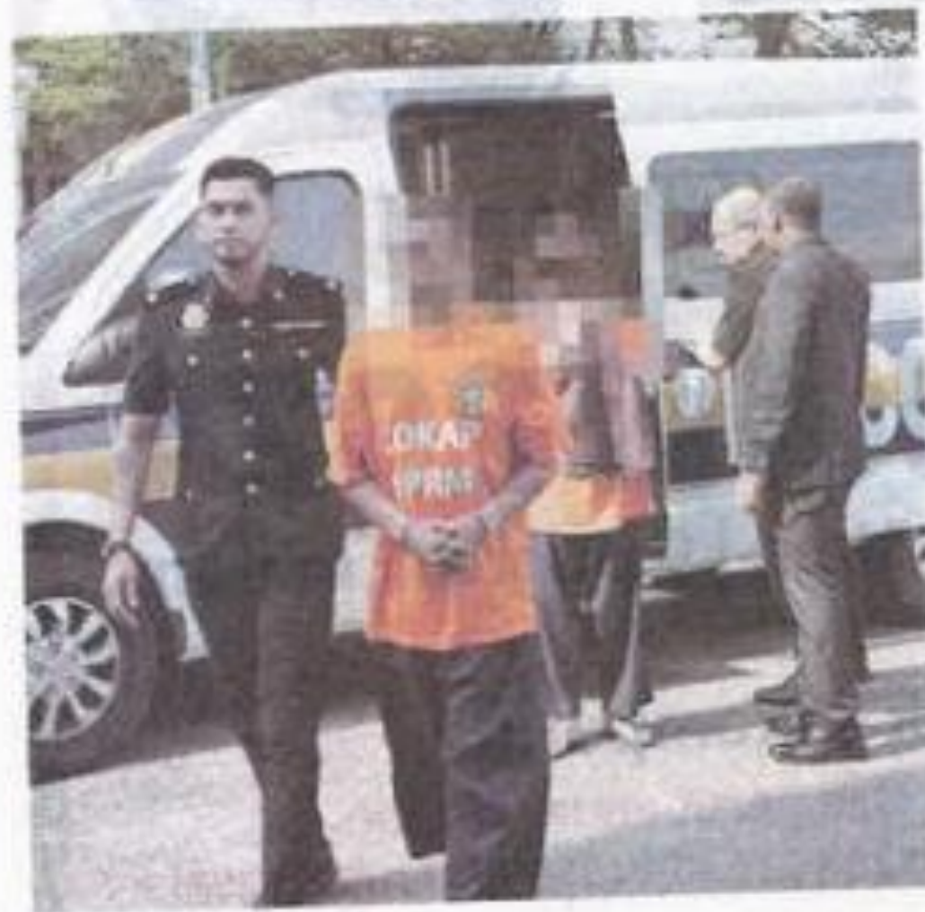
Dua penjawat awam tiba di Mahkamah Majistret Ipoh pada Rabu bagi mendapatkan perintah reman terhadap kes rasuah bernilai lebih RM700,000.

IPOH - Suruhanjaya Pencegahan Rasuah Malaysia (SPRM) Perak menahan dua penjawat awam yang disyaki menerima wang rasuah melibatkan kelulusan projek bernilai lebih RM700,000.