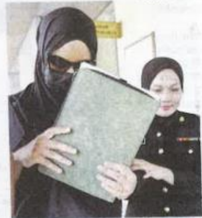
Tertuduh (kiri) mengaku tidak bersalah atas pertuduhan rasuah berhubung penganjuran Konsert Double Trouble 2 tahun lalu.

Semasa prosiding, Timbalan Pendakwa Raya, Mohamad Azriff Firdaus Mohamad Ali mencadangkan tertuduh diberikan ikat jamin