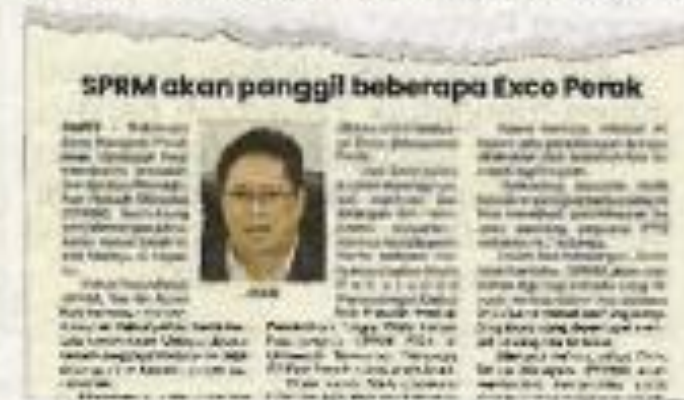
Laporan Sinar Harian pada Isnin.

Penambahan itu menjadikan jumlah keseluruhan TRM di negeri ini meningkat kepada 955,587.8 hektar.