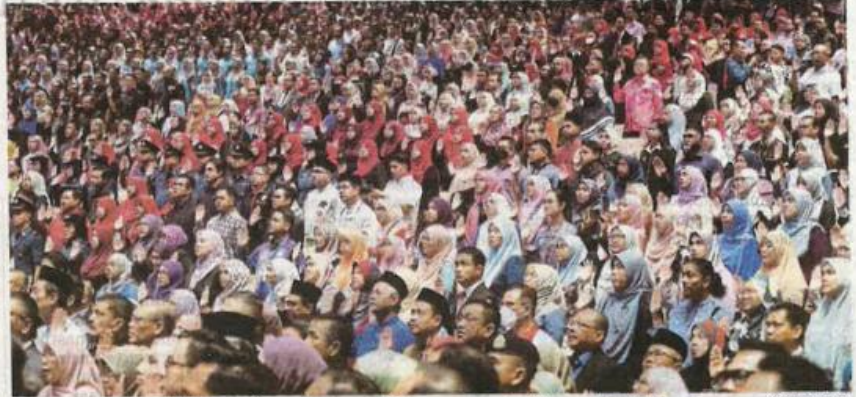
Penjawat awam digalakkan membantu kerajaan dalam menangani ketirisan dan rasuah.