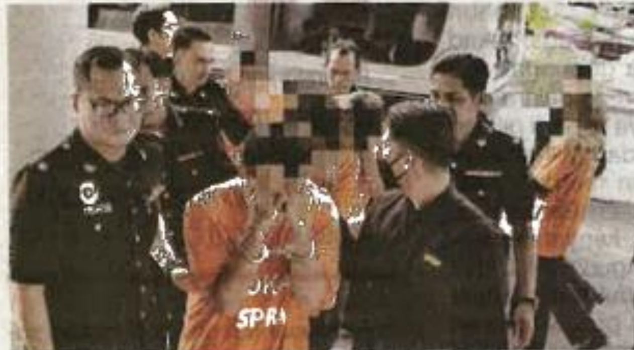
Lima individu direman pada Khamis bagi membantu siasatan kes penawaran dan penerimaan wang berjumlah lebih RM316,064.