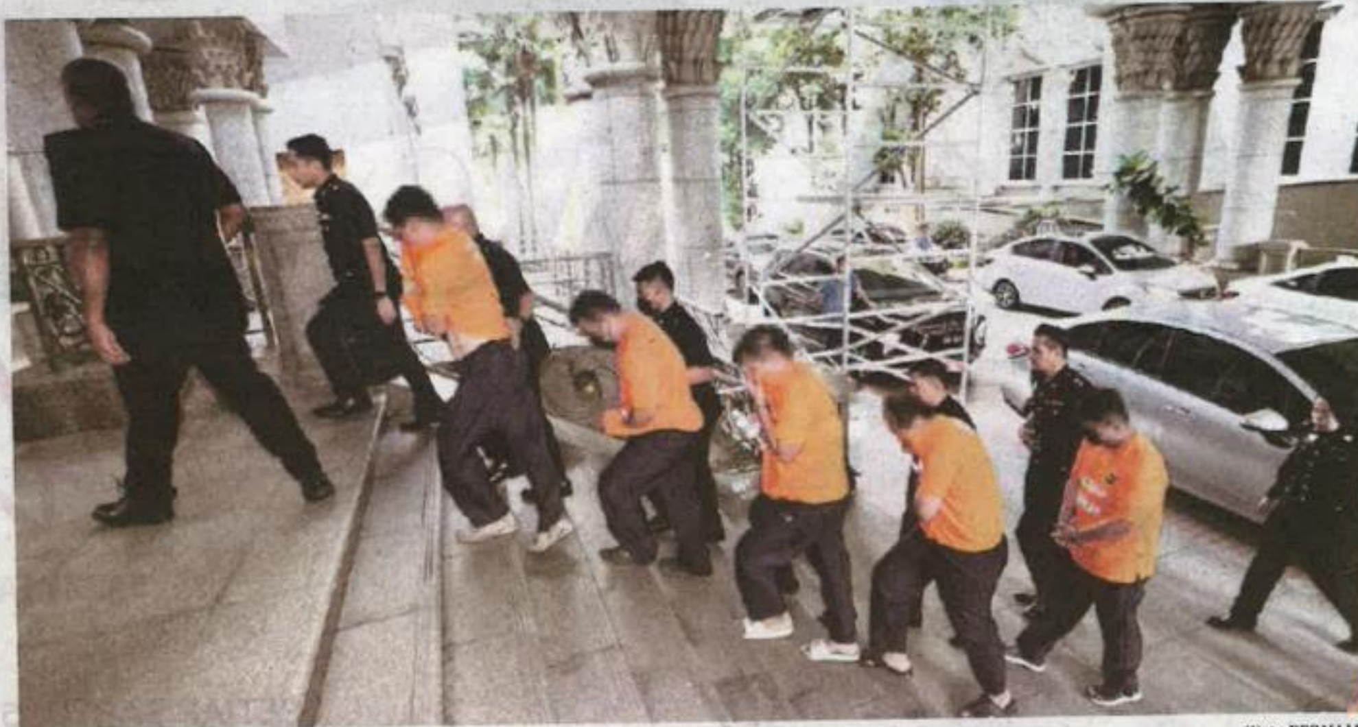
Antara individu yang ditahan reman di Mahkamah Majistret Putrajaya semalam.

"Dalang sindiket ini ialah seorang warga Singapura yang sedang bercuti bersama keluarga di luar negara dan daripada tangkapan itu SPRM telah membekukan sembilan akaun bank milik syarikat dan individu-individu terbabit," katanya.