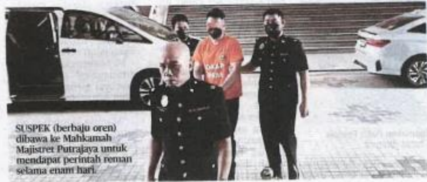
SUSPEK (berbaju oren) dibawa ke Mahkamah Majistret Putrajaya untuk mendapat perintah reman selama enam hari.

"Suspek disyaki melakukan perbuatan rasuah itu antara 2022 hingga tahun ini. Siasatan awal mendapati wang suapan itu di-