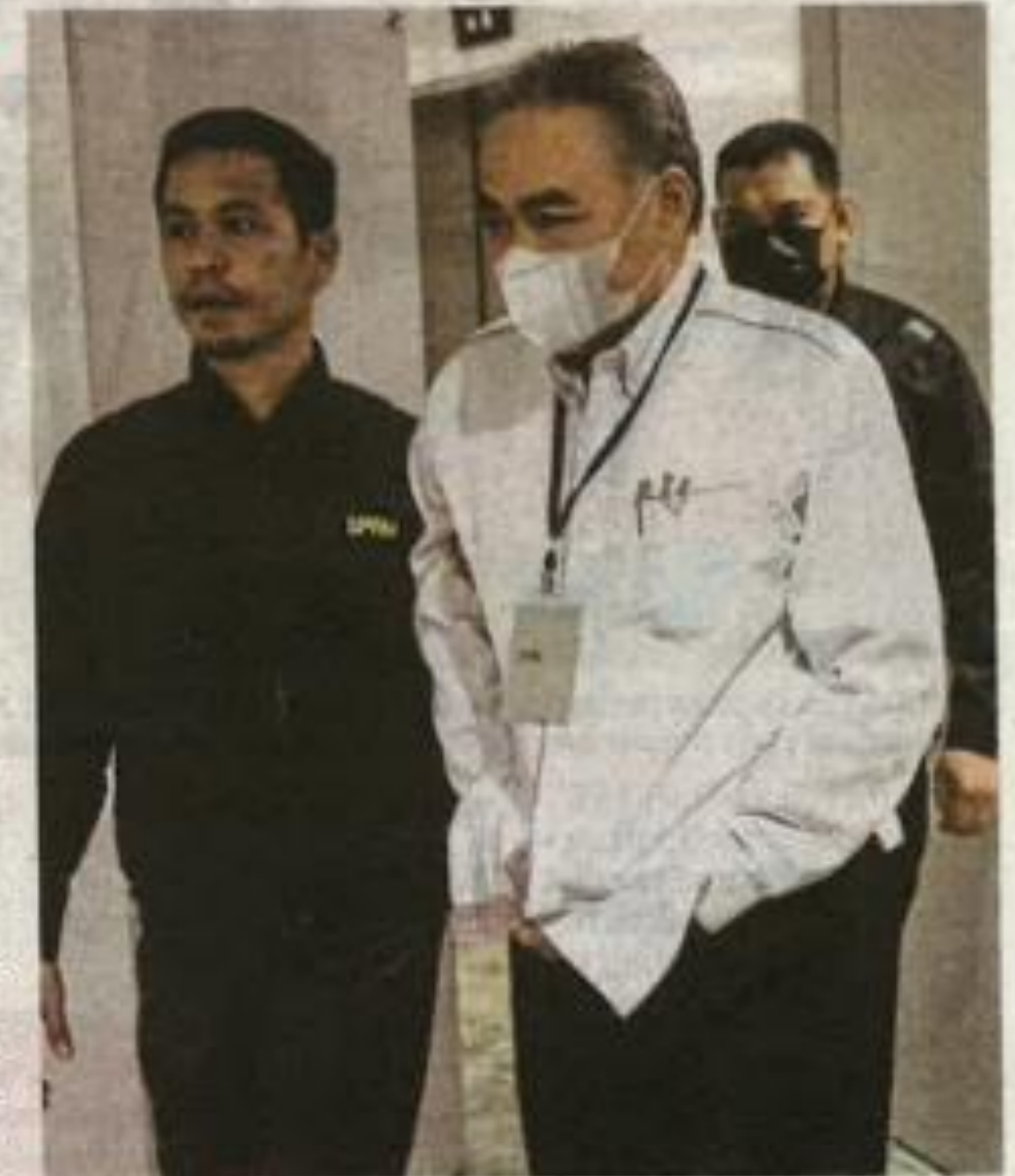
TERTUDUH dibawa keluar dari Mahkamah Sesyen Kuala Terengganu.

Tertuduh turut dikenakan syarat tambahan iaitu tidak dibenarkan mengganggu saksi sepanjang prosiding berlangsung, melaporkan diri di Pejabat SPRM pada setiap bulan antara satu hingga tujuh hari bulan dan menyerahkan pasport kepada mahkamah.