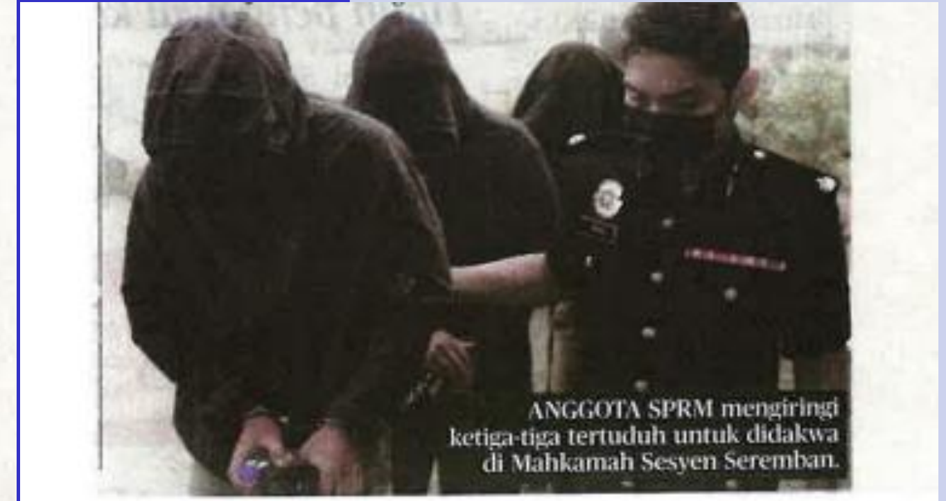
ANGGOTA SPRM mengiringi ketiga-tiga tertuduh untuk didakwa di Mahkamah Sesyen Seremban.

Mereka diminta menyerahkan pasport kepada mahkamah dan sebutan semula kes ditetapkan 12 Julai ini.