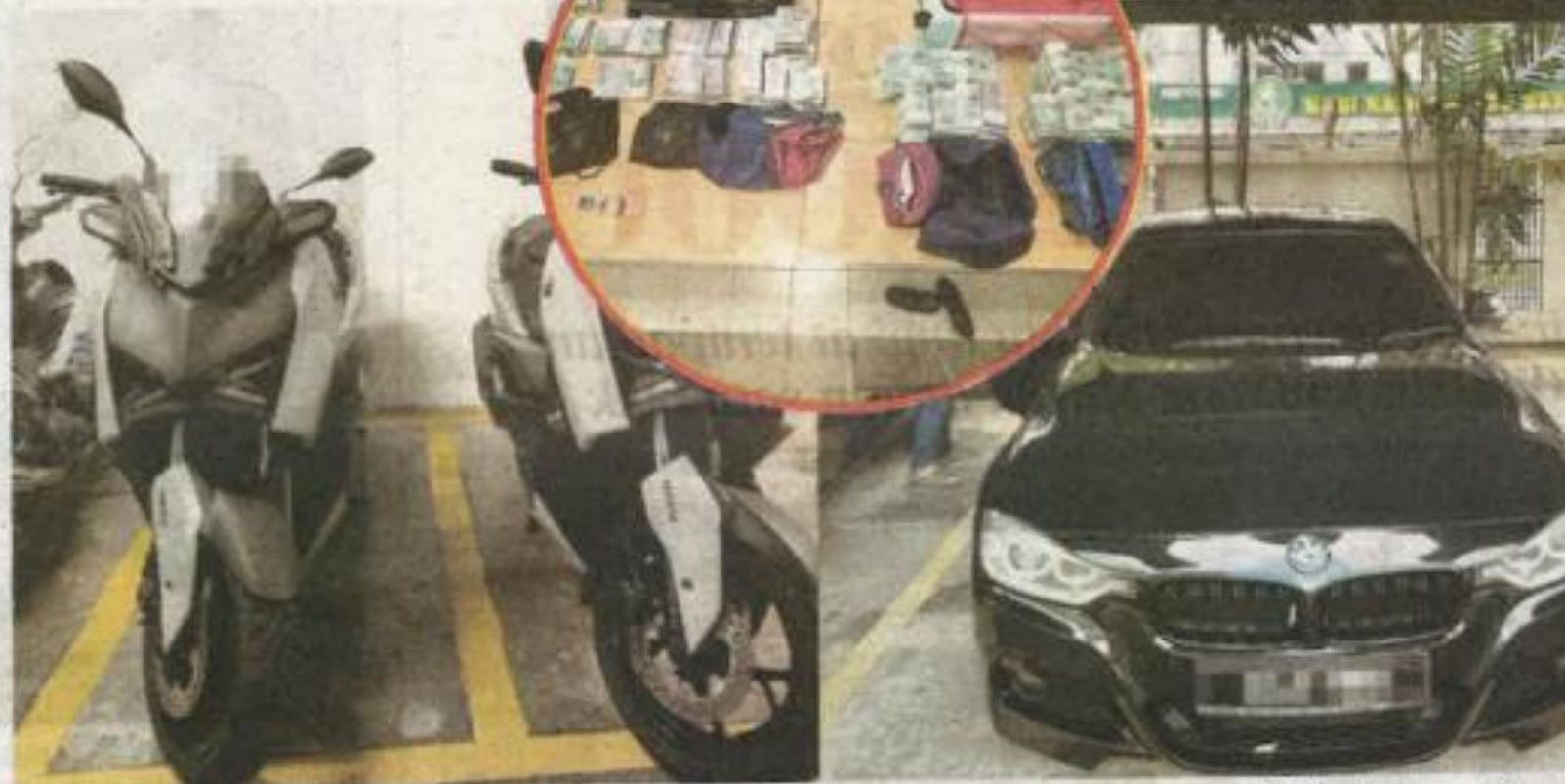
ANTARA kenderaan dan barangan yang disita SPRM daripada 11 pegawai KDRM yang dikaitkan dengan sindiket 'kontena terbang'.

"SPRM turut menyita empat motosikal Yamaha XMAX setiap satunya berharga kira-kira RM28,000, kenderaan Toyota Alphard bernilai lebih RM200,000, sebuah kereta BMW ter-