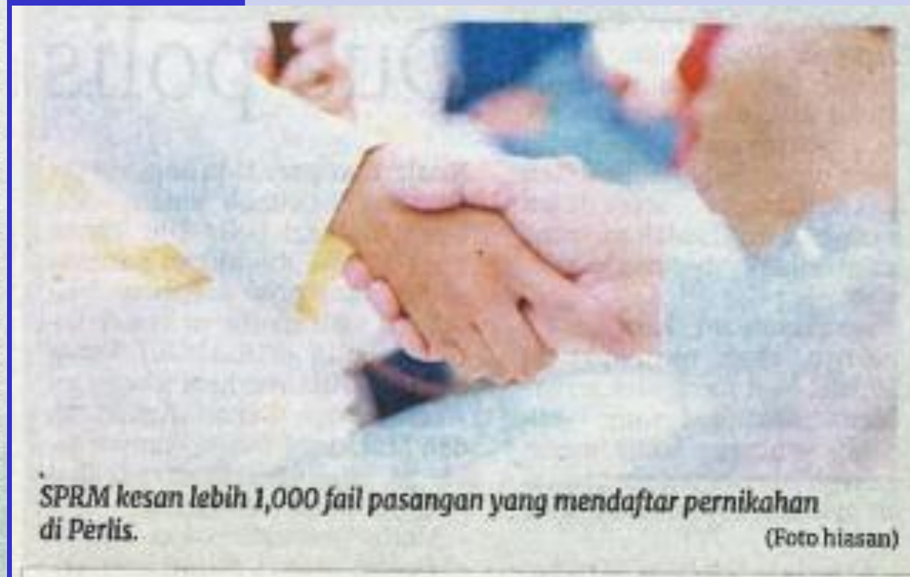
SPRM kesan lebih 1,000 fail pasangan yang mendaftar pernikahan di Perlis.

Beliau tidak menolak kemungkinan aktiviti berkenaan sudah berlaku sekian lama berdasarkan jumlah fail yang diterima.